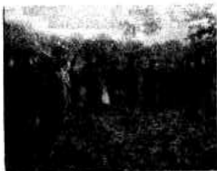
(深田で研修中の日本国民高生徒)

同校は、中年以上の方にはご存知のことと思いますが、隣国開拓義勇団といって、たくさん若人を訓練したところであり