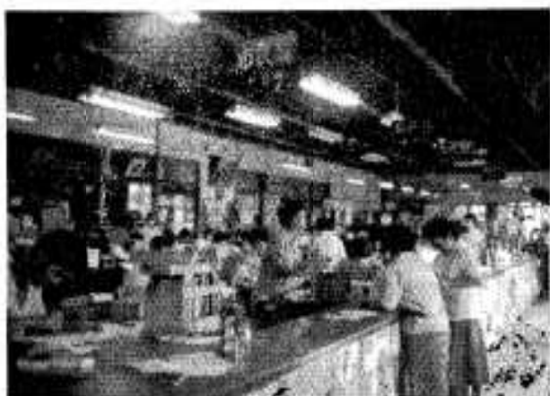
(市役所の窓口風景)