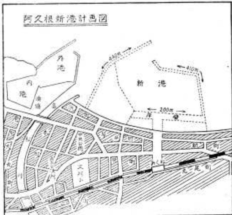
阿久根新港計画図

黒之浜港にも南側の防波堤に、阿久根港の西防波堤にある赤灯台と同じ灯台が、昭和三十八年度中に立つことでしょう。