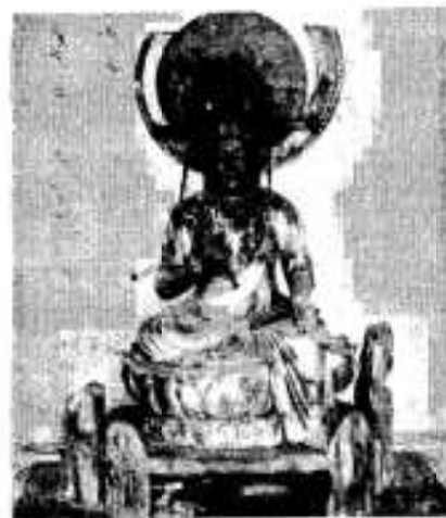
阿久根のむかしむかし (29)

南風を受ける園では、ソウカ病の発生がひどいので、防風垣をしゅう分設けてください。