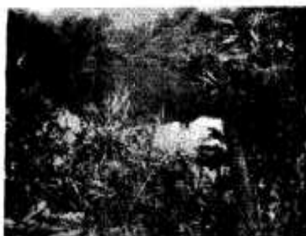
(記念碑と三月築北溜池)