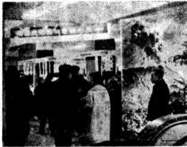
(にぎわう大丸デパートの展示会場)

さる1月29日から2月3日まで神戸で物産展示会が開かれ、阿久根市も特産物を出品し、ひじょうに好評でした。こゝにその模様をお知らせいたします。