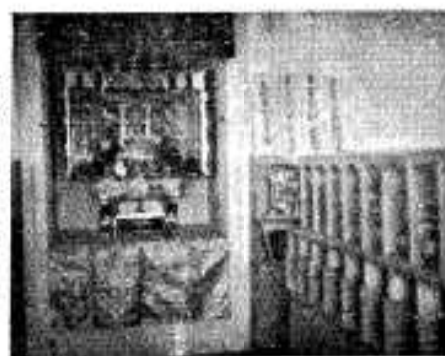
(内部の仏壇と遺骨箱)