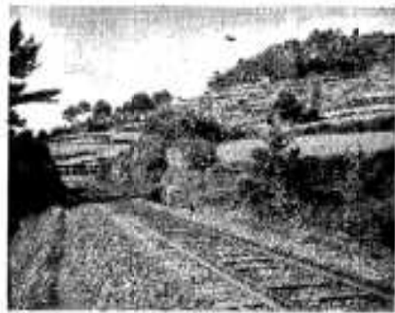
(鹿児島本線から見た深迫古戦場)