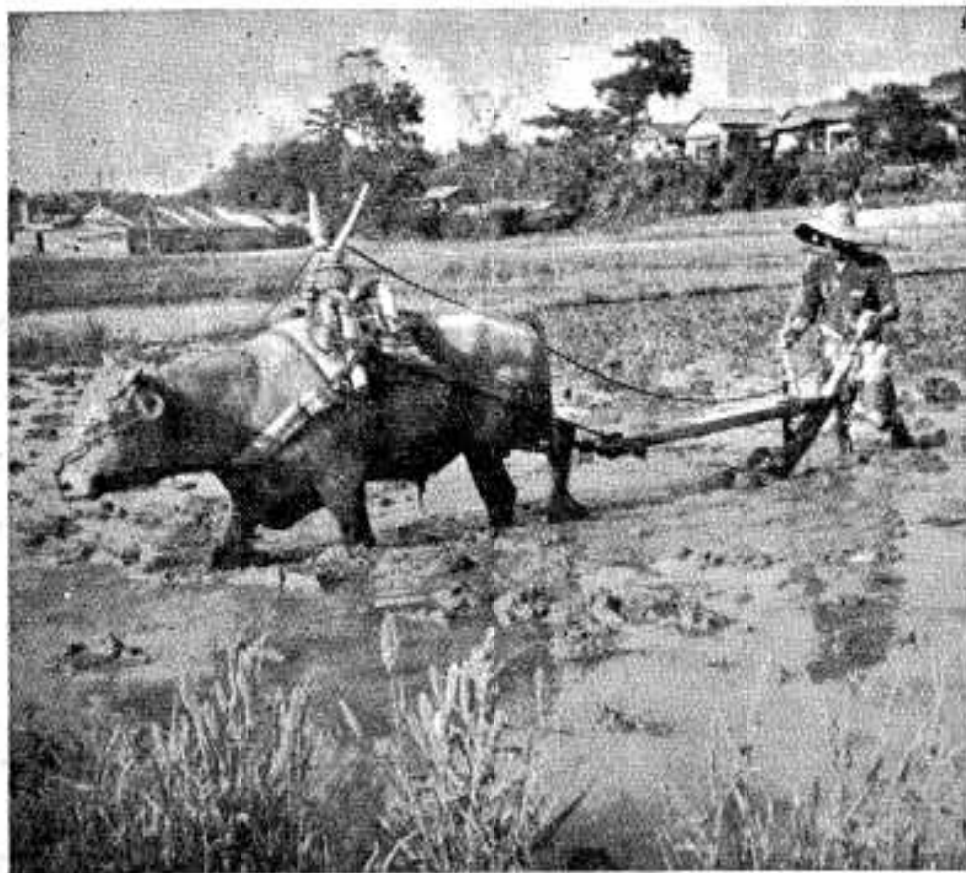
「雨あがりのたんぼ」 機械化が進んでも、残したいこの風景、なにか詩がわきそうです。蛙も「ケロケロ」なっています。

これからは、そでの短い、胸あきのひろい洋服を着ることが多くなります。ご婦人方は、下着をととのえて、はじめて、美しい夏姿ということをお忘れならないように。 とくに中年ともなると、下を向いたとき、みぐるしいためにもブラジャーをつけておきたいものです。 食 暑くなると、子どもたちがアイスキャンディーやアイスクリームなど、冷たい飲みものをほしがります。おとなとい