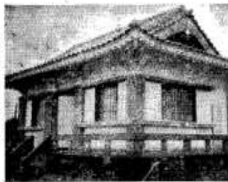
(お寺のような外観)

の骨組だけで、これからのいろいろと肉がつけられます。記念行事としてすでにすんだのに、四月一二日の記念植樹祭と、五月一三日の文芸春秋社の文化講演会がありました。六月九・一〇の両日は、県下各市役所対抗の卓球大会が、阿久根小学校の講堂で行なわれます。七月一九日は前夜祭ですが、朝早く鹿見島市を出発した、県・南日本新聞社・南日本放送のパレードに、午前一時西方駅前まで、市と商工会議所の車が合同し、当日は市内はもちろん、出水まで北陸一円を、宣伝パレードします。ま