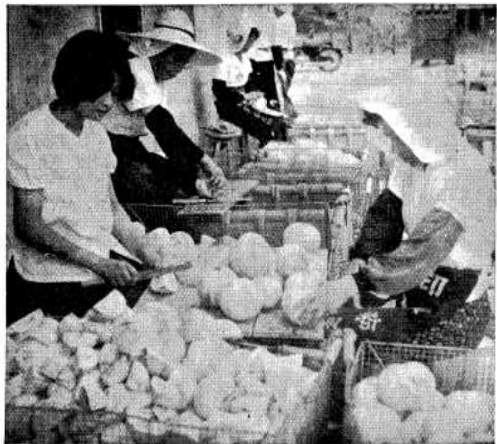
ポントン加工工場（ポントンの皮をむいて、船形に切っているところ）