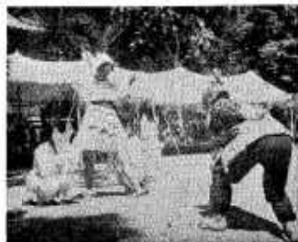
「兵六、兵六、サンバ 24才ともなれば」

市民のみなさまで市政に対し、要望、ご意見、あるいはお困りのことでもございましたら、ご遠慮なくお聞かせください。(市長)