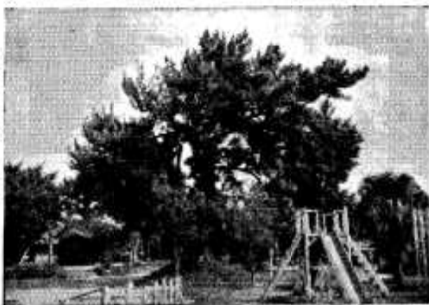
(左半分を松くい虫で枯れた山下小学校の松)

松くい虫が発生し、あかく立枯れした松が、市内の各所に見かけられます。これはほんの一部分であつて、これから全域に広がる恐れがあるので、松くい虫の防除は、早目に徹底的に行ないましょう。