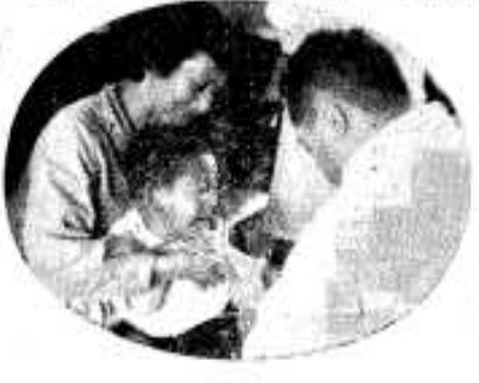
小児マヒ予防注射

購置落成を機会に鼓笛隊ができました。経費12万円で5年生100名の男女をもって編成されています