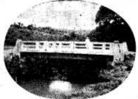
下内田橋完成(内田)