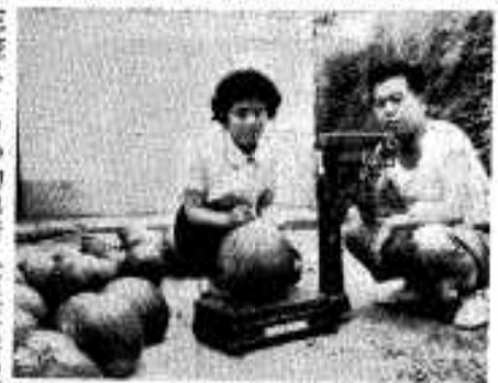
三笠スイカの初出荷(三笠農協)

高松川のアユはさる六月一日から解禁されました。高松川漁協では、アユを獲る方に、古い監視では獲れないので、試験金を納めて新監視をとるよう呼びかけています。試験金は、たて額八〇〇円、投網三〇〇円、アユかけ一〇〇円となっています。