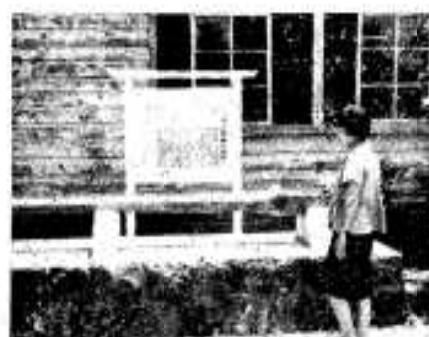
玄奘わきの「阿久根砲」