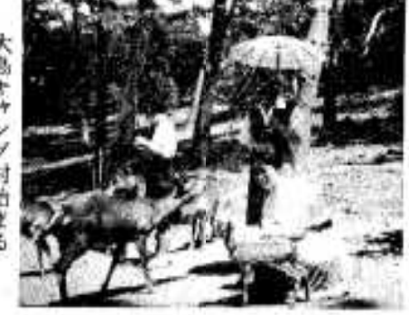
大島キャンプ村始まる