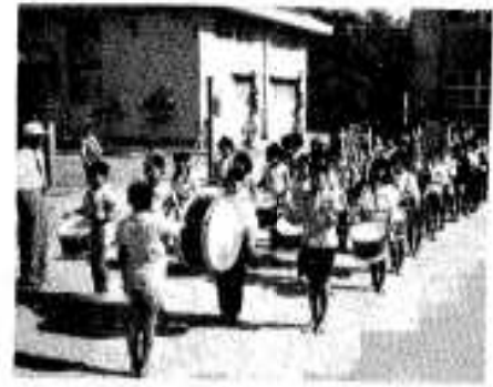
阿小の鼓笛隊誕生

購置落成を機会に鼓笛隊ができました。経費12万円で5年生100名の男女をもって編成されています