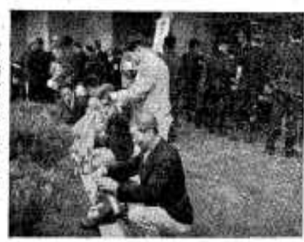
(まづ賞品を包んで)