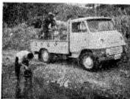
高松川漁協は若アユ2万匹を高松川に放流しました