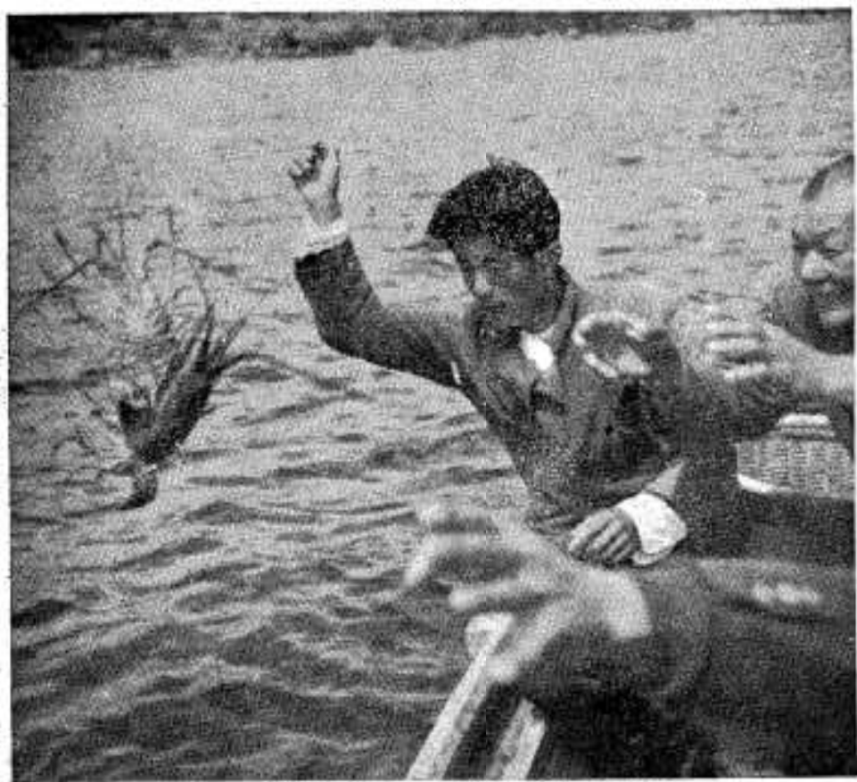
繁殖用いせえびの放流(黒之浜)