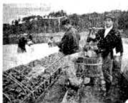
促成栽培の定植(山下の青電さん)

阿久根市内の工友会では2月4日役員会を開き、大工賃金を3月1日から七百元(現行六百元)にすることに協定しました。