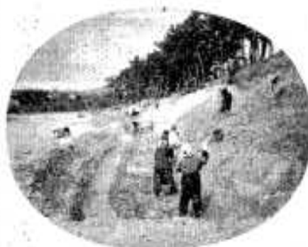
脇本白河護岸工事