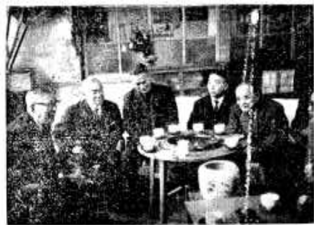
懇談会(右端は別府市長、左端は阿久根市長)

さる2月1日大分県の別府市長始め商工団体の役員7人は、両市を結ぶ阿久根特産ポントンのことで話し合いたいと、当市にわざわざ見えたので、当市側も市長・議長・商工会議所会頭・農協長・生産者代表など出席して、ひざを交えて懇談しました。