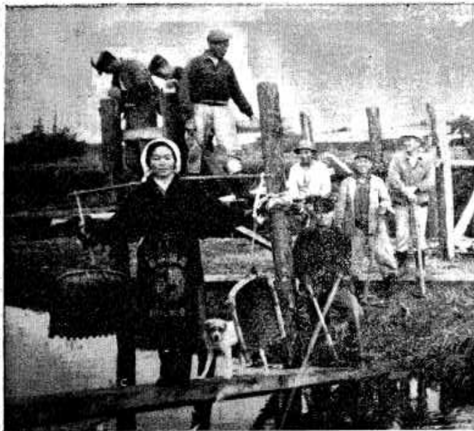
山下と長野とを結ぶ前川原橋の架橋工事進む(山下)