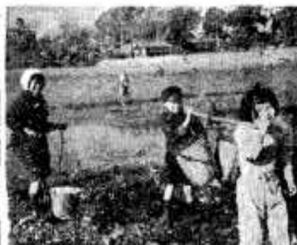
春闘ボカボカ水ぬるむ (折口川口では川ノリとりで老若男女和気あいあい)