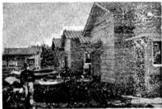
(完成を急ぐ赤瀬川遺地)