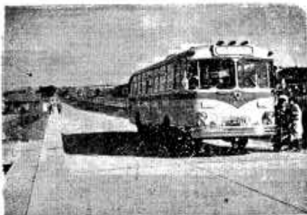
のびる舗装道路 (吾附近)

当市の国道舗装状況は他の地域にくらべて比較的におくれていましたが、市の再三にわたる政府当局に対する折衝により、九州地建の出張所を誘致することになり、これで国道整備を、さらに前進させることになりました