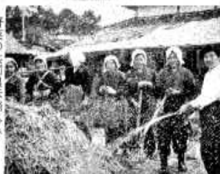
野菜の共同風床踏み (佐治ヌミレグループ)