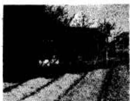
船型岩(梅の木の中)

2月の中旬は第2回目の追肥時期です。この時期は麦の穂のできはじめる時で、追肥はこのできはじめた穂を丈夫に育てるためのもので、量は硫酸を4から8Kまたは尿素を2から4K程度です。追肥の後はずく中耕土入れした方が一層その効果があります。