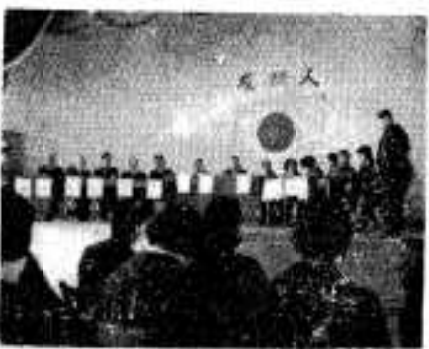
成人おめでと(五三四人)