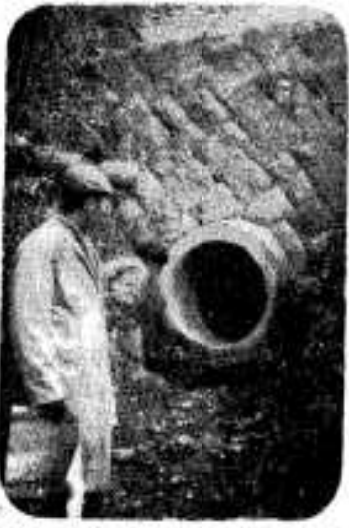
あんきよ完成(仲仁出)