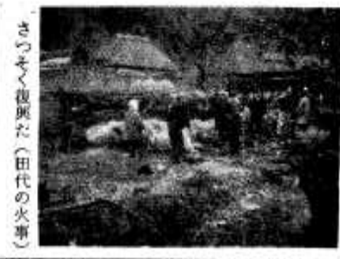
さつそく復興た(田代の火車)