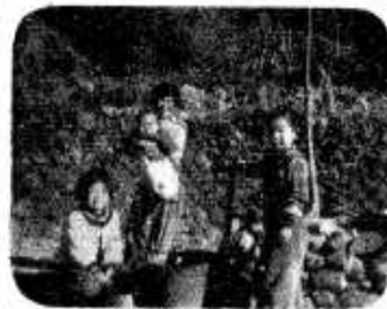
「ワイ・これで水くみせん得意いぞ」(前場)