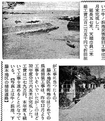
阿久根市海岸防波堤地区舗装道路完成

またいつかは、育て、いたゞいたくつかしの阿久根に舞い戻つて、今後ともお顔見捨てなくご指導、ご鞭撻くださるよう伏しお願い申し上げます。 おわりに皆様方の健康と阿久根市の発展をはかる南園の地からお祈りしつ、お礼詞にかえさせていただきます。