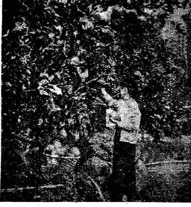
「文旦の取り入れ始る」 今年も減収だといわれる文旦もこゝ山下の農家の庭先では盛んに取り入れが始まっている。

光礮物語や 民謡大会など 十月十七、十八日の両日は、阿久根小学校講堂において、午後七時より演劇