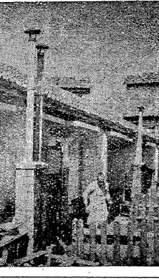
総工費二七万四千円を、高松の住宅は、第一種簡易もつて、阿久根建設の手で