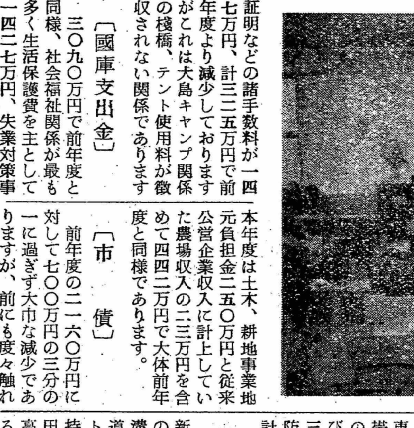
昭和三十一年度、昭和三十二年に引続き、(1)全市民の負担の公平と利益の均等を図り、(2)財政の健全化に意を用い、(3)消耗の経費を抑制し、(4)事業の遂行に必要とする事業費を豊富にする。

事業経費を豊富に 昭和三十一年度、事業経費は前年度に對して約九四・五%、五〇・五六七九二五圓を計上した。これは算上総額の三五・二九%となつて、前年度より一・七%の増減である。