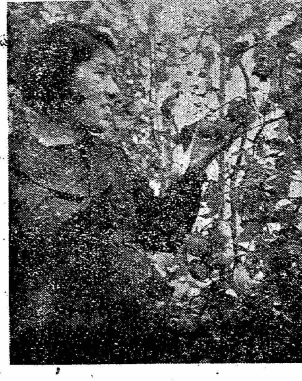
美味い！ 促成トマト 16日に農業高校で初出荷