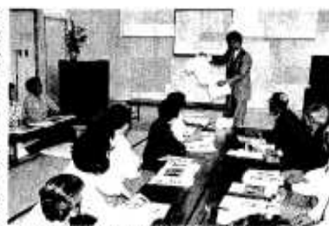
様々な介護用品の紹介もありました

また、ビデオによる介護方法の講習や、実際にお年寄りを介護している桜ヶ丘荘の職員との