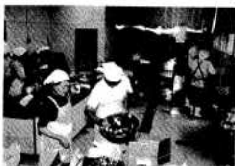
手作りの調味料を作る生活改善グループの皆さん