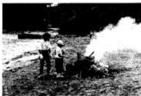
流木などを焼却する参加者