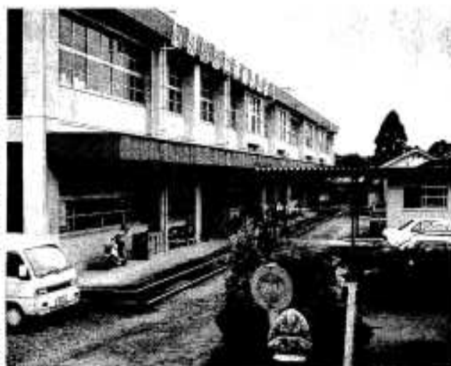
危険校舎の改築が行われる山下小学校

一般会計補正予算は、県道阿久根東郷線整備負担金や山下小学校校舎改築工事費など三億五千四百六十七万九千円を追加し、予算総額を百二十一億八千五百七十五万六千円としました。