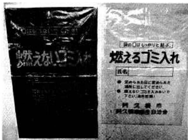
統一される収集用ごみ袋