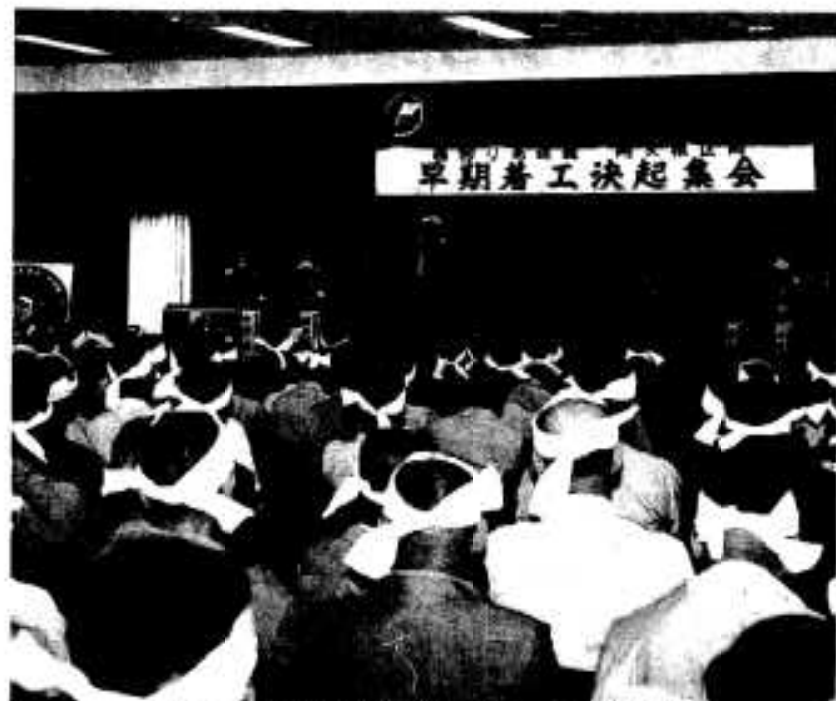
出席者全員が鉢巻きを締め、熱気に包まれた集会

それぞれ立場から「整備が進む漁港を更に有効活用するためにも、一日も早い実現を」過疎化を止めるためにも西回り道は必要「阿久根をもっと大切に考えて」など市民の切実な声を訴えました。