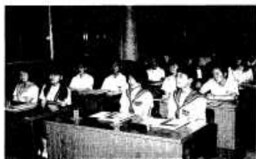
派遣を前に研修を受ける生徒ら

五月末、本年度の派遣生が決定。出発前の事前研修を経て、七月末、アメリカ合衆国へ向け飛び立ちます。