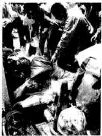
たくさんのごみが集まった阿中クリーン作戦

大島に着いた一行は、まず海水浴場の開りを中心に清掃を開始。燃える物と燃えない物に分けて約一時間程、収集作業をしました。浜辺には空き缶や流木、ガラス瓶などが散乱しており、参加者たちはゴミの多さに驚き