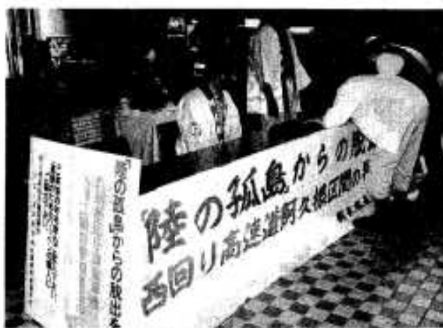
市役所玄関ホールでの署名活動

阿久根高速交通体系整備促進民間協議会は、西回り自動車道早期実現へ向け六月から署名活動を開始。六月八日と九日には、市役所玄関ロビーで来庁者への署名を呼び掛けました。