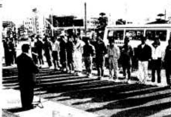
市役所前での壮行会