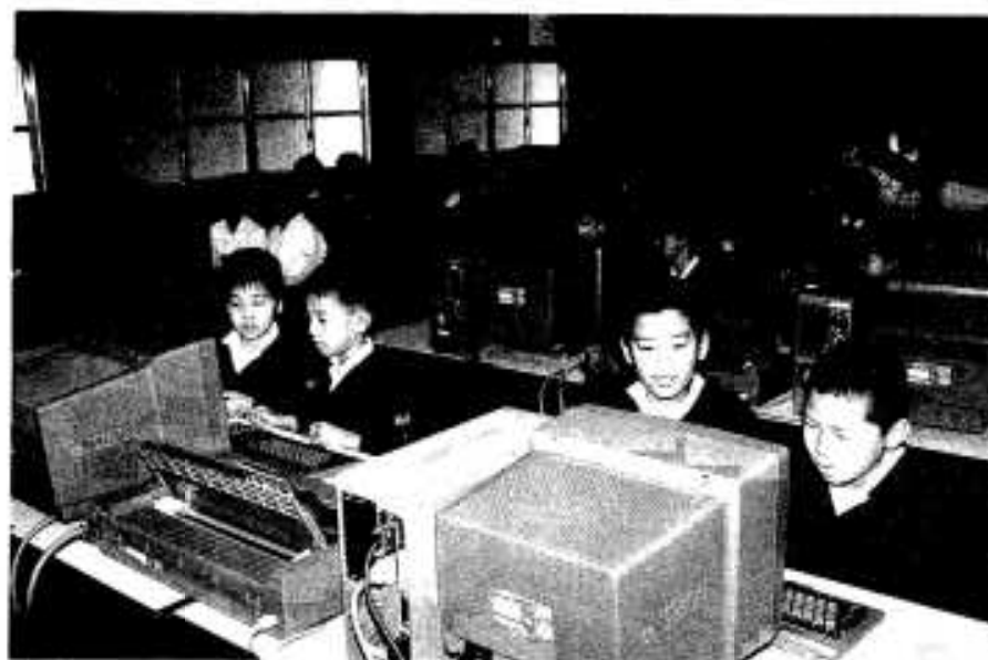
パソコンの画面をくい入るように見つめる児童たち

今回導入されたパソコン機器は十九台。老朽化していた図工室や家庭科室を新しく建て替え