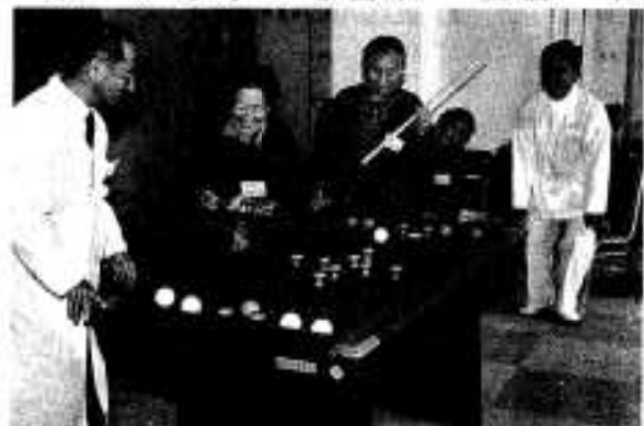
ゲームに興じるお年寄りたち

完成した同センターは、鉄筋平家建て、床面積約四百三十二平方メートル、食堂や浴室のほか、相談室やスナックのある広い和室も設けられています。機能回復訓練機器やゲーム器具なども備えられ、またレクリエーションのメニューも週ごとに変わられ、楽しみながら運動や友だちづくりができる内容となっています。