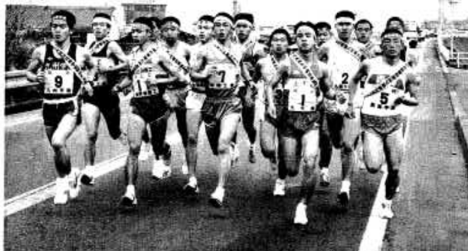
今年はどうなレースが展開されるのか (写真は昨年のももの)