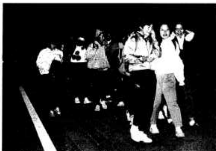
日も暮れ、冷え込んだ夜の道を歩く生徒たち

鶴川内中の生徒たちが二月八日夜、立志式の記念に約二十キロを歩き通す夜間歩行に挑戦しました。 寒風の中、参加したのは二年生二十九人のほか、きょうだいや父母ら約五十人。昨年までは餅つきを行っていましたが、思い出づくりと生徒たちの自信につなげればと、今回初めて実施したものです。 日も暮れた夕方六時に学校を出発。冷たい風が吹きつける中、総合運動公園へ折口へ橋本へ国道389号バイパスのコースを約五時間かけて進みました。