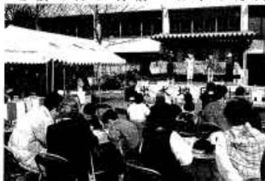
特設舞台では愉快的劇も披露

会場となった市中央公民館前広場には出水郡内一市四町の青年団が、それぞれの地域ごとにテントを張り、特産品の展示即売のほか、うどんや鍋物などの模擬店を出店。特設舞台では演劇や合唱など、各団が趣向をこ