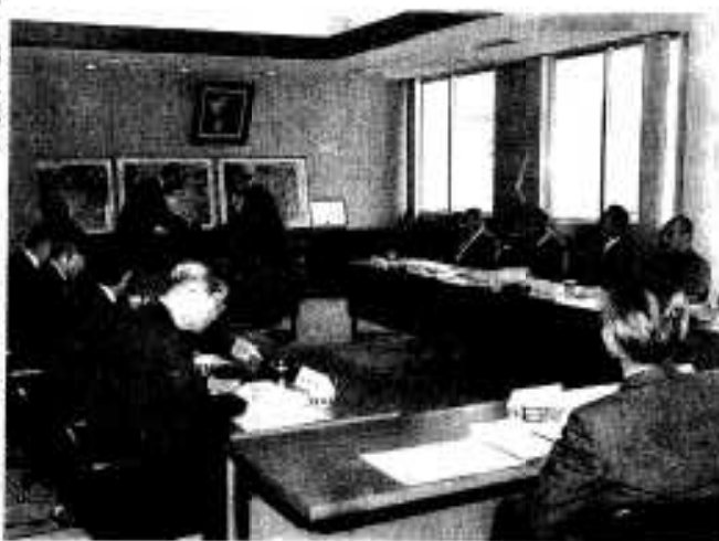
市役所で行われた辞令交付式

現在進められている潟土地区画整理事業について、健全な市街地の造成と事業の円滑な推進について、様々な審議をしていただく潟土地区画整理審議会の委員選挙が行われ二月二十八日改選後初めての審議会が市役所で開かれました。