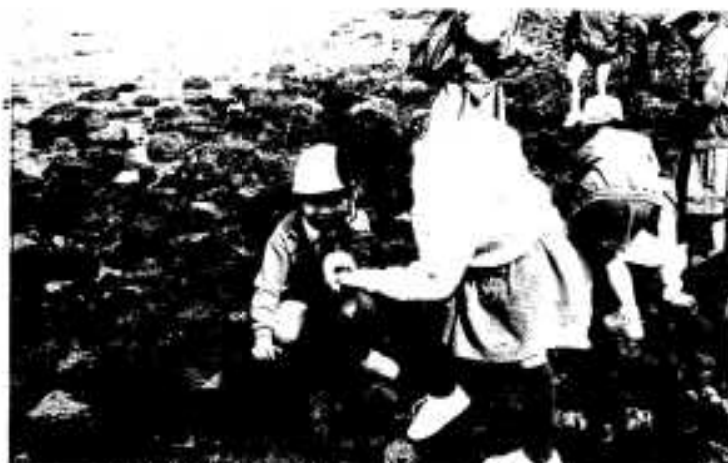
合同学習会で貝採りを楽しむ生徒たち