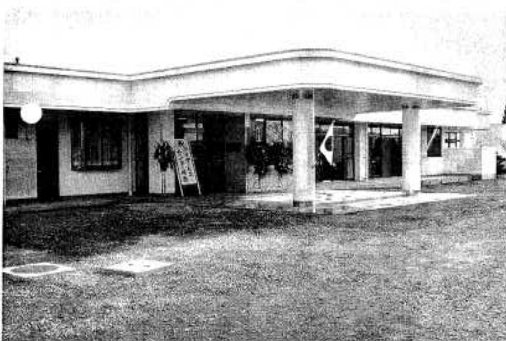
完成したデイサービスセンター

人生八十年時代。本市でも全人口の約二割が六十五歳以上という高齢化社会を迎えています。年を取ると家に引きこもりがちになり、体の機能も低下してきます。すこやかな老後を送るためには、健康を保ち、友だちや生きがいづくりを積極的に行うことが大切です。本市では、在宅のお年寄りを対象に、互いの交流の場づくりと健康保持を目的に、この程デイサービス事業を開始しました。