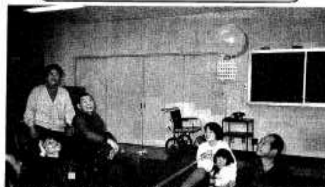
楽しいゲームも開催します(写真: 風船パレーボール)

※野犬等の苦情については、直接出水保健所までご連絡ください。(☎3111) お問い合わせは 保健センター ⑦3768まで