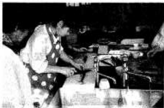
指導を受けながらイワシ料理に挑戦

鶴川内中の生徒たちが二月八日夜、立志式の記念に約二十キロを歩き通す夜間歩行に挑戦しました。 寒風の中、参加したのは二年生二十九人のほか、きょうだいや父母ら約五十人。昨年までは餅つきを行っていましたが、思い出づくりと生徒たちの自信につなげればと、今回初めて実施したものです。 日も暮れた夕方六時に学校を出発。冷たい風が吹きつける中、総合運動公園へ折口へ橋本へ国道389号バイパスのコースを約五時間かけて進みました。