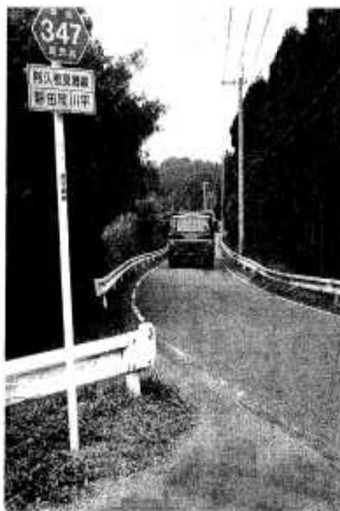
現在は大型車が通ると難合が難しい箇所が多い