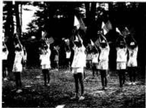
いろいろな体験を(水産教室で手旗信号の講習)

豊かな自然と郷土の持つ優れた文化を活かし、生涯教育の観点に立ち、生きがいづくりと地域づくりを進めるため、市民一人ひとりの学習意欲の高揚をめざした社会教育を実践することが重要です。