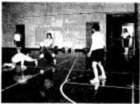
バレーボールは人気のスポーツ

生活の安定と余暇の増大等によりスポーツへの関心と欲求が高まる中、現在市体育協会に二十一の種目別単位協会、十の校区体協が加盟しています。スポーツ少年団も二十九団体、七百九十八名(平成二年四月現在)に増加し、仲間づくりと体力づくりを実践しています。