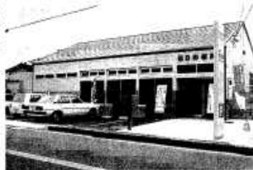
新築された西目郵便局

当郵便局は、昭和十一年に郵便取扱所として開設されて以来、地区の主要施設として郵便業務をはじめとした諸サービスを任