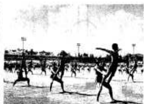
大川中の見事な集団演技