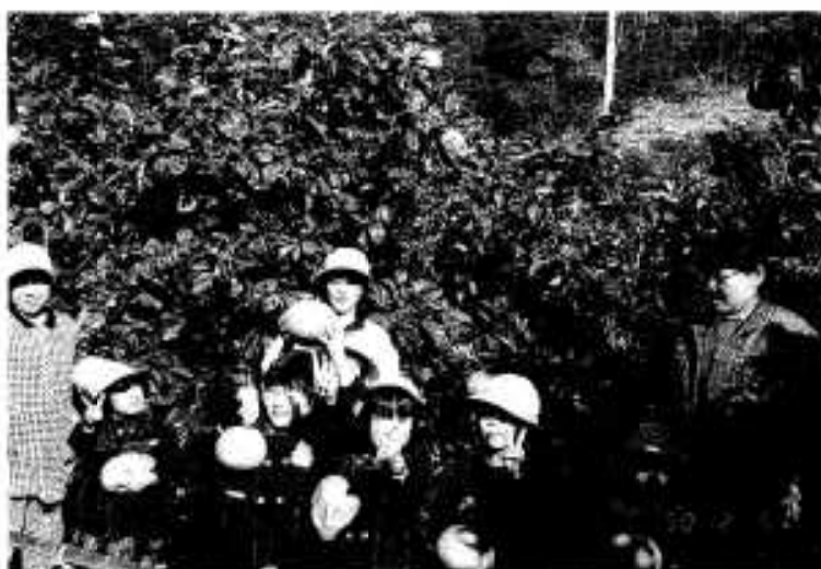
みんな来てネ。(写真は昨年のもので)

※会場へは、案内板に従って御来場ください。 詳しいこと、お問い合わせは、市観光協会 (市役所内)まで。☎73-1211 内線1113