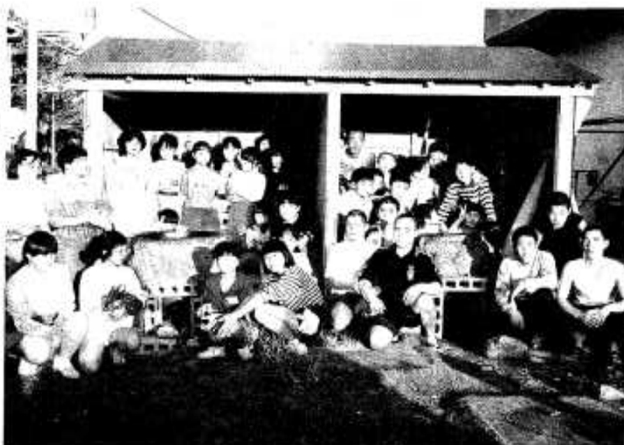
完成したごえもん風呂を背景に記念撮影

七泊八日の期間中、子供たちは家に帰らず、洗濯や掃除は自分たちで行い、おやつやテレビも無い、普段とは全く違った生活を送りました。 入寮初日、子供たちは期間中自分たちが入る「ごえもん風呂」づくりに挑戦。中学生が泥を足で練り、小学生が鉄がまのまわ