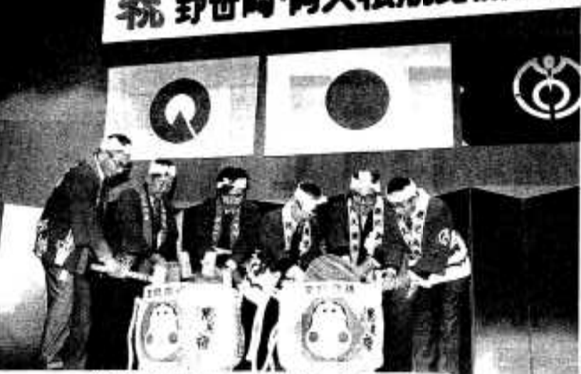
航路開設を祝い鏡割りをする関係者ら

本市と長崎県野母崎町を高速艇で結ぶ不定期航路が今年六月に開設されました。この「海の道」開通を祝う記念式典が十月八日、野母崎町民センターで盛大に開催されました。