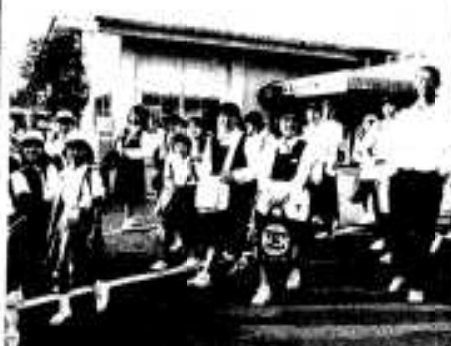
全員そろって元気に登校

子供たちが家庭を離れ、共同生活を送りながら学校へ通う阿久根「よかどし学寮」が十月十九日から二十六日まで、臨本地区公民館で開かれました。 今年も臨本小と三笠中の男女三十七人の児童・生徒が参加。年齢の異なる子供たちが集まり一語に生活することで、自立心や忍耐力を養うとともに感謝や思いやりの心を育むのが狙い。