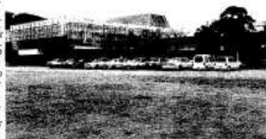
施設の拡大、充実が望まれる市民会館