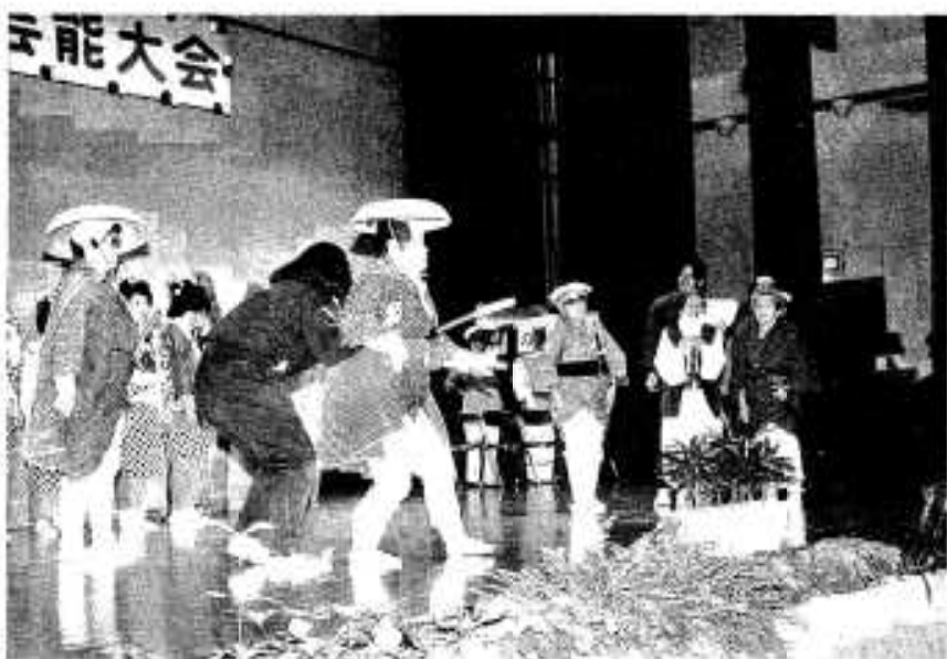
音だけを頼りに名演技が続く

盲養護老人ホーム「蓮の実園」のお年寄りたちが十月二十三日、市中央公民館で開かれた出水地区老人福祉施設芸術大会で、オリジナルの劇を披露しました。目の不自由さを克服しての初舞台。名セリフ、名演技に拍手が