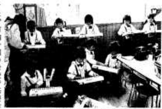
重要さを増す幼児教育

では、市内十四の学校で基礎学力の向上と創造性豊かな教育をめざしていますが、近年、児童・生徒数の減少が深刻になっており、小学校三校で複式学級となっています。