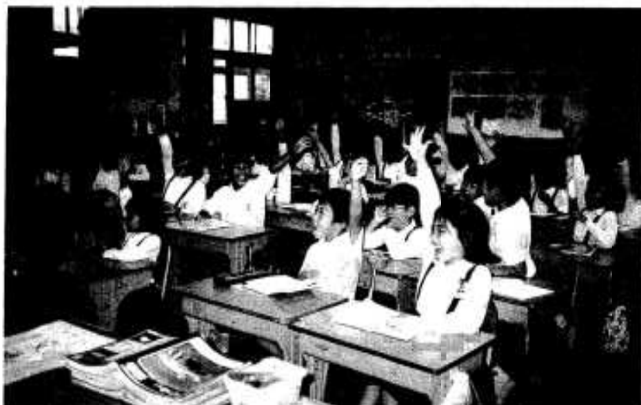
元気な子供たちのために明るい未来を