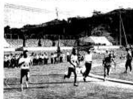
大会注目の種目「校区対抗リレー」