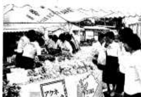
特産品が並べられたうんどんが市

「幸福とは」が観客の大きな笑いの中で演じられました。地域の活性化を願う同クラブ員の熱演に大きな拍手が送られていました。