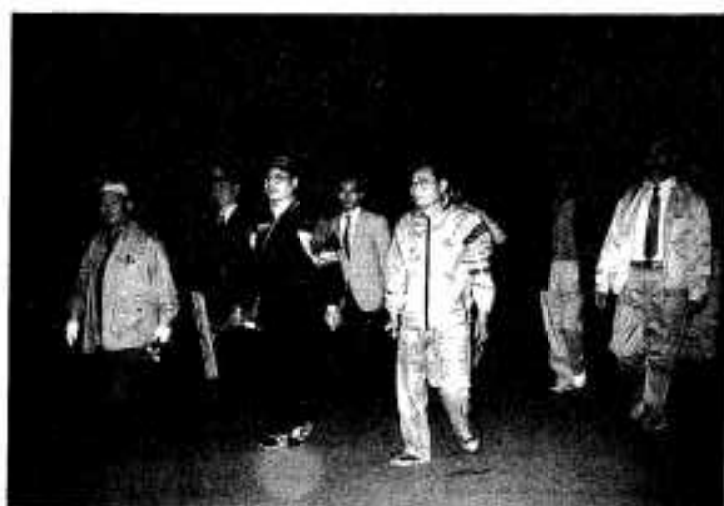
夜の海岸をパトロールする関係者ら

今年五月十八日に第一号の上陸・産卵が確認されています。市民の皆さんもウミガメ保護に対する意識を高めてもらい、同時にウミガメの訪れるすばらしい自然環境を市民共有の財産として残していけるよう、環境保全にもご協力ください。