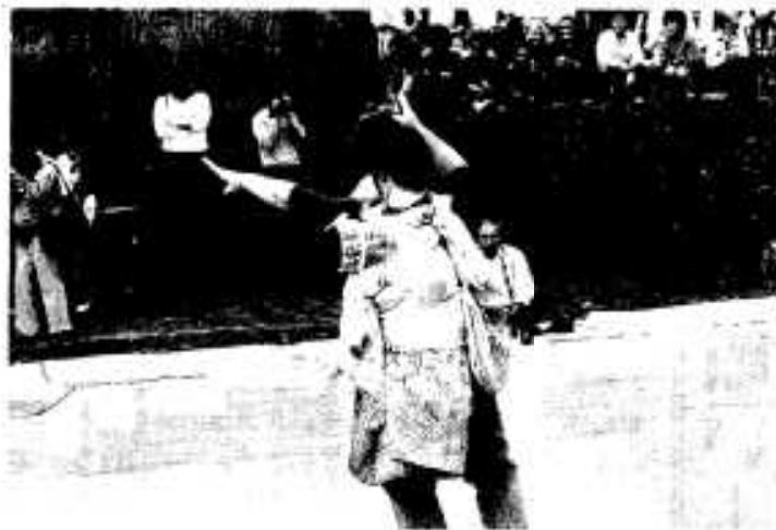
「もう疲れちゃった。おやすみなさい。」