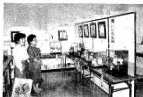
どれも力作ばかり