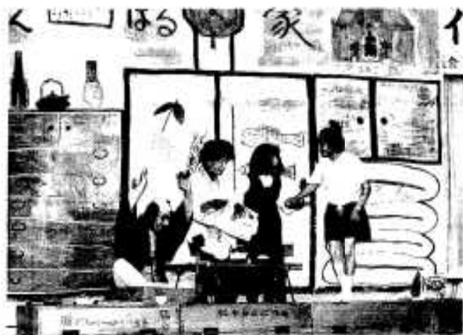
今年も熱演。三笠青商クラブ員による演劇