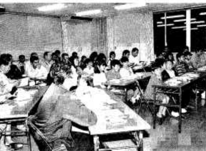
開始式には多くの人々が参加しました