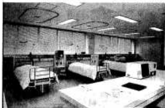
新設されたICU（集中強化治療室）

来年四月にはさらに泌尿器科と耳鼻咽喉科を開設、同時に付属看護学校（正看護課程、定員四十人）も開校する予定です。