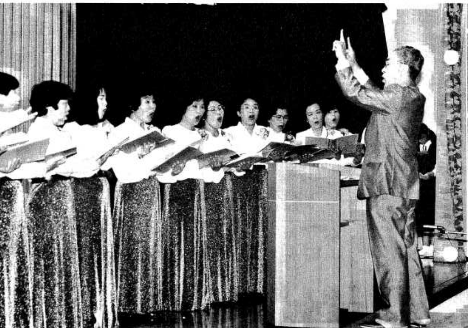
(脳本成人教室「コールみかさ」の皆さん：脳本地区文化祭にて)