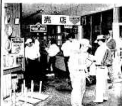
準備に追われる市職員ら

となりました。また老朽化した建物を一部改築するなど、改良を加えています。 今後(今後)も大島の開発あるいは保全については、充分検討していきますが、具体的には今度(今度)策定される総合開発計画やウォーターフロント開発計画をもとに、市域全体からみた大島の活用を図っていく考えです。