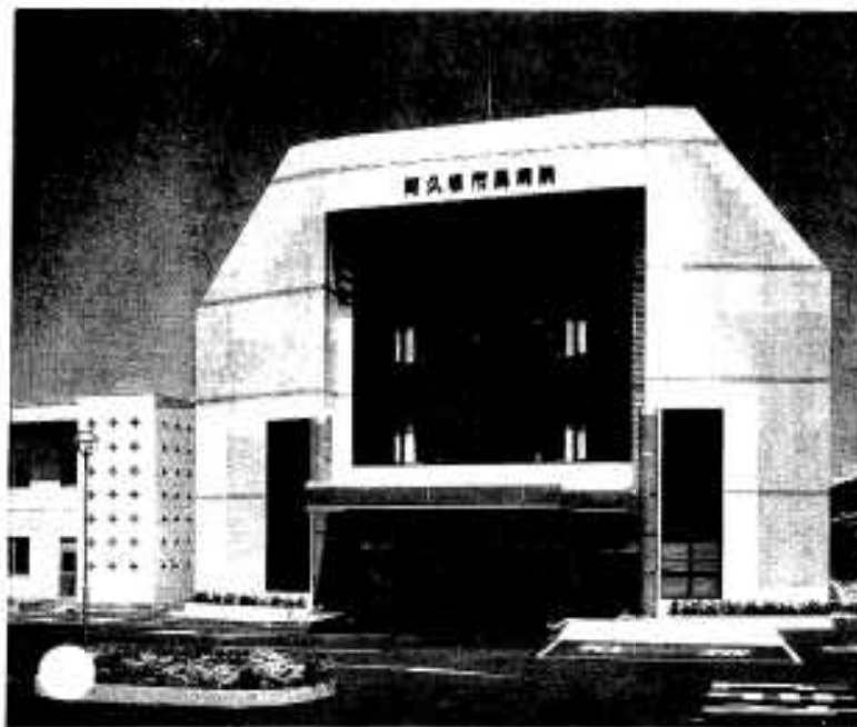
新しく完成した外来、管理棟

高齢化社会の到来や健康に対する意識の向上等により、住民の医療設備の充実に対する期待は大きく、その中で同病院の施設整備は、市民はもとより出水郡内の住民の期待と要望に答えるものと言えるでしょう。