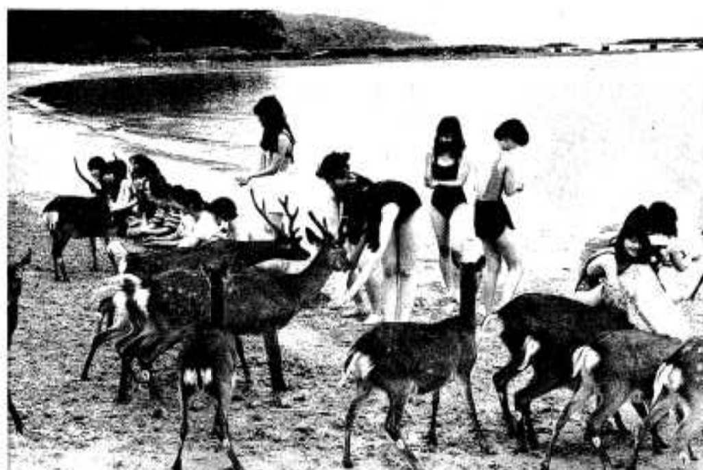
(写真は昨年(去年)の海開き)