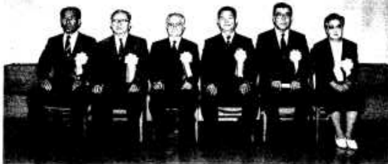
新柳勝記市長を囲んで市民特別表彰(上)と功労者表彰(下)の受賞者の方々