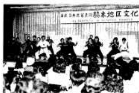
ゆっくりと、楽しく一。(太極拳)

演芸の部では、三笠中学校の吹奏楽部を皮切りに、演奏や合唱が次々と行われ、最後は三笠青年商工クラブ員による演劇