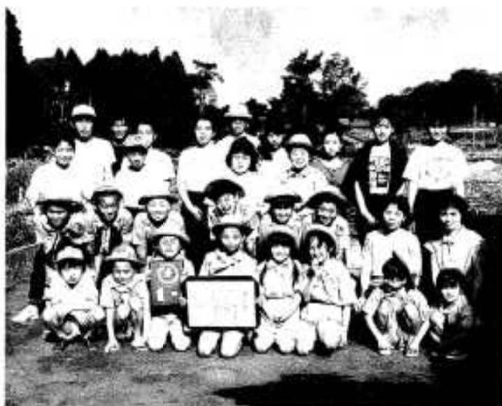
表彰を受けた「鶴川内緑の少年団」のメンバーたち

に、子どもたちをはじめ父母や関係者も大変喜んでいました。 緑の少年団は「子ども会を中心に組織された緑化ボランティア団体で、団員は小学一年生から中学二年生までの男子十九人、女子十五人の計三十四人。毎月定期的に公民館等集まり、中学生の指導のもと地区の清掃や花壇づくりを行っています。また、市民いこいの森の環境美化にも務め、緑化推進の各種運動に積極的に参加しています。