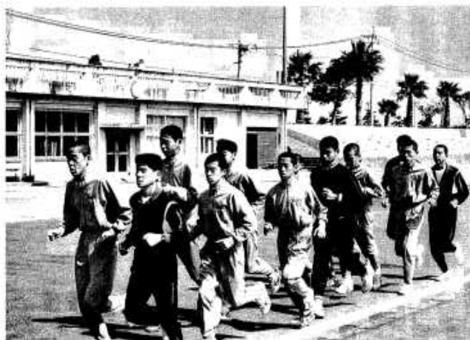
大会に向けて練習する阿久根農高陸上部員