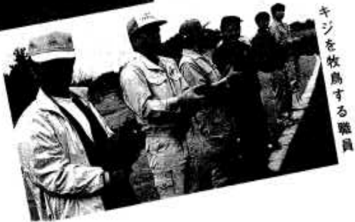
キジを放鳥する職員