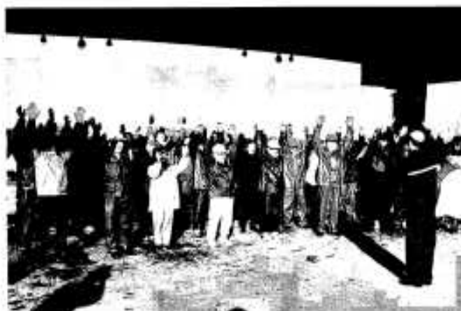
最後の発送を終え万歳する職員

今年で5回目を迎えた「イワシのふるさと便」も、皆さんのご協力のおかげで無事終了することができました。