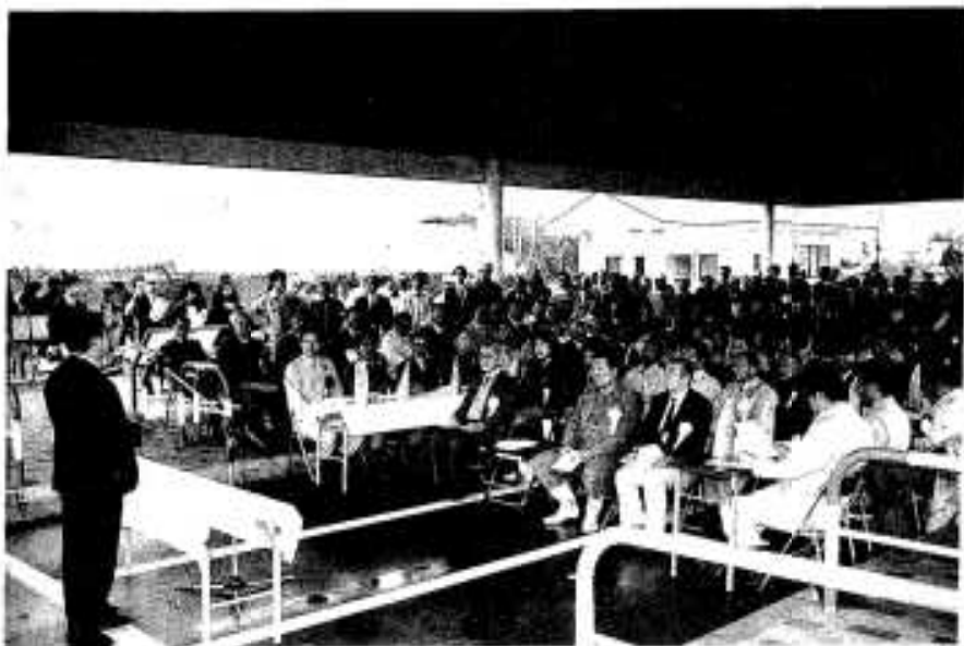
多くの関係者が出席した植樹祭

活力ある森林の整備をすすめる緑豊かな郷土を築こうなどをスローガンに、平成二年度の出水地区植樹祭が、二月二十八日、番所丘公園で開かれました。 植樹祭には、地区内の市町長をはじめ関係者など約三百人が出席。新栢勝記市長などのあいさつのもと緑化功労者や林業功労者を表彰。そのあと、緑化推進により素晴らしい生活環境の