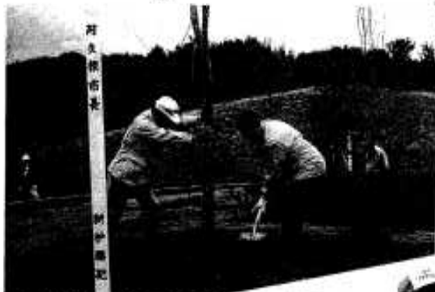
記念植樹する新栢市長