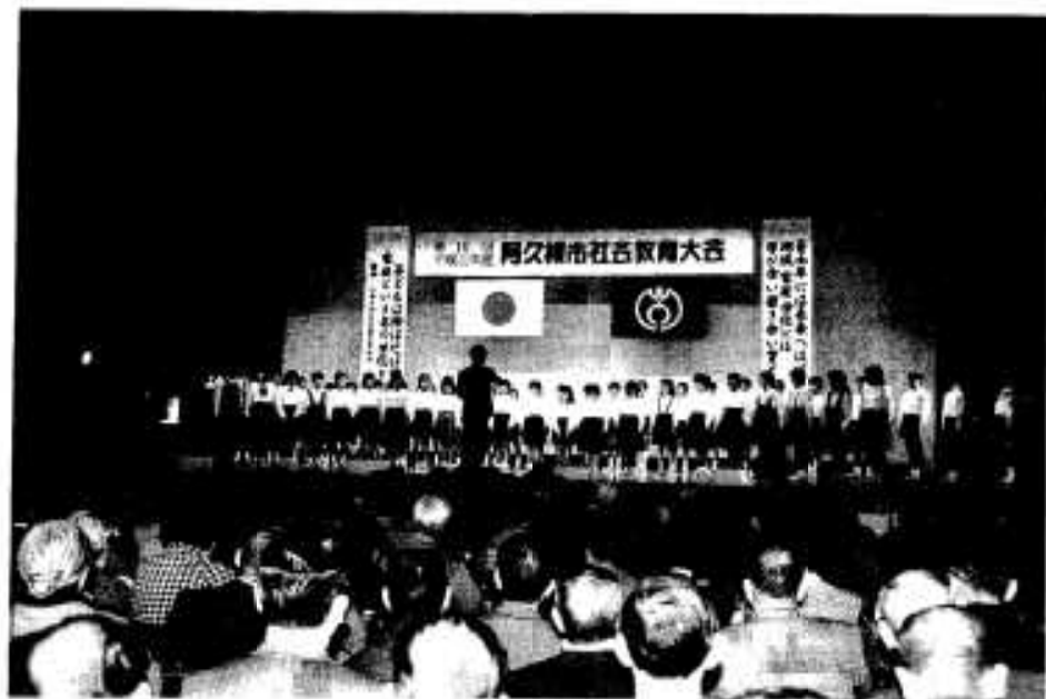
オープニングセレモニーで合唱する山下小の子どもたち

「青少年には未来へはばたく力を、地域・家庭・学校には学び合い、磨き合い、育て合う力を」をテーマに、第十六回市社会教育大会が、二月九日に市中央公民館で開かれました。