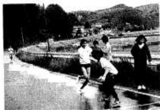
子どもからお母さん達へタスキ(鶴川内校区)