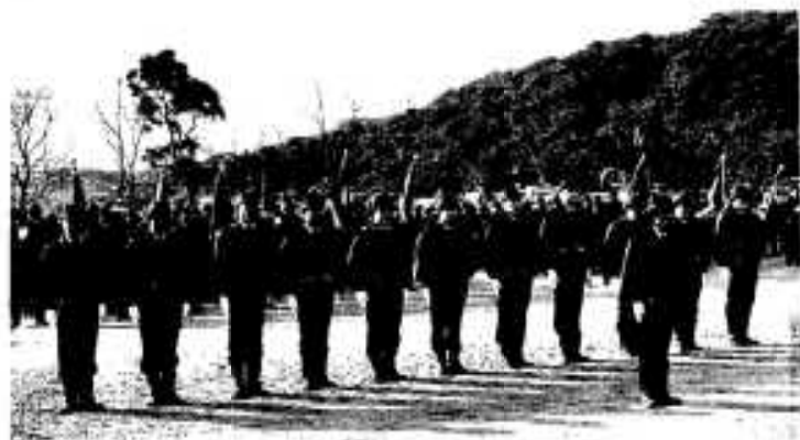
出初式で表彰される団員