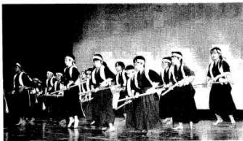
尾崎子ども会の三尺棒踊り