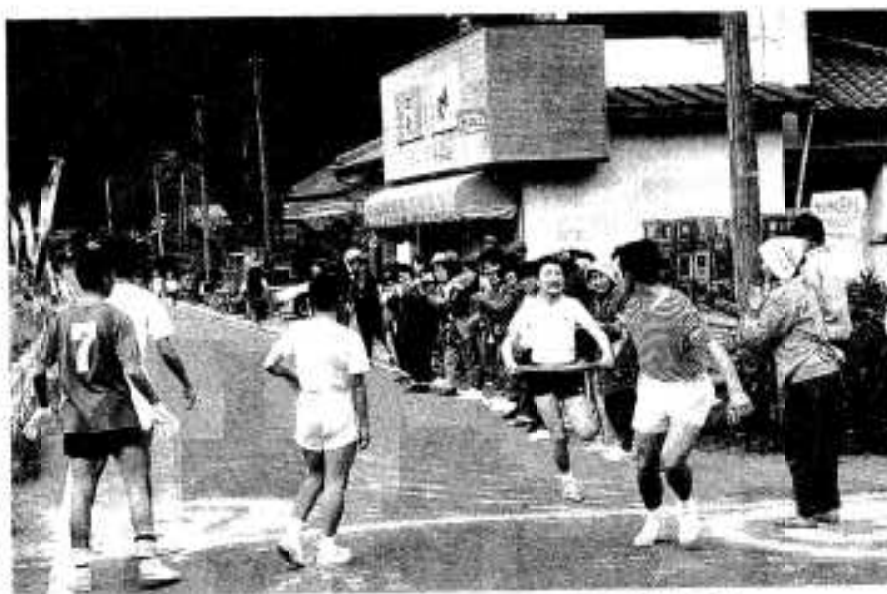
校区民の声援を受けて走る選手(田代校区)