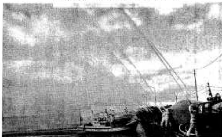
初めて新港で行われた放水演習

消防職員や消防団員の心意気 を誇示し、地域の人たちに防火 防災を呼びかけ、新年の無病息 災を祈る行事の消防出初式が一 月六日、市中央公民館広場で開 かれました。 幼年消防クラブの鼓笛隊演奏 や代表分団等のポンプ操法が行 われたあと優良分団や優良団員 などを表彰。このあと市中行進 を行い、今年は初めて新港で放 水演習。一斉に放水が始まると、 つめかけた多くの市民から歓声 があがっていました。