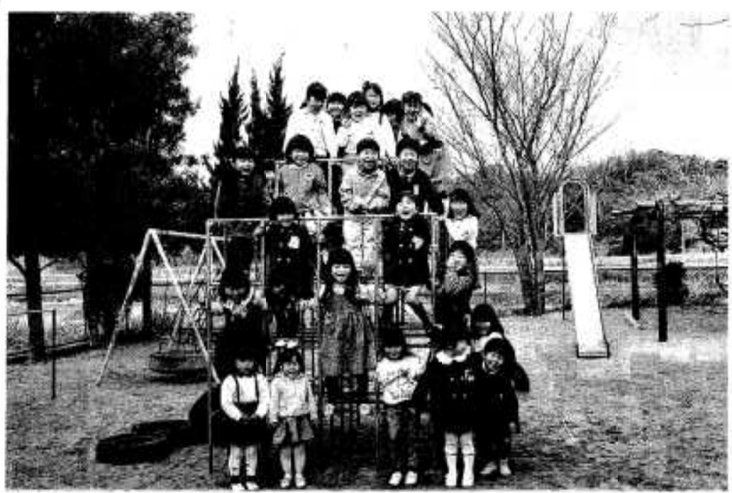
21世紀を担う子どもたちのためにも税金が使われています。

その主なものをあげてみますと、私たちの生活に大きな役割をもっている道路の整備、仕事がいやしく生産向上をあげるための港や農業の基盤整備、施設では二十一世紀を担う子どもたちが安心して気持ちよく勉強できるように学校施設の整備、このほか市営住宅、総合運動公園、保健センター、老人福祉センターなどの公共施設など、全てのものが市民の皆さんのために役立っているものであり、これらに税金が使用されているのです。