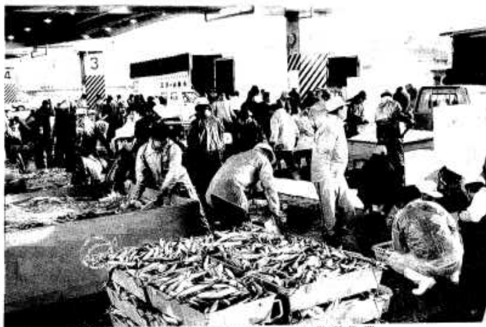
早朝6時からにぎやかに行われる発送作業