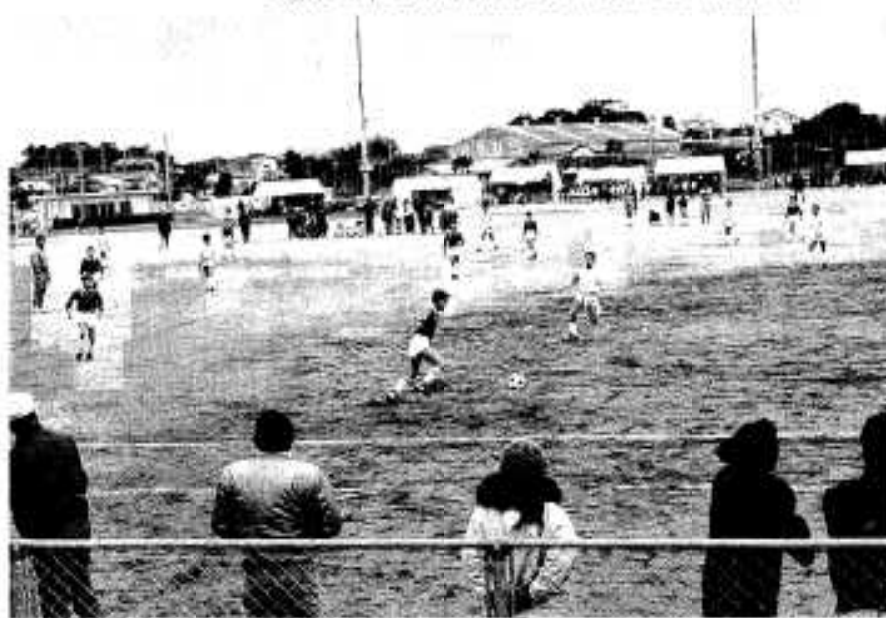
父母らの応援でハッスルプレーする子どもたち