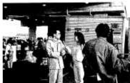
テレビ取材でインタビューに応じる職員