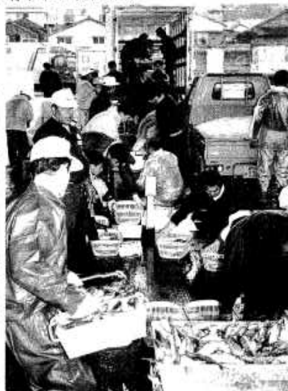
「1分でも早く家庭に」気が抜けません。