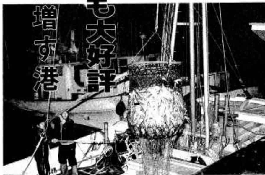
水揚げされたばかりの新鮮さが売り物