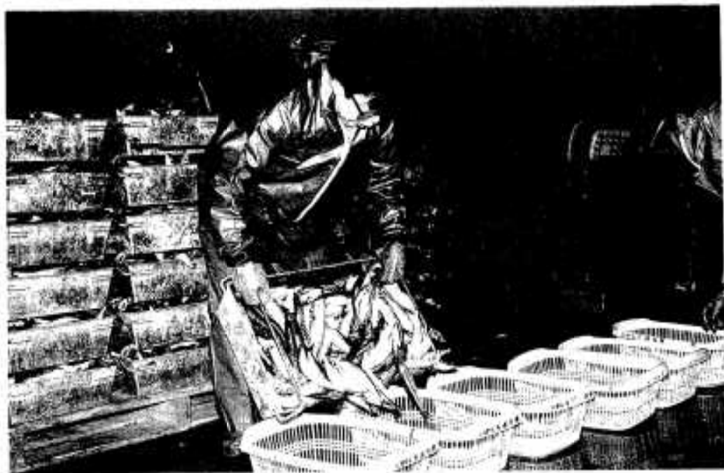
ト口箱からカゴに分配「腕力まかせて」

今年で五回目を迎えた「イワシのふるさと便」は、一月十日から申し込み受け付けが行われましたが、郵便局内に設けられた事務局には申し込みの電話がひっきりなしにかかり、大変なごわいを見せています。 発送作業は一月二十三日から開始。早朝の六時から始められる新港には活気があふれ、作業に従事する関係職員らの汗が寒風を吹きとばしています。 全国に届け「旬の味イワシ」今やポインタンと並ぶ阿久根市のPRの代表となっております。