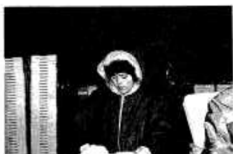
「完全防寒。寒さなんて！」

今年で五回目を迎えた「イワシのふるさと便」は、一月十日から申し込み受け付けが行われましたが、郵便局内に設けられた事務局には申し込みの電話がひっきりなしにかかり、大変なごわいを見せています。 発送作業は一月二十三日から開始。早朝の六時から始められる新港には活気があふれ、作業に従事する関係職員らの汗が寒風を吹きとばしています。 全国に届け「旬の味イワシ」今やポインタンと並ぶ阿久根市のPRの代表となっております。