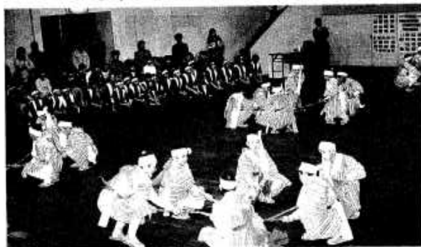
本城文化財少年団の荒田棒踊り