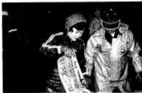
最初の発送を無事終えて「バンザ〜イ」「ヒノキ」を入れるのも大事な仕事「このくらい」男性なんかには負けないわよ