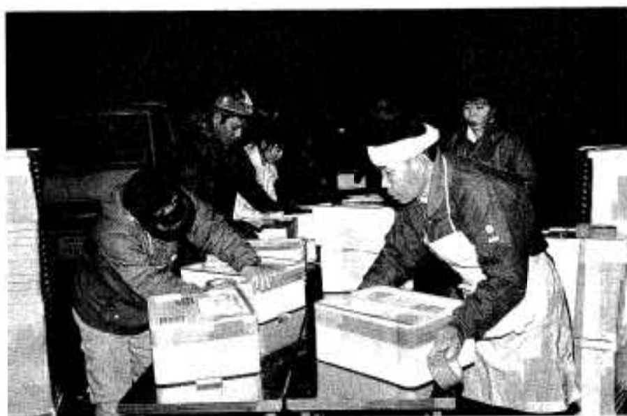
ハチマキをしめて頑張る姿も