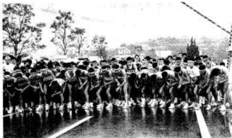
スタート10秒前：緊張の瞬間