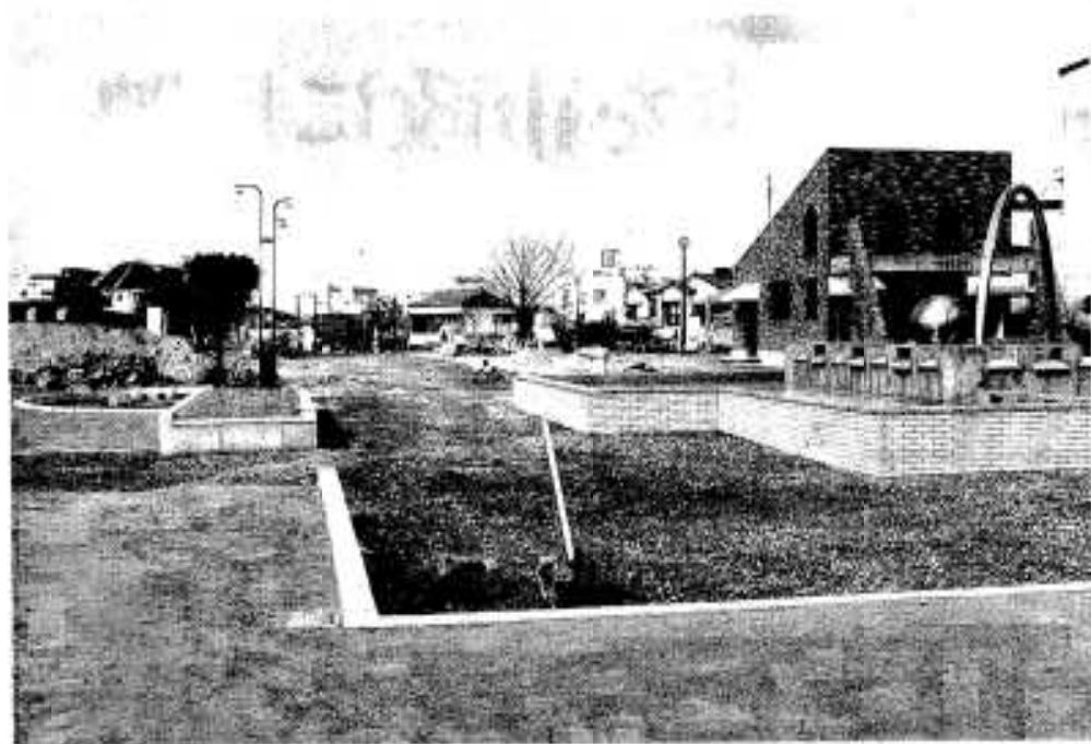
整備中の中央公園（右端が噴水）