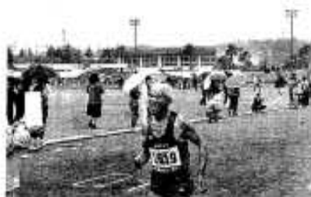
若い者には、まだ負けんぞー