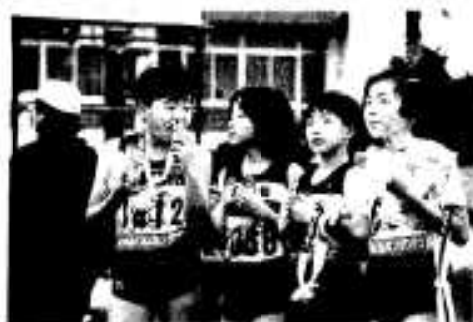
走ったあとのカライモは最高