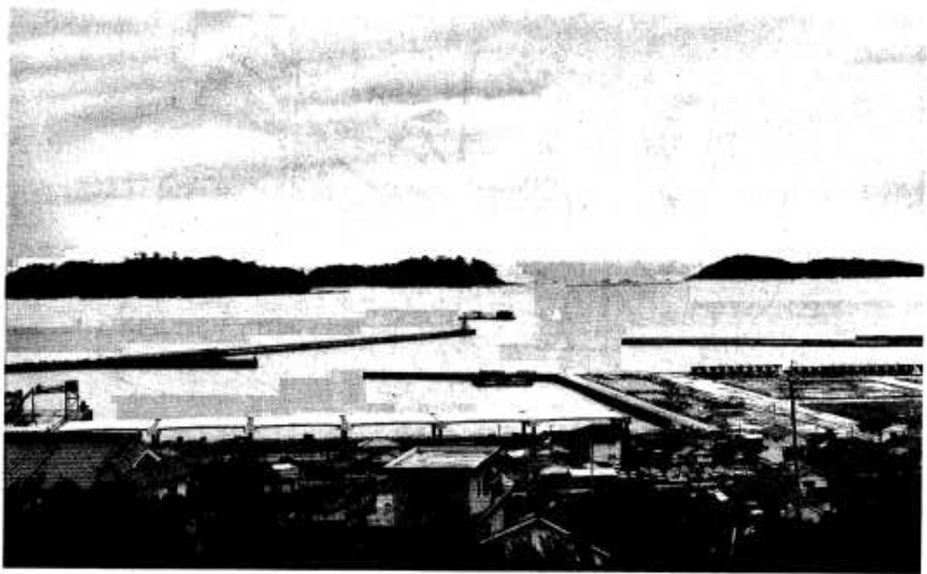
ウォーターフロント計画で魅力ある観光開発が期待される阿久根大島等