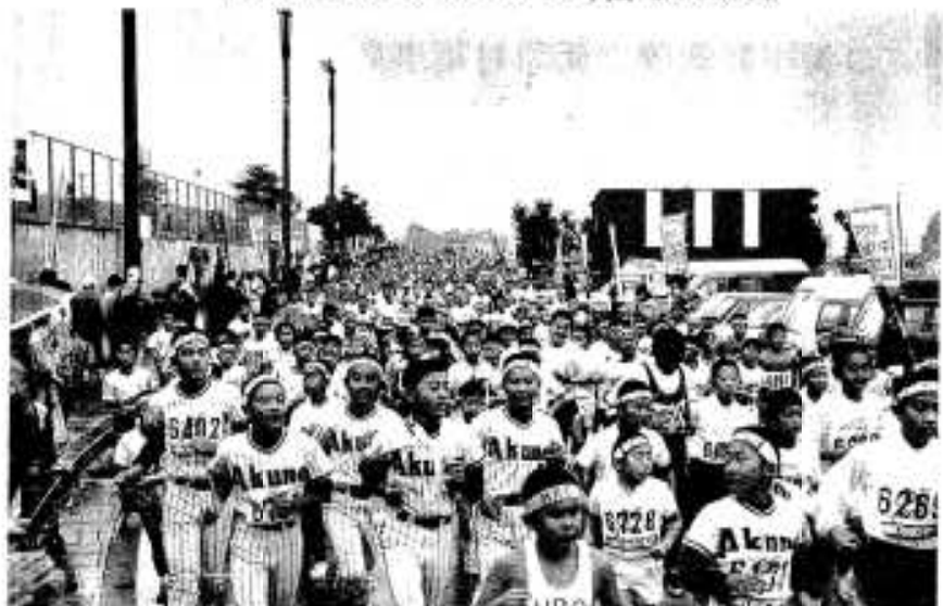
抜きたくてもこれでは…マイペース・マイペース