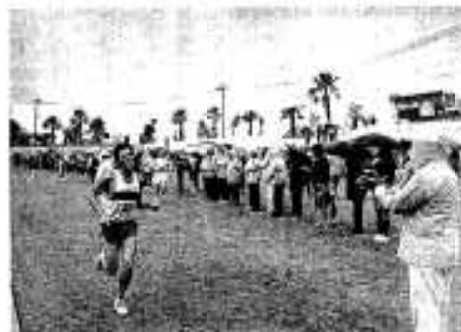
多くの人の拍手に迎えられて