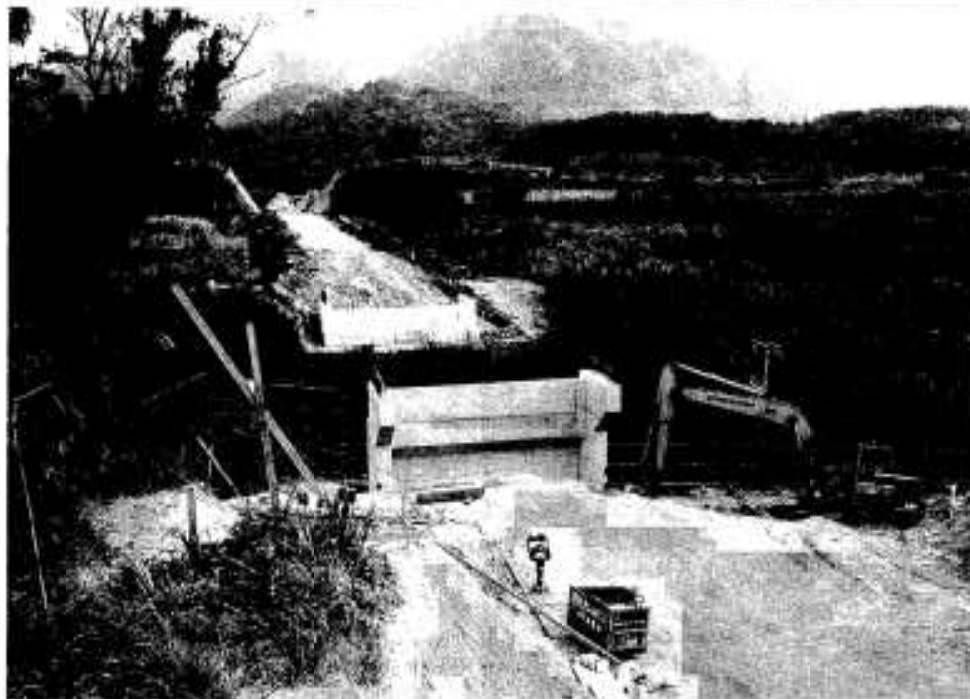
開通が待ち望まれる広域農道（写真は西目飛松区の跨線橋工事）