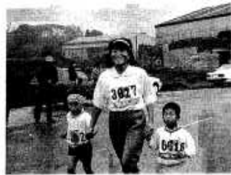
1人で走れるつて言うんだけど