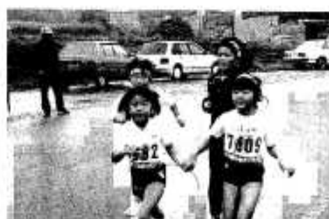
先に行ったらダメ、ゴールまで一緒よ