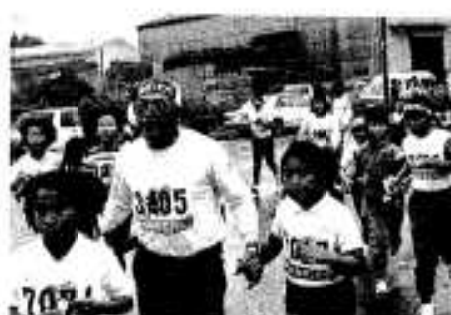
うちのおじいちゃん元気なだから