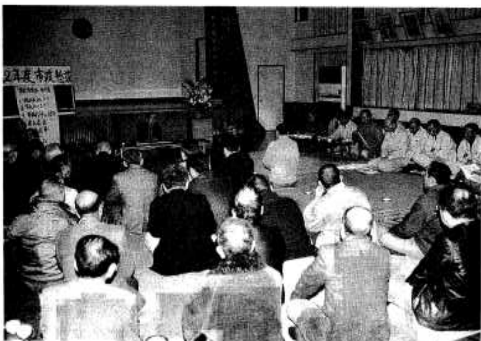
多くの意見・要望が出された懇談会（写真は市街地区）