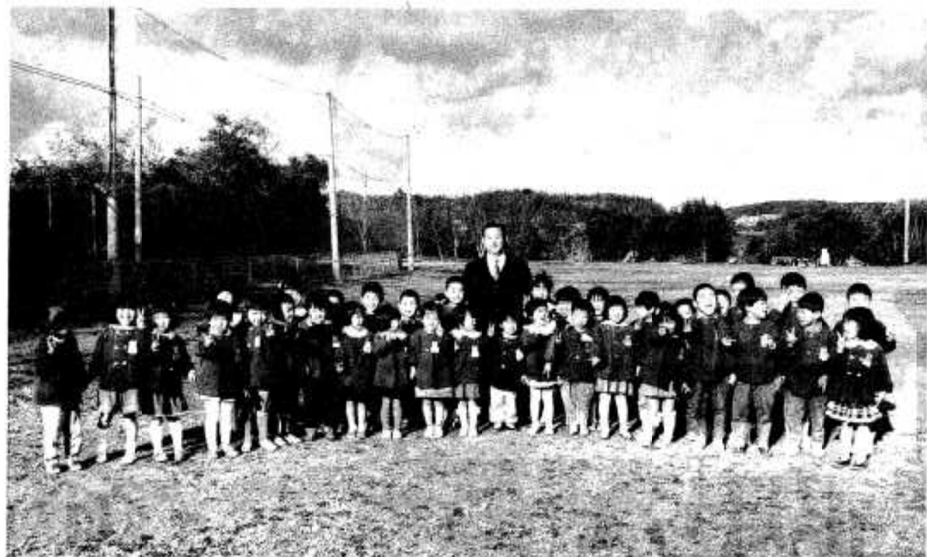
21世紀を担う子どもたちと一緒に新柘市長

私もこの重大な時の市政担当者として全てを傾注し、県当局に対しても国に対しても本市の振興のためになる事柄について注文もし、要求もいたして参ります。