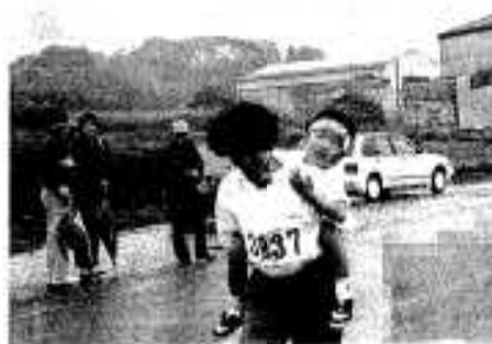
お母さん、もつと早く～