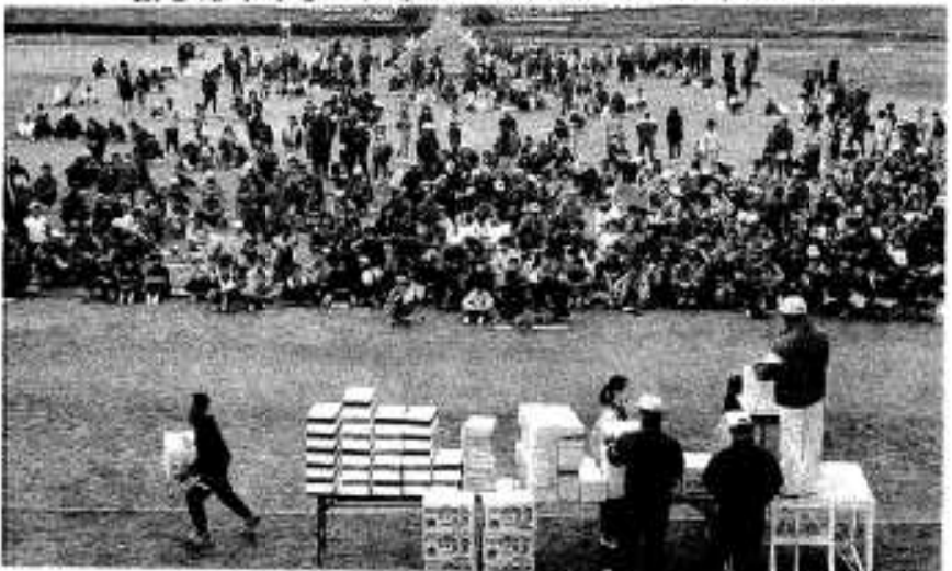
豪華商品が当たる抽選会は今回も大人気