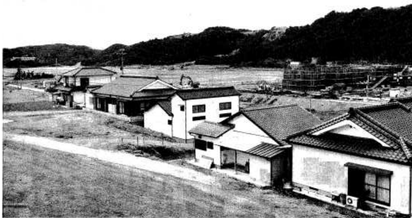
整備が進む潟土地区画整理