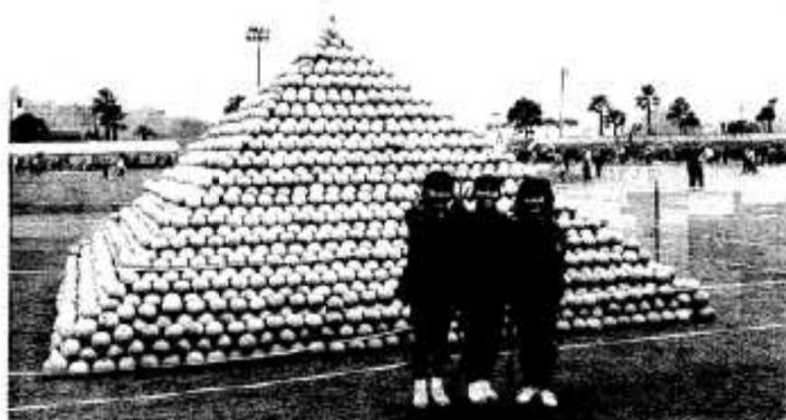
ぼんたんピラミッド。今回も大人気