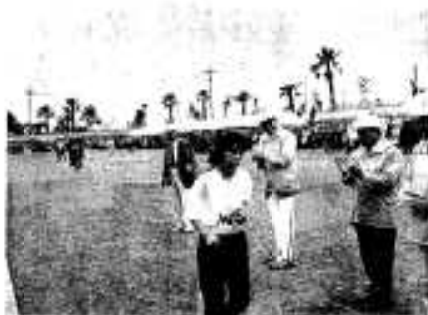
市長さん、私、疲れちゃったの