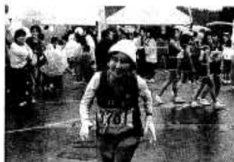
八代市から参加のおばあちゃん