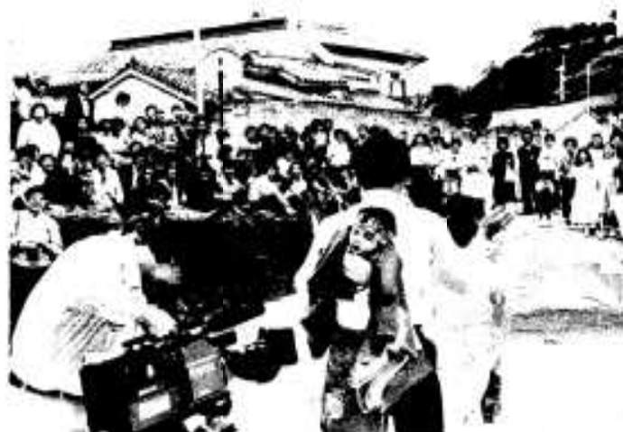
「テレビカメラさん上手にとってね」