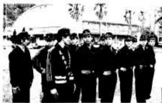
真剣な表情で訓練に挑む新入団員

本年度の新入団員は四十二人。「進め」の声に、キビキビとした動作で対応しながらも、緊張のせいか思うように体が動かず汗ビッシュヨリ。しかし、市民の安全と財産を守らなければならぬ使命感に燃えているのか、真剣な表情で長時間にわたる訓練に耐えていました。