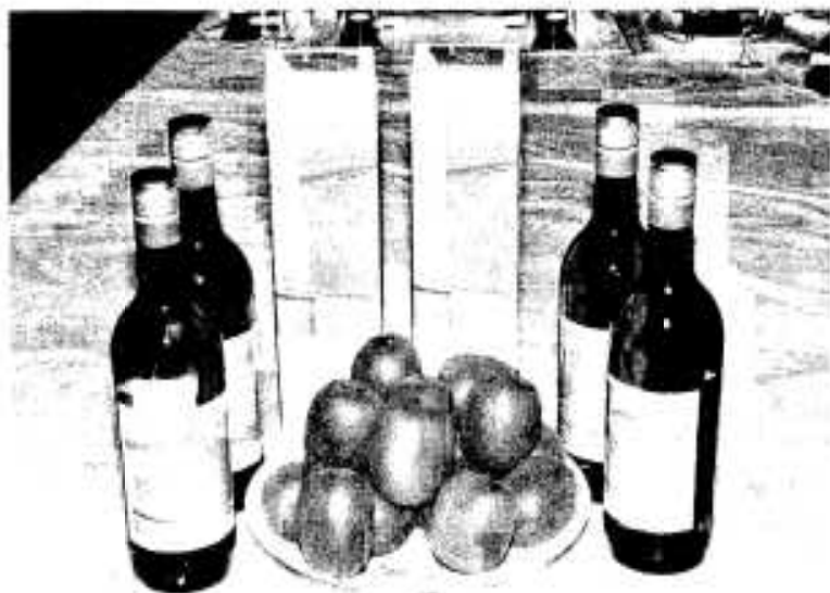
好評発売中のキウイフルーツワイン

阿久根市の特産品の一つであるキウイフルーツを使っているワインが誕生し四月十日、国民宿舎あくねで発表会がにぎやかに開かれました。