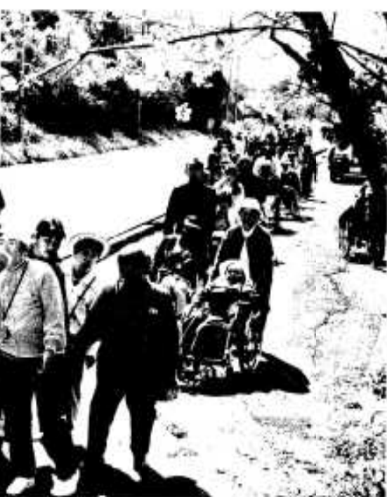
久しぶりに屋外に出て、きれいな桜も歓迎

元世界チャンピオンだった白井義男、ファイティング原田、具志堅用高氏らも宮前選手の将来性を高く評価しており、阿久根市初の日本チャンピオン誕生も間近かと思われます。