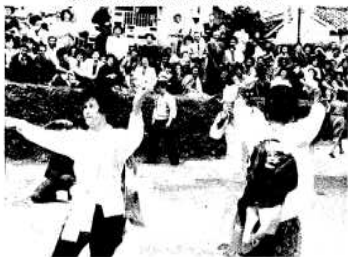
「踊りよりも、私の顔を見てよね」