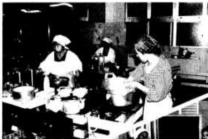
↑実エンドウの収穫最盛期時に最速「共同炊事」調理場として活躍

などを作ったり、そのままや実エンドウなどを使っての料理研究、あるいは生活改善のための料理教室などが行われますが、農家にとっては厳しい農業時代を迎えているだけに同施設の活用が注目されています。