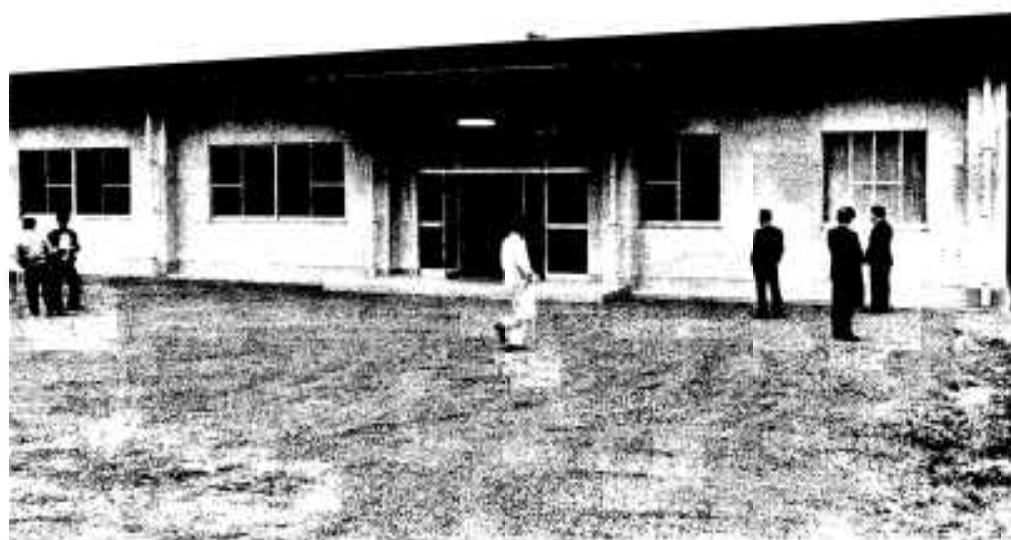
完成した農畜産物処理加工施設