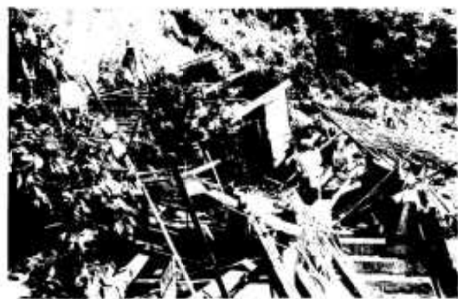
ガケ崩れは財産や命まで奪ってしまう(昭和46・47災害)

とのできない災害に昭和四十六年、四十七年に起きた大雨災害があり、多くの死傷者を出してしまいました。