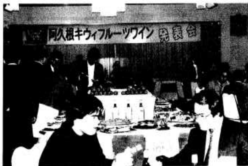
発表会では招待客も「うまい」と大好評

キウイフルーツワインはアルコール分が十％、七百ml入りで一本千円。現在、市内の酒類小売店や鹿兒島山形屋でも販売されています。値段も手ごろで女性の方々が飲みやすいワインだけに人気が出てくることはまちがいないと関係者からは大きな期待が寄せられています。