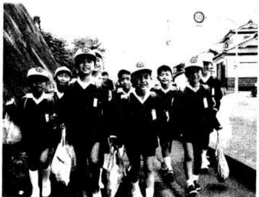
元気に通学する西目小の子どもたち

市議会議員のあと昭和三十六年から四期、県議会議員として地域振興発展のために尽力された功績が認められての受章です。