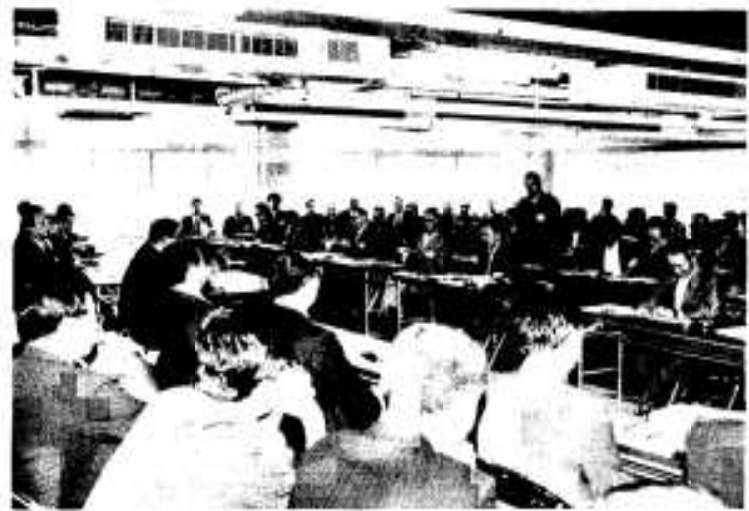
活発な意見が出された市勢行部との意見交換会

集落のとりまとめを行き市内七十九区の区長が出席して平成二年度の市区長会、市防犯組合、市衛生自治会の総会が四月十七日、市中央公民館で開かれました。