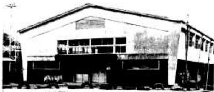
改築される大川中学校体育館