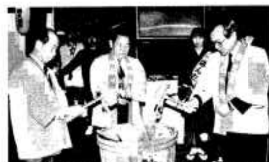
大盛況を祈願して鏡割りをする新市市長ら

山形屋創立二四〇周年食品リフレッシュオープン記念として三月二十日から一週間、鹿児島山形屋一号館で「阿久根の観光と物産展」が開かれました。同展は、県内随一の百貨店である鹿児島山形屋を活用し、観光客の誘致及び市特産品の販売・PRに努め、ますますの消費拡大と定着化を図るために開かれたもので今回で九回目。二十日のオープニングセレモニーでは浜婦人会の踊りや市職員による光徳太鼓の披露、小イワシバ