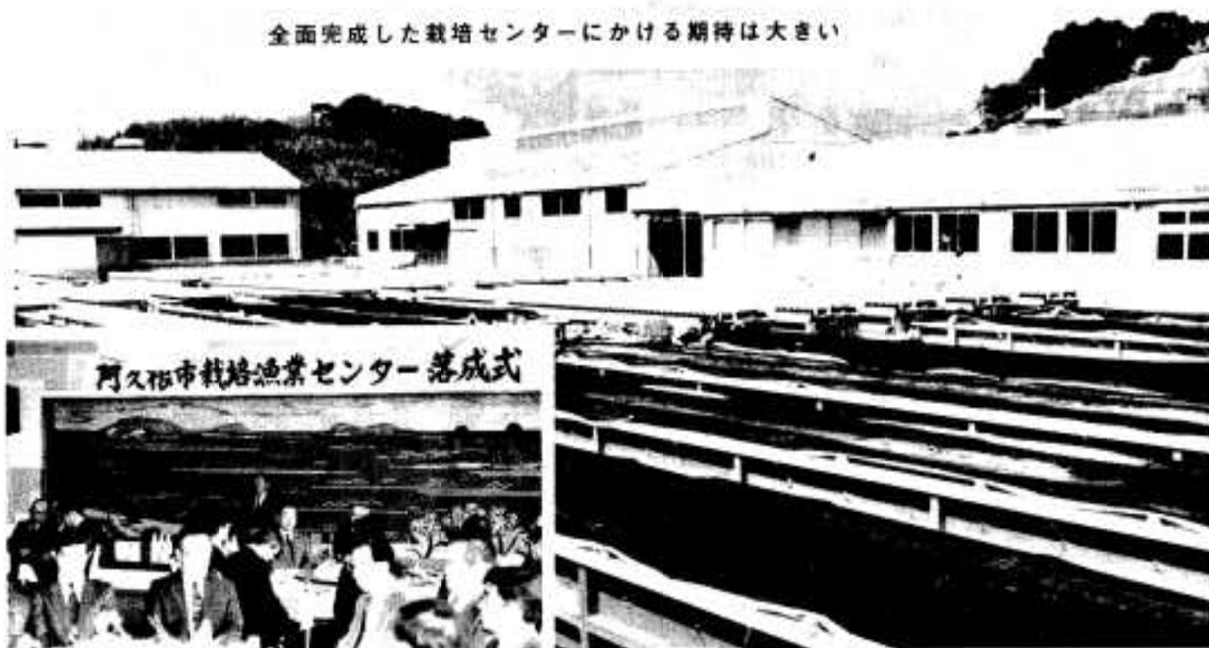
阿久根市栽培漁業センター落成式