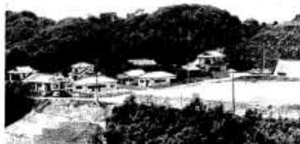
本之牟礼校区の方々が移転された倉津団地

過去には、小学校などもあり子どもも多く、住みやすい一つの集落でありましたが、時代の移り変わりは激しく移転を決定。倉津団地に移転したのは十戸のうち七戸で、三戸は市外にいる子どもなどの所