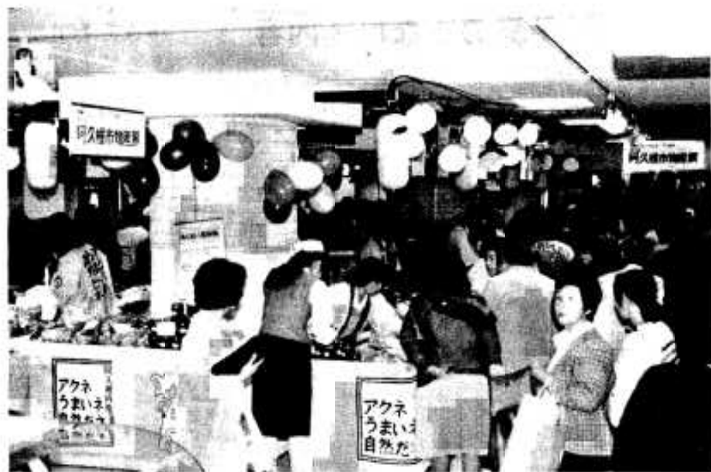
多くの人でにぎわった観光と物産展