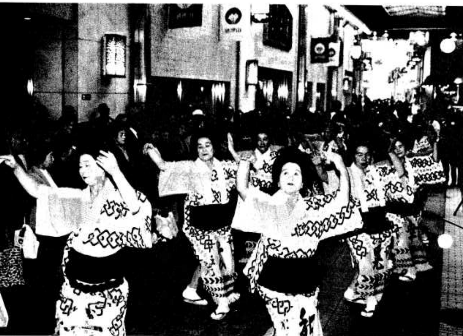
(多くの見物人が訪れた浜婦人会の踊り)