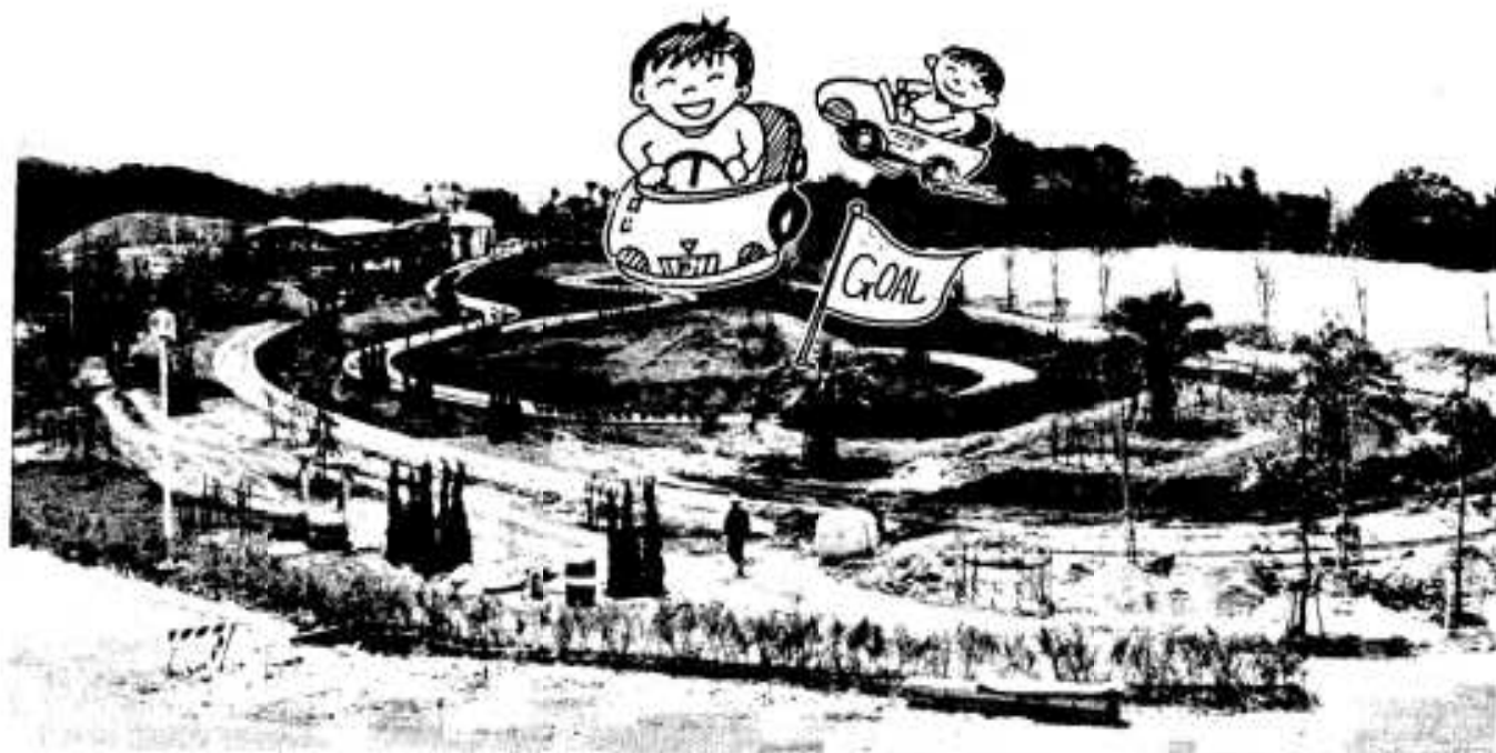
子どもたちが待ち望む番所丘公園のゴーカート場は本年度供用開始予定

そのためには、単に経済的な豊かさだけでなく、生活の充実感、文化的な豊かさを実感できる社会を目標に、わがまちを著