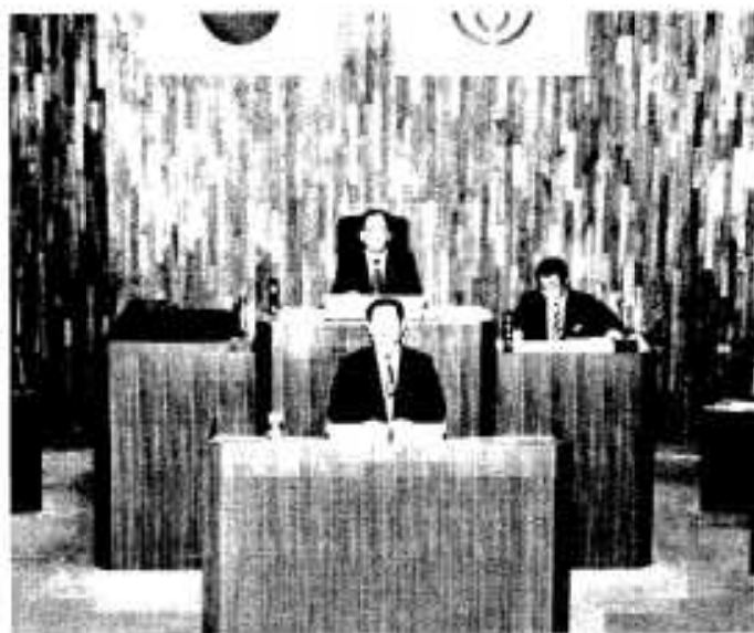
施政方針を発表する新杵市長