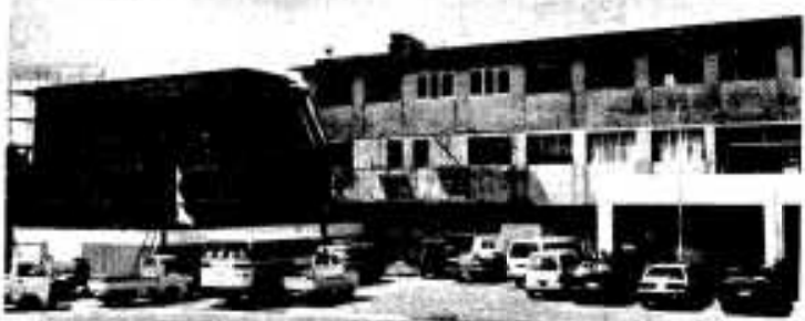
三百人収容の大宴会場の完成も間近か国民宿舎

きながら保健センターを中心にするため、生活環境面では家庭から排出される生ゴミ対策として処理器設置に伴う補助制度を設けゴミの減量対策に取り組んで参ります。