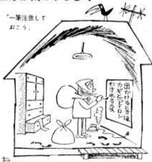
一筆注意して おこう。