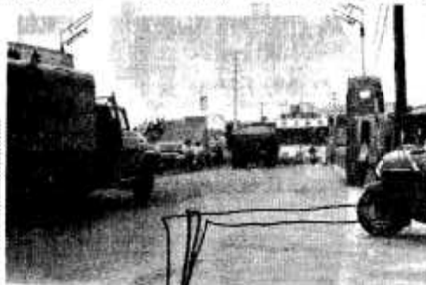
(車が多くなり交通上危険になつた高松橋)

つづられた国道横断歩橋もこの三カ年計画の中にはありません。現在市街地の歩道は、整備を進めてゆきたいと思っています。