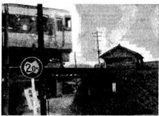
(バスも大型トラックも通れない波留ガード)