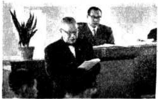
(施政方針を説明中の市長)

近年、わが国の経済はほげしく変動し、現在ではきわめて苦しい事態に直面していると思われまふ。この苦しい経済を立てなおすために、国は公債を発行して景気の回復をはかり、国民の生活安定を実現するというところであります。