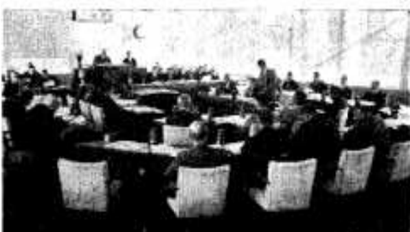
(41年度予算を審議する議会)

それだけに、消防の近代化が要請されるゆえんであると思ひ、できるだけこれに對処できる消防施設の充実に努力したいと思ひます 水道事業におきましては本市の水道事業もすでに十余年を経過し、器具等も老朽化しておりますので、これらの補修は、緊急の必要に迫られております。 さらに、需用家も年々増加し、新設とあわせて、企業的にも苦しい状態でございます。 しかし、さる九月議会におきまして、五カ年計画による水道事業の充実をお認めいただきましたので、この主旨にそつて、事業実施をすすめてゆくことにしております。 つきに、社会生活上の急務とし肝要な交通安全対策の問題です。 この対策としては、交通安全市民会議を結成し、市関係ぐるみで交通事故をなくするよう努力したいと思ひます。