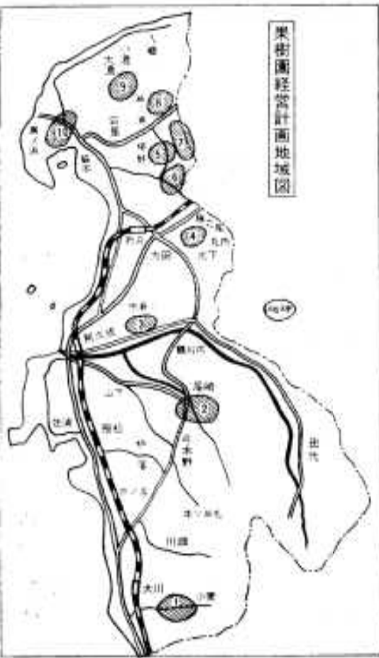
果樹園経営計画地域図

かん一ヘクタール。⑦は桐野上地区で、温州みかんが計画され。⑧は瀬之浦上・大瀬川地区、⑨は松力根・木場仁田地区、⑩は橋之浦・深田地区で、それぞれ温州みかんとして計画されています。 補助などありますが、何よりも大切なことは、みなさんの「やる気」が根本となることです。