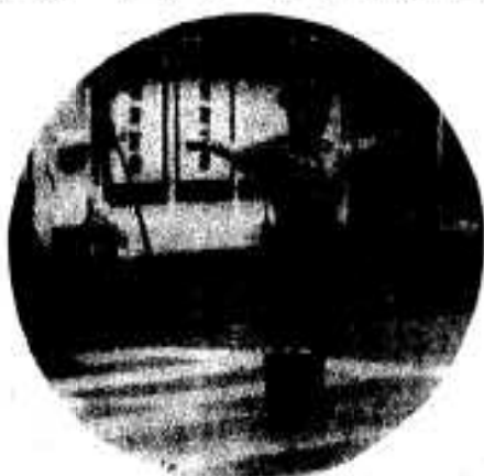
(阿久根小学校下での交通整理)

阿久根警察署管内の交通事故は、今年になって、ものすごく増加しています。六月十五日現在で、すでに昨年一年間と同じ三十六件の交通事故が発生し、このため、死んだ人が六人、怪我した人が二十九人もでています。