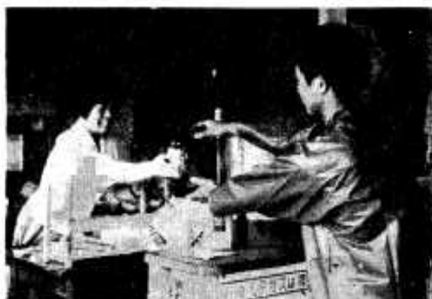
(岡久根市農協での「販売」)

農薬の効果は、ひじょうに大きく、ここ数年來、相續く船の農作も、天候の好条件に加えて、殺虫剤の適切な使用が、有力な原因の一つと認められていまして。 しかし、一方農薬は有害虫に對し、少量であっても大きな効果を与えるものであると同時に、なかには使用する人たちや家畜