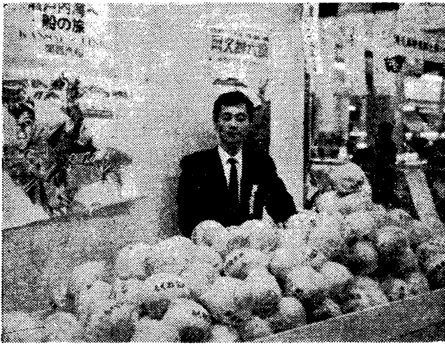
(大丸デパートのぼんたん売場)

「太陽と緑りの鹿兒島」を看板に、鹿兒島・林田両バスガイドの宣伝・民芸団の踊りは、会場の空気を盛り上げていました。しかしおにも、鹿兒島・指宿・霧島・桜島だけの紹介で、わたくしどもの阿久根はとり残されな感じでした。阿久根の観光については、南国交通と相談して、独自のPRが必要だろうと思います。