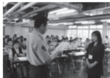
阿久根警察署から「振り込め詐欺抑止訪問アドバイザー」に委嘱された市在宅福祉アドバイザー

これは多発する振り込め詐欺を未然に防ごうと委嘱されたもので、日ごろの声かけが振り込め詐欺撲滅につながればと期待されています。