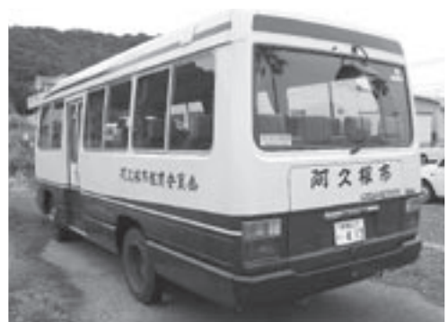
マイクロバス後方から