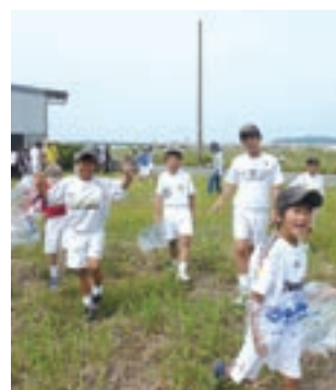
新港周辺の清掃を行う参加者

少年団が一堂に集まりボランティア清掃を実施 5月29日、新港晴海埋立地周辺で、市内のスポーツ少年団の団員および指導者と保護者ら約40人がボランティア清掃を行い、空き缶やペットボトルなどを拾い集めました。