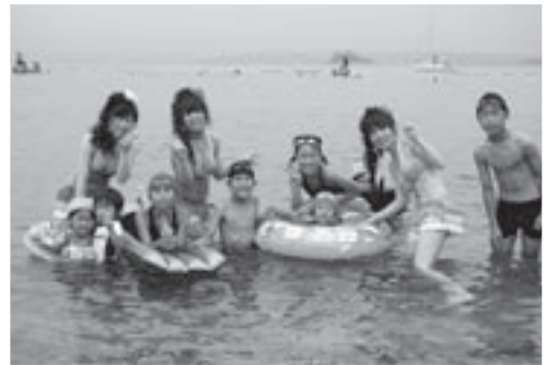
阿久根大島海水浴場海開き（7月3日）