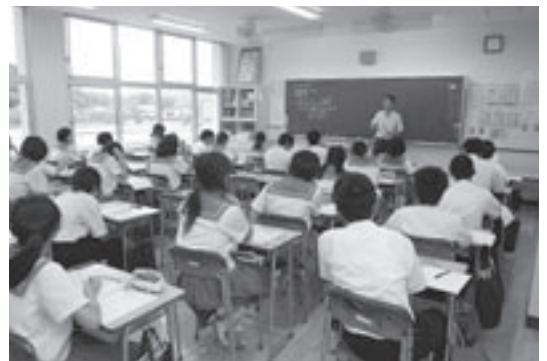
改修後の教室で勉学に励む生徒（阿久根中学校）

耐震化・大規模改修工事が完了した阿久根小学校舎（校舎と校舎を結ぶ渡り廊下も新たに設置されました）