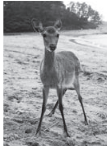
事故防止のためシカには触れないで下さい