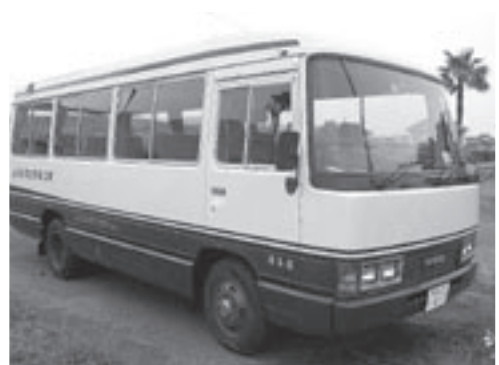
マイクロバス前方から