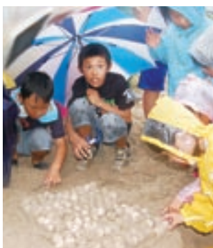
海ガメの卵をさわる子どもたち

6月12日、脇本海岸で、ウミガメの産卵が確認されました。産卵場所は、満潮時に浸水するおそれがあるため、卵は地区の大勢の子どもたちが見守る中、安全な場所に移されました。