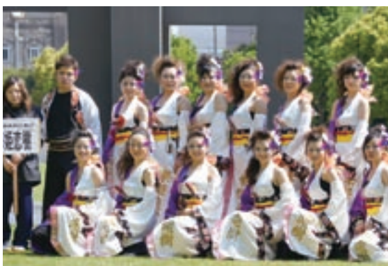
初参加でファイナルまで進出した華姫恋樹の皆さん