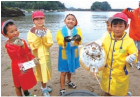
エイやタイなどとれた魚を手にとり喜ぶ児童