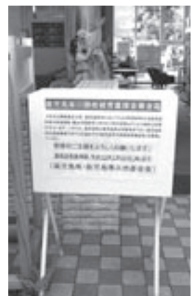
市役所1階に設置してある募金箱