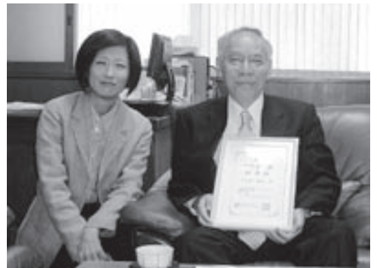
東京経済大学の久木田学長(右)