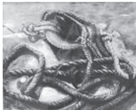
昨年のおくね洋画大賞作品「結うI」