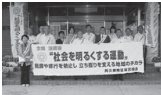
市役所玄関前で「社会を明るくする運動」の出発式を行う保護司会阿久根支部の皆さん（7月5日）