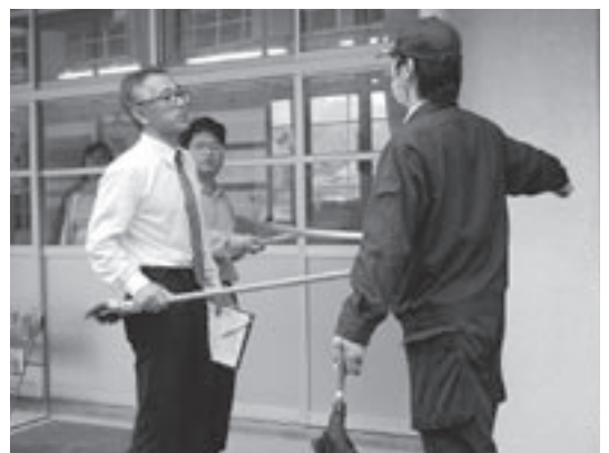
市教育委員会では、阿久根警察署の協力を得て、市内各小中学校の先生を対象に不審者対応訓練を脇本小学校で行いました。

不審者を見かけたり、不審者の情報を得たりした場合は、すぐに警察（110番）に通報してください。