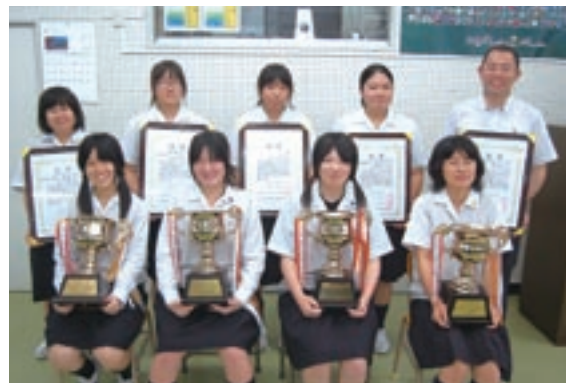
鶴翔高校放送部の皆さん