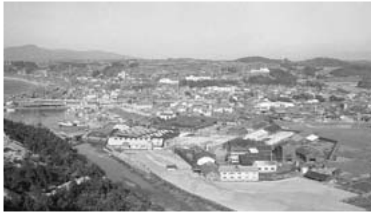
遠見ヶ丘から市街地を望む（昭和39年頃）