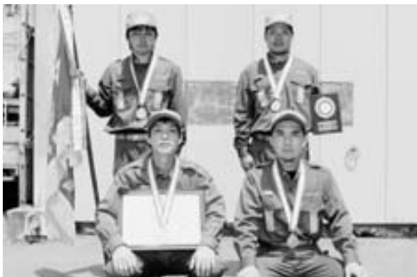
三笠分団黒之浜班 ■小型ポンプの部優勝