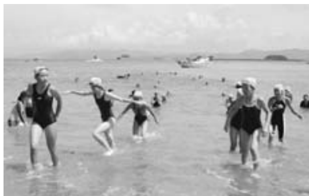
海に親しみ心身を鍛えた参加者

阿久根大島からの遠泳に参加する予定だった小学3年生から6年生までの28名は、約2キロを1時間ほどで完泳。途中、子どもたちは波をかぶったり潮に流されたりしましたが、これまで一生懸命に練習してきた成果を存分に発揮し「それぞれ」と声を掛け合ったり、隊列を組みながら、最後まで見事な泳ぎを見せてくれました。