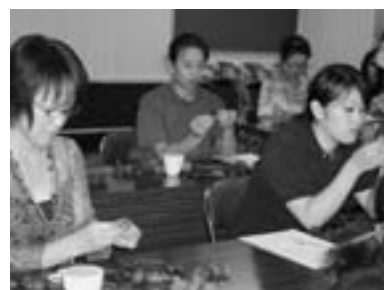
(プリザーブドフラワー) (写真は19年度講座風景)