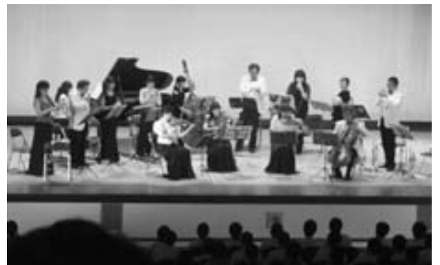
多彩な音楽で中学生を魅了した鹿児島交響楽団

演奏会では、クラシック音楽のほか、生徒らが知っている「君をのせて」「パイレーツ オブ カリビアン」などの曲演奏や楽器の紹介のほか、生徒が参加しての合唱、トライアングルなどでの演奏参加もあり、生徒らは音楽の素晴らしさを改めて学ぶ貴重な時間を過ごしました。