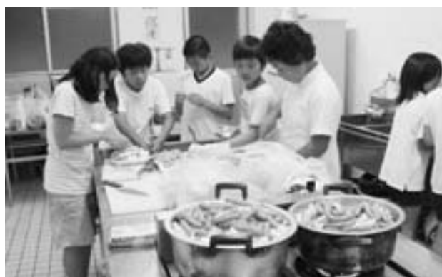
協力し合い自分たちで夕食の準備を行う参加者