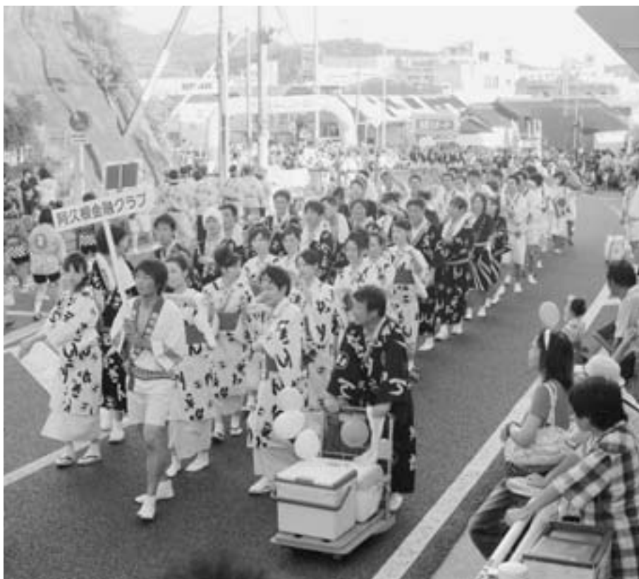
ハンヤのリズムに合わせて軽快に踊る参加者（7月26日 ハンヤ踊りパレード）