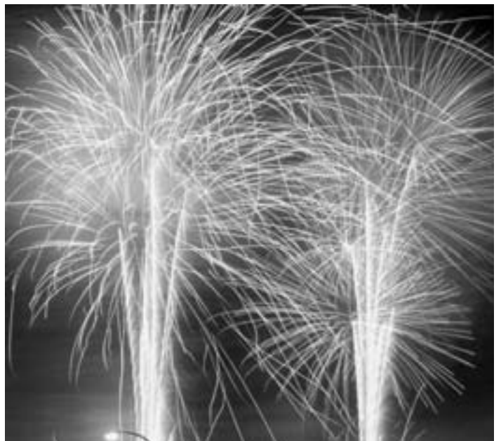
祭りのラストを飾った7千発の打ち上げ花火

「おどっどコンテスト」には、県外から秀岳館高校雅太鼓部(八代市)と牛深高校郷土芸能部(天草市)の参加もありました。左の写真は、牛深ハイヤのリズムに合わせて踊りを披露する牛深高校郷土芸能部の皆さん