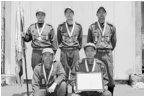
大川分団 ■ポンプ車の部優勝