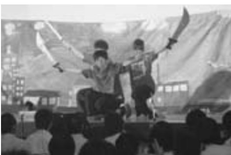
工夫をこらした劇などが披露されたステージイベント(飛翔祭)