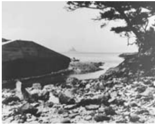
S36年頃の倉津港(上下とも)