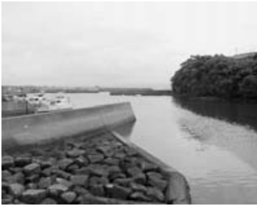
整備された現在の倉津港

倉津港は、昔から天然の良港として栄え、唐船やポルトガル船などが中世以降、盛んに寄港していました。江戸時代に鎖国令をしかれた後も海上交通の要所として栄えました。