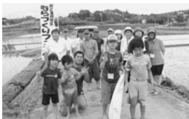
泥にまみれながらも楽しく田植え体験を行った参加者ら

6月29日、梶之浦西区むらづくり委員会が主催し「自然満喫！田植えと潮干狩り体験ツアー」が開催されました。ツアーには鹿児島市などからも参加があり、脇本海岸での潮干狩り体験のほか、田植え体験なども行われました。田植え体験では、参加者は地元の農家の方と一緒に裸足で田んぼに入り、6アールの田植えを行いました。最初は、馴れない土の感触にとまどいながらも、一本いっぼん丁寧に苗を植え、この時期ならではの自然を存分に満喫していました。