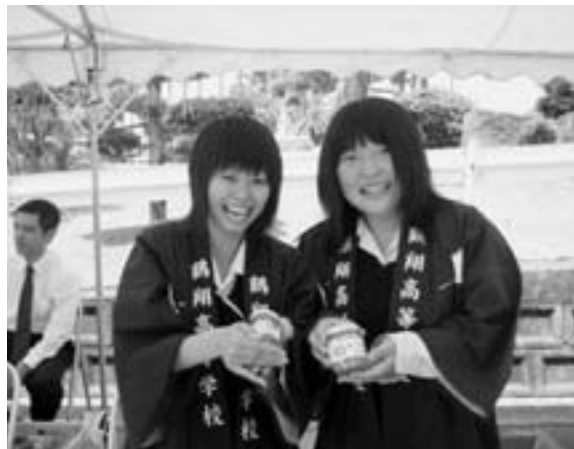
当日は3年A組シリーズの販売もあります