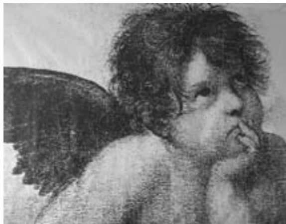
生徒が協力して創作した作品が多数展示されます

今年の飛翔祭では、文化委員長として責任は重いですが、実行委員を1つにまとめ、鶴翔高校生らしさを思い切り表現できる飛翔祭にしていきたいです。市民の皆様にも飛翔祭をご覧いただきたいと思えます。生徒一同、皆様のご来場を心からお待ちしています。