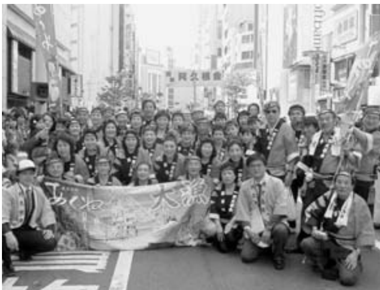
「渋谷鹿児島おはら祭り」に参加した関東阿久根会の皆さん (5月18日)