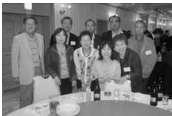
東海地区阿久根会総会 (4月27日 名古屋市)