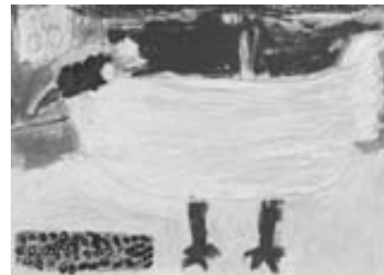
第9回AKUNE洋画大賞受賞作品 (ジュニアの部)