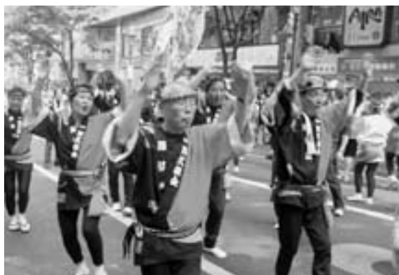
色鮮やかなハッピーに身をつつみハンヤ節を踊る 関東阿久根会の皆さん (5月18日 渋谷鹿児島おはら祭り)

楽しい話題などをお知らせください。 秘書広報係 ☎73-1211 (内線1214)