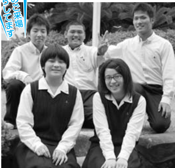
生徒会役員の皆さん