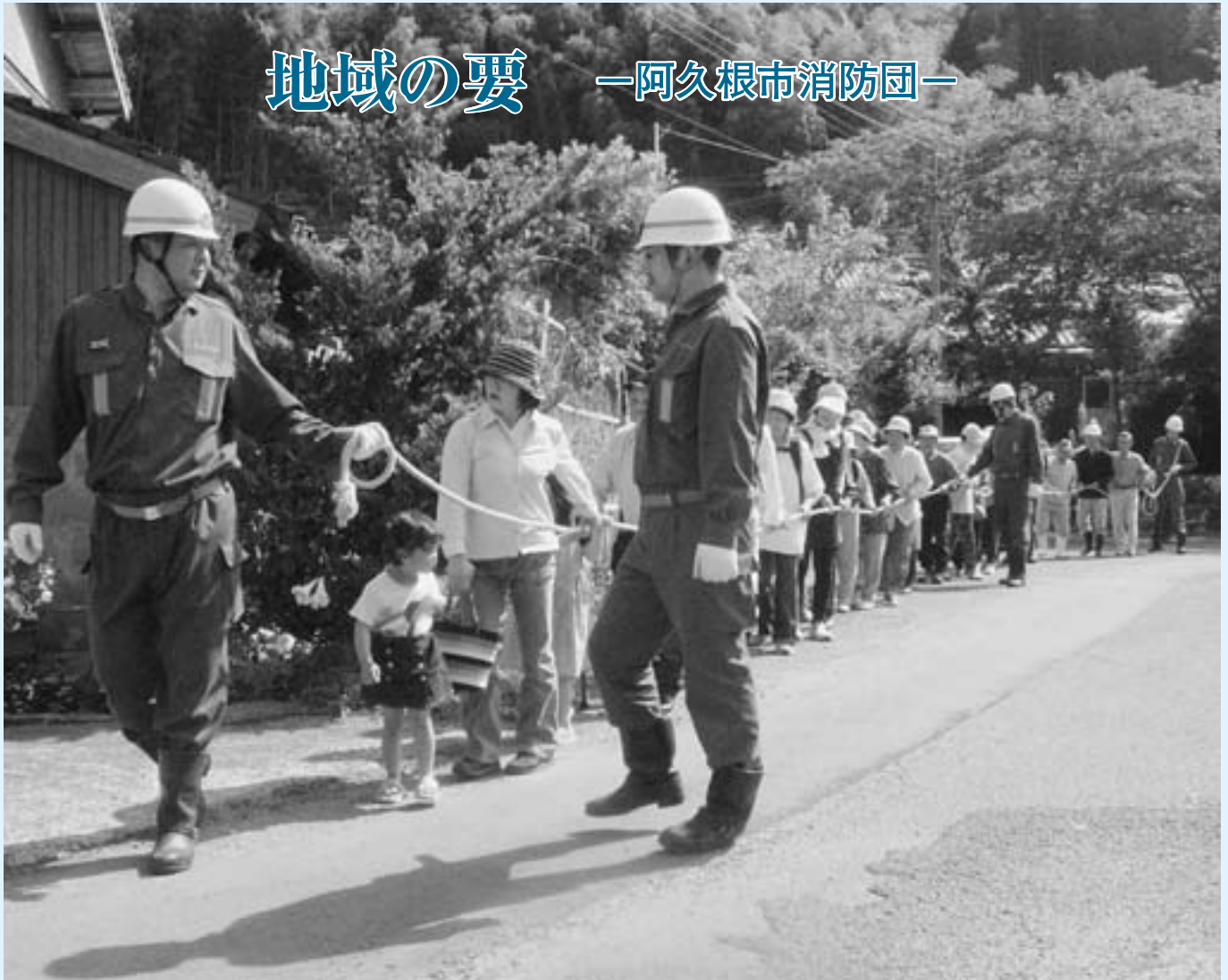
ロープを使い地域住民を避難誘導する消防団員（6月1日 阿久根市防災訓練 川畑中区）