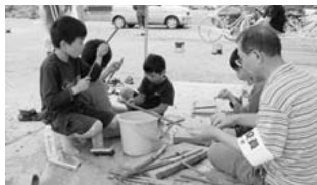
役員の方の手ほどきを受け、真剣な表情で「紙でっぼう」を作る子どもたち