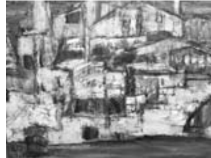
第9回AKUNE洋画大賞受賞作品 (一般の部)