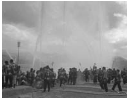
S37年の出初式 市中行進(上)・一斉放水(下)

このコーナーでは、阿久根の歴史を振り返り、懐かしんでいたため、昔と今の写真を紹介します。懐かしい建物や風景などの写真をお貸しいただける方は、秘書広報係へご連絡ください。 ※連絡先 総務課秘書広報係 電話(73) 1211 (内線1214)