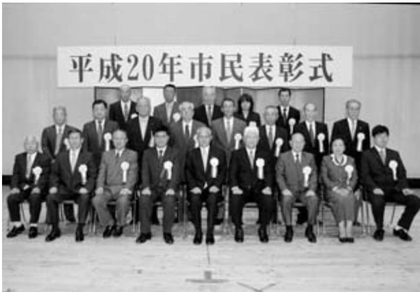
表彰された方々 (5月29日 市民会館)

平成20年市民表彰式が5月29日、市民会館大ホールで盛大に行われました。表彰式では、地方自治や教育文化、産業経済などの各分野で市勢発展に多大な功績のあった18名7団体が表彰されました。なお、受賞者は次のとおりです。(敬称略)