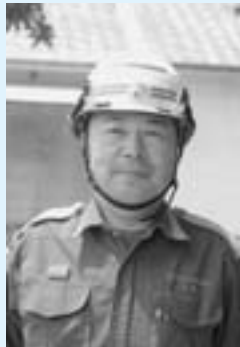
的場 博俊 阿久根消防署長

阿久根消防署では、市民の皆様の安全な暮らしのため、消防団と連携し、防火宣伝や火災を想定した厳しい訓練を日々重ねております。