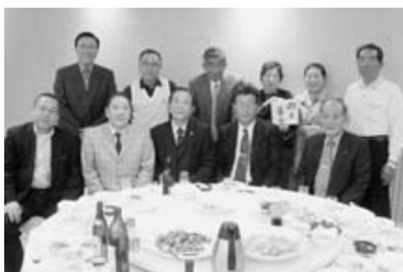
近畿地区阿久根会総会 (4月13日 大阪市)