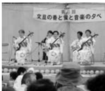
ボンタンが並べられたステージで三味線交流を披露する出演者

緑の募金を本市へ寄付 5月23日、西目小児童会が「みどり豊かなまちづくり」に役立ててくださ」と緑の募金を本市へ寄付しました。