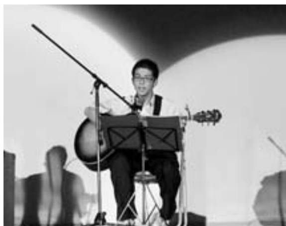
ステージでは、ダンスや歌、軽音楽などがあります