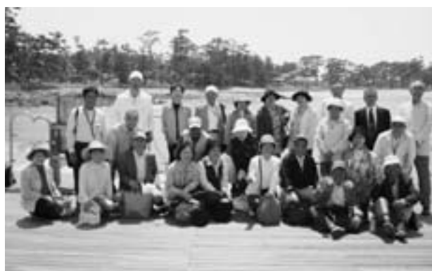
西目小S26年卒 古希同窓会

また、同窓会では、旧友と焼酎などをくみ交わしながら、思い出話に花が咲き、楽しい一日となりました。