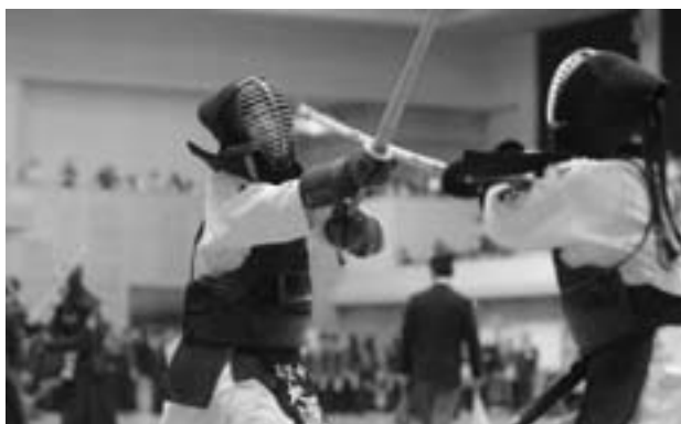
日ごろ鍛えた技を競う選手たち

5月5日、市総合体育館で第14回阿久根市長旗争奪全国中学選抜剣道大会が開催されました。今年の大会には、北は北海道から南は沖縄まで、全国各地から72校108チーム（男子69チーム、女子39チーム）が出場し、白熱したハイレベルな試合を展開しました。