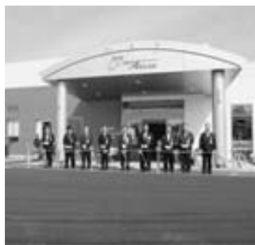
オープンを祝い多数の関係者が出席し行われたテープカット

サテライト阿久根がオープン 熊本市営競輪の場外車券売場「サテライト阿久根」が3月13日、多数の関係者らが出席しオープンしました。本市は、売り上げに応じて熊本市などから環境整備費として一定の協賛金を受け取ることになり、年間1千万円ほどが見込まれています。