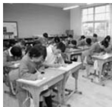
毎朝、「読み・書き・計算」の課題に取り組む脇本小の児童

子ども会花壇コンクールについて 3月20日、阿久根市子ども会育成会連絡協議会主催による花壇コンクール審査が行われました。参加した20単位子ども会の花壇は、いずれもよく手入れがなされていました。 なお、審査結果は次のとおりです。