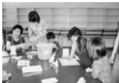
(親子ふれあい講座)