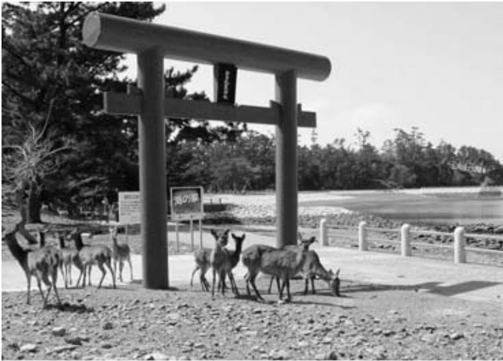
かわいいシカが来島者をお出迎え