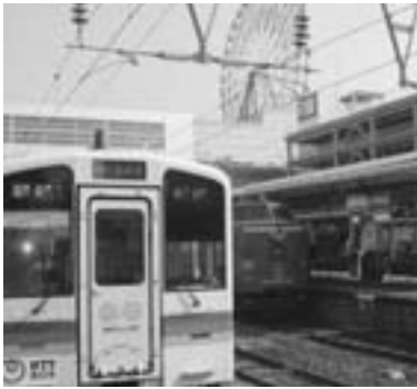
鹿兒島中央駅に乗り入れた「オーシャンライナーさつま」 (後はアミュプラザの観覧車)