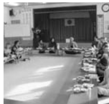
日頃の感謝の気持ちを込めて妻らに料理をふるまう男性の参加者

サテライト阿久根がオープン 熊本市営競輪の場外車券売場「サテライト阿久根」が3月13日、多数の関係者らが出席しオープンしました。本市は、売り上げに応じて熊本市などから環境整備費として一定の協賛金を受け取ることになり、年間1千万円ほどが見込まれています。