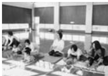
(親子リフレッシュ体操)