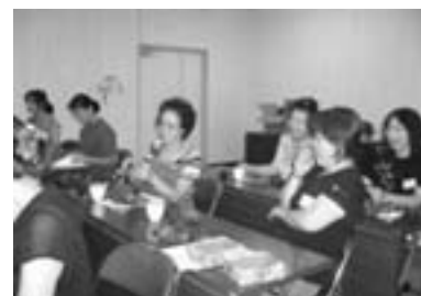
(プリザーブドフラワー)