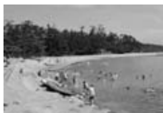
海水浴シーズンには大勢の人たちでにぎわう美しいビーチ

身近なリゾート「アイルランド」あくね大島 「あくね大島」は、市街地の約3キロ沖に浮かぶ無人島です。島内には野性のシカ約130頭が住み、直にふれ合うこともできます。また、ビーチの水質はAA級と、全国でも有数の美しさを認められており、平成18年には環境省から「快水浴場百選」に選定されました。 休日は、自然豊かで身近な「あくね大島」で、家族や友人らと思いいに残る一日を過ごしてみませんか。