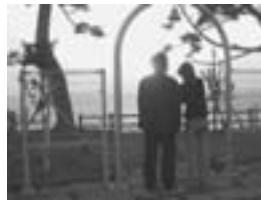
東シナ海に沈む美しい夕日を見ながら「幸福の鐘」を鳴らすカップル