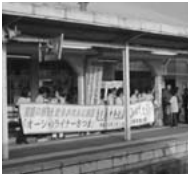
「オーシャンライナーさつま」を迎える大勢の方々 (3月15日 阿久根駅)

なお、この日から肥薩おれんじ鉄道は、熊本駅にも土日祝日に1日2往復の乗り入れを開始しました。