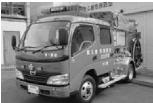
地域防災の要として 大川分団に配備された新型消防車

消防団の組織再編と資機材の更新、充実に取り組んでまいりましたが、平成20年度からは、更に人材育成と訓練を重ね、常備消防や消防関係機関と連携強化を図り、地域住民の守りの要として、各種災害に迅速に対応できる組織と技術を構築してまいります。