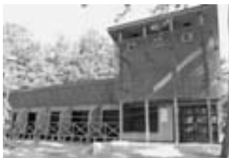
ゴールデンウィーク中は宿泊できる海の家