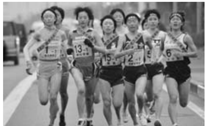
早春の阿久根路を駆け抜ける高校生ランナー