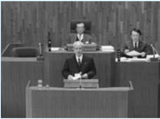
施政方針を表明する斉藤市長