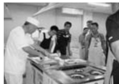
(男子厨房に入る会)