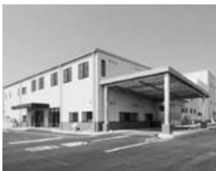
4月1日から稼働開始した「エコリア北薩」