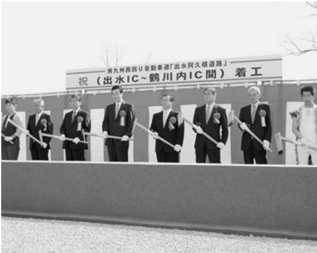
道路建設予定地で行われた鍬入れ式 (阿久根市多田地区)