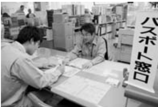
市役所で4月1日から始まった旅券（パスポート）発給事務

平成22年度を完成目標に用地・補償交渉が進められ、一部工事に着手されており、引き続き早期整備を強く要望してまいります。