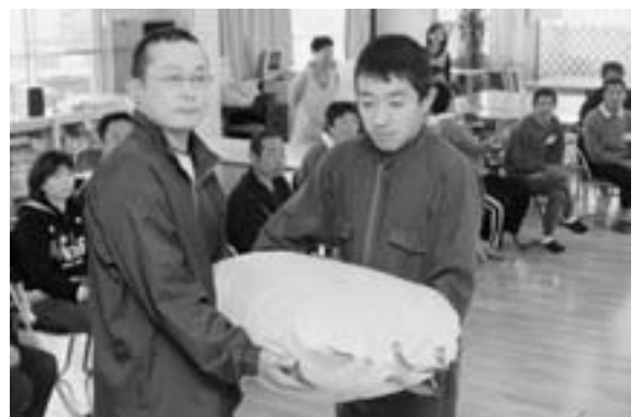
モチ米を贈る筒会長(左)

これは、同クラブが地域貢献活動の一環として行ったものです。モチ米の贈呈を受けた双葉作業所は、「モチつきに使わせていただきます。大変ありがたいです」と感謝していました。