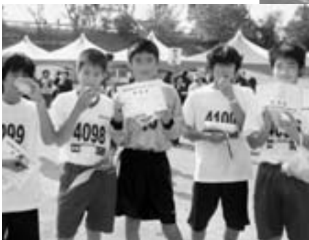
▼見事、完走し、ふかしイモな どを食べる中学生

12月10日、第23回あくねボンタンロードレース大会が開催されました。約2千百人のランナーは沿道に詰めかけた大勢の市民らの声援を受け、黄色く色づいたボンタン路を楽しみながら走り抜けていました。