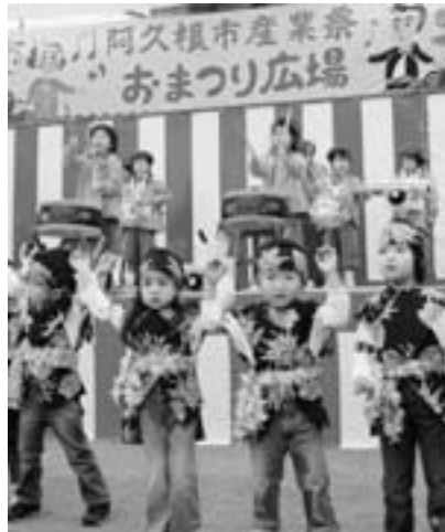
お遊戯を披露する園児

12月16日、17日、年末恒例の産業祭「アクネうまいネ自然だネ祭り」が、総合運動公園内多目的雨天屋内練習場で開催されました。「食のまち阿久根」ならではの新鮮な水産物や農産物、加工品などの特産品が、市価より安く販売されるとあって、会場内は、大勢の買い物客らで、にぎわっていました。