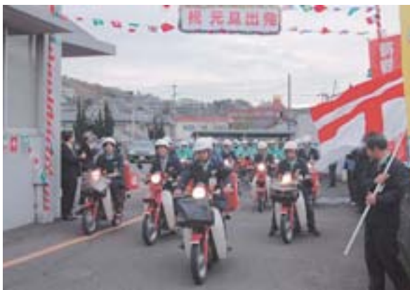
阿久根郵便局 年賀はがき出発式 (平成19年元旦)