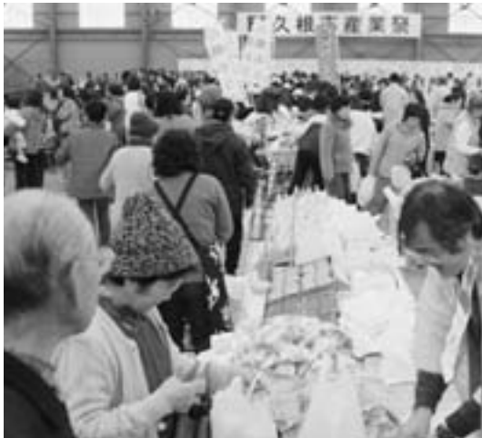
大勢の買い物客とずらりと並んだ特産品