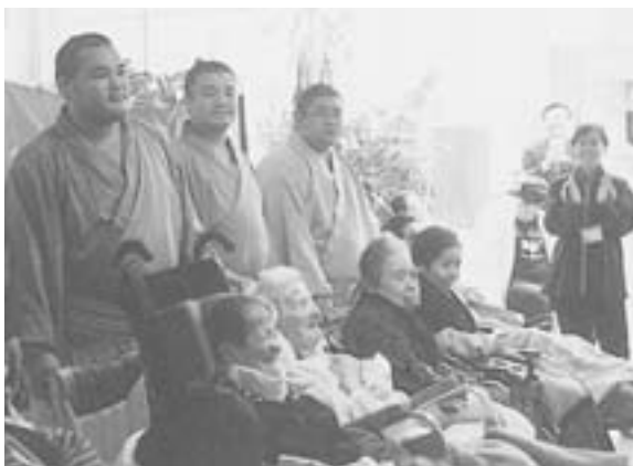
入所者と記念写真を撮る力士

交流会では、力士らが、入所者の質問に答えたり、相撲甚句を披露した後、一人ひとりに声をかけながら、握手していました。