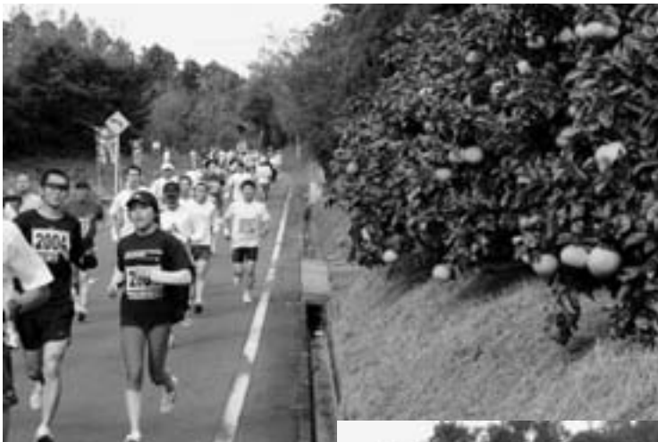
▲ボンタン畑沿いを走る選手