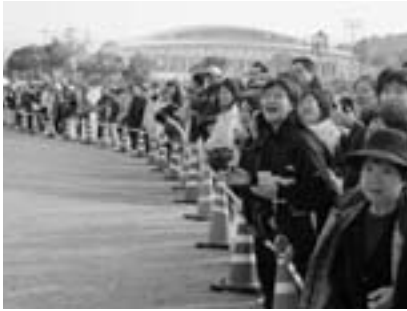
選手に温かい声援を送る大勢の観客