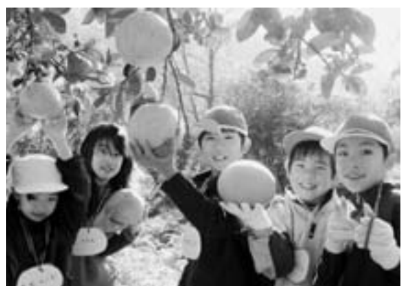
尾崎小と西目小のボンタン狩り交流(12月8日)