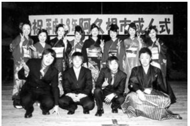
実行委員会の皆さん