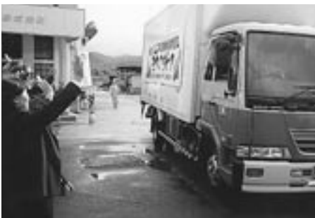
初出荷を見送る関係者