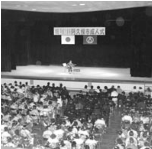
実行委員会が企画し行なわれたARTSリーダーBONソロライブ。会場は大いに盛り上がりました。