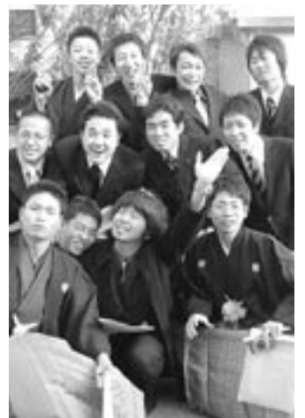
大人への仲間入り