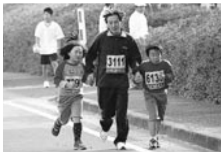
親子で仲良くゴールを目指す