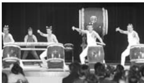
新成人を祝ってオープニングでの太鼓演奏 (阿久根太鼓「響流」)