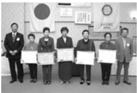
ロータリー会長らと受賞者した女性5名