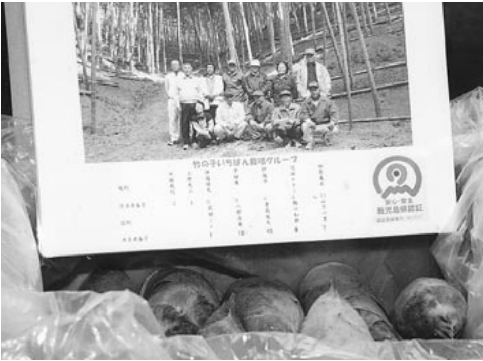
竹の子いちばん栽培グループの「モウソウチク」