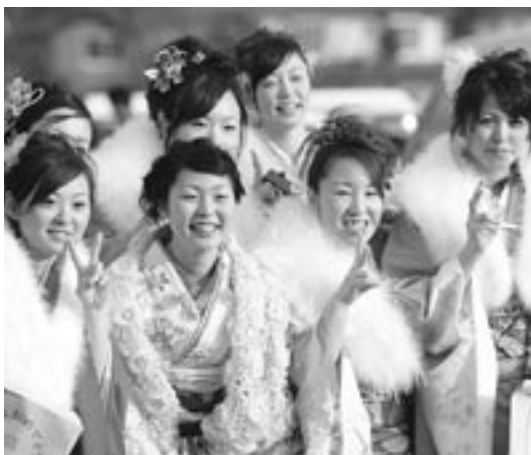
友達と仲良く記念写真