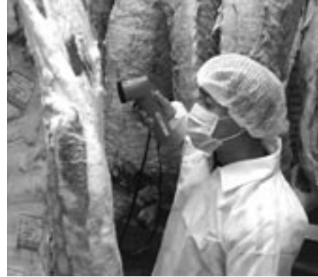
肉色やサシの具合などを入念に審査

児童らは、順番にきねを手にし「ヨイショ！ヨイショ！」とテンポよく高齢者と息を合わせ、モチつきに挑戦していました。