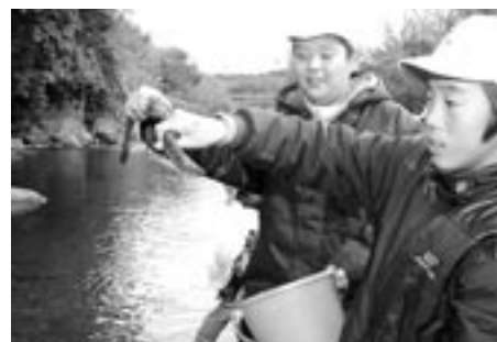
ウナギを放流する児童ら

12月6日、山下小の5・6年生32人が、高松川で30センチほどのウナギ計35キロを放流しました。