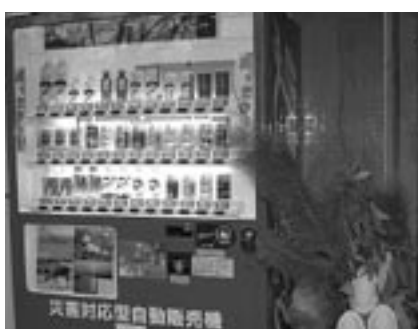
市民会館に設置された災害時対応型自販機