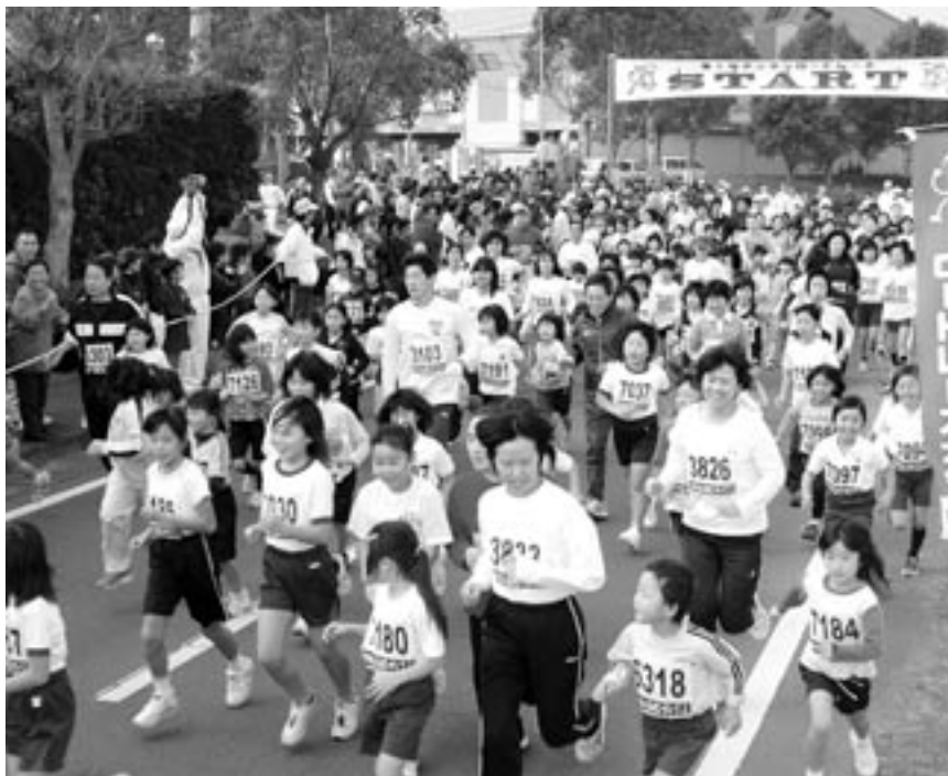
初冬のボンタン路に向けスタート!!