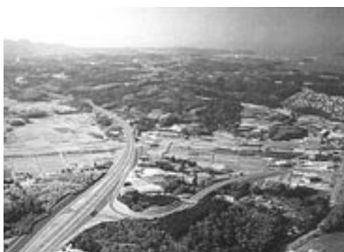
南九州西回り自動車道完成予想図 阿久根北インター上空から市街地を望む