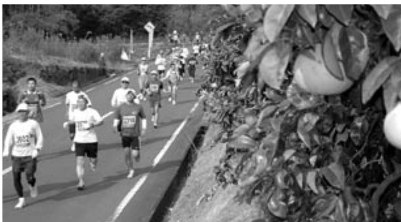
ボンタン畑沿いを走る選手たち