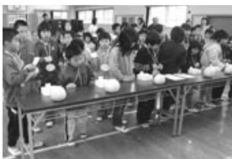
ボンタンを審査し合う児童たち

その後、尾崎小の体育館で収穫したボンタンをお互い品評しあい交流を深めていました。