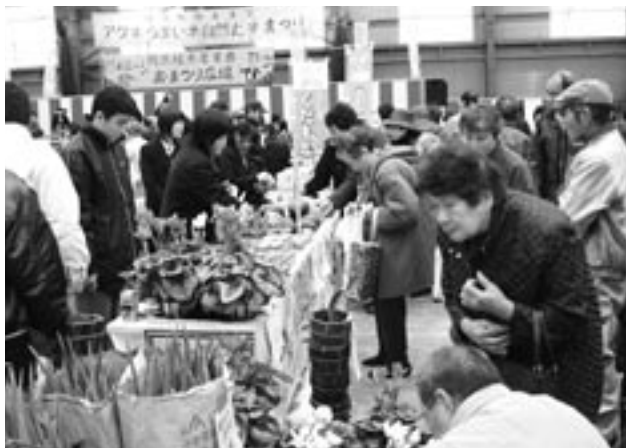
大勢の買い物客らでにぎわった会場

このほか、ステージイベントには、市内の保育園児や小学生らが出演。郷土芸能や竹太鼓などを披露し祭りを盛り上げ、詰め掛けた保護者らは、温かい声援や拍手を送っていました。