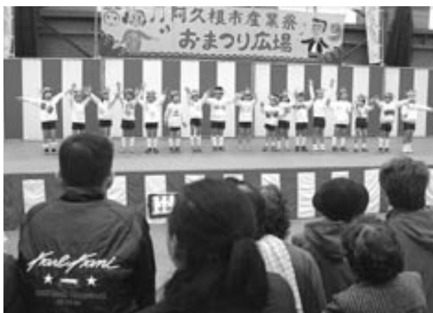
保護者らが見守る中、おゆうぎを披露する園児たち