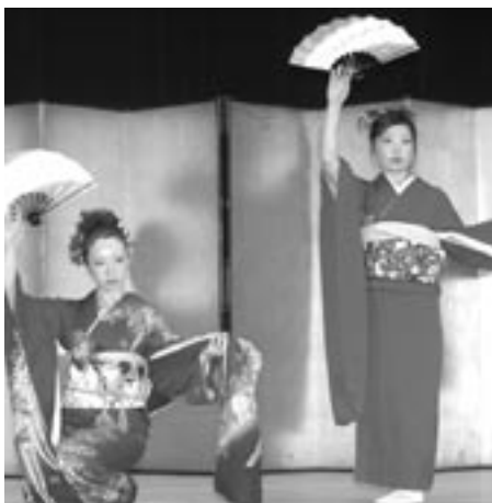
新成人による祝儀舞

1月5日、平成18年成人式が市民会館大ホールで盛大に開催されました。今年成人を迎えた昭和60年4月2日から昭和61年4月1日に生まれた323人が出席し、新たな門出を祝いました。 式では、多くの来賓の方から祝辞があり、出席した新成人もすっかり耳を傾け、厳肅な雰囲気の中で行われました。そして、式典終了後は、友人たちとの再会に喜ぶ姿があちこちで見られました。 また、今年の成人式は、「自分たちで素晴らしい成人式にしよう」と、昨年9月から実行委員会のメンバーが集まり、祝儀舞やソロライブ演奏などを企画し、出席された来賓や家族の方から、「ひと味違った内容で、大変素晴らしい式典」との声が多く聞かれました。