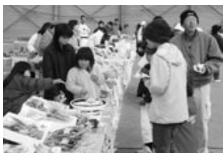
特産品フェアも同時開催