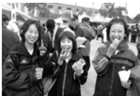
走った後のふかしイモは、おいしーい