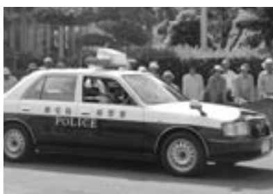
▲グラウンドゴルフ大会で交通安全講習を受ける高齢者の皆さん