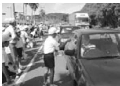
▲道の駅あくねで「ガランツ作戦」を行う大川小児童ら