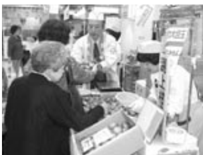
▲買い物客に大好評の阿久根の特産品

9月28日から10月4日まで鹿児島市の山形屋で阿久根物産展が開催されました。今回で40回目となる物産展には、阿久根の自然に育まれた果樹や農産物、水産加工品などの特産品が展示され、大勢の買い物客らに好評でした。