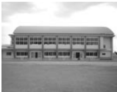
屋内運動場の外観

また、「三笠中学校体育館落 成実行委員会」が、体育館の施 設活用と施設備品の充実を図る ため、グラウンドピアノやどん帳 （電動昇降装置含む）などを寄 贈されました。