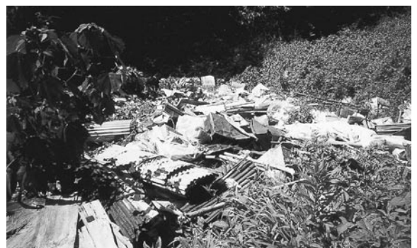
(鶴川内地区内の不法投棄現場)