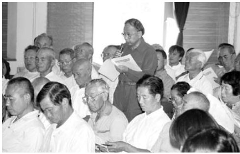
質疑応答では、出席者から多くの質問や意見が出されました。