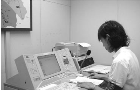
防災行政無線を使って避難を呼びかける一斉放送を流す訓練の様子

特に、今年4月に導入された防災行政無線を使つての初めての本格的な防災訓練とあって、サイレン吹鳴や無線放送による住民への避難勧告や避難解除の