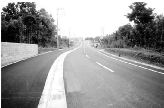
改良工事を完了した市道遠見ヶ岡線

このうちグランビューあくねと番所丘公園を結ぶ延長816mの区間について、通行の安全と利便性を図るとともに、観光・レクリエーション振興を目的として、平成6年度から総事業費1億7千万円、幅員10.5mで道路改良事業を行い、本年度完了しました。散策道としてもぜひ一度利用してみたいはかがでしょうか。