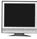
液晶ディスプレイ