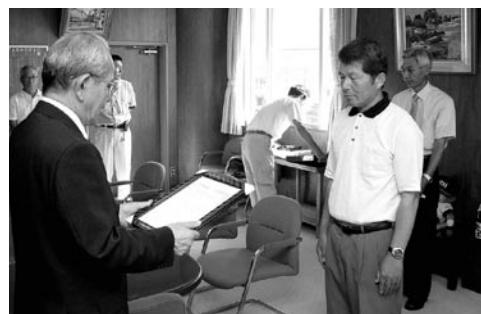
認定書交付式の様子

どの目標達成に向けてがんばりたい」とこれからの農業経営に向けた抱負を語っていました。