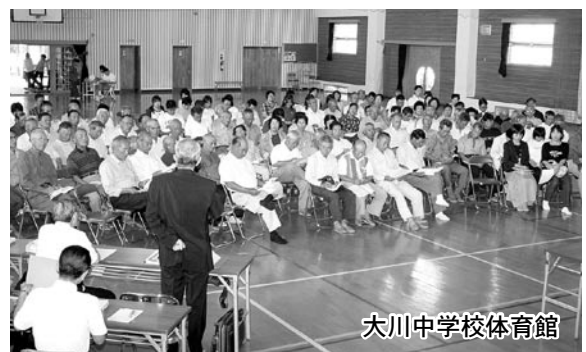
大川中学校体育館

市町村合併の具体的な枠組みをはじめ、合併特例法の期限である平成17年3月31日が近づくにつれて本市をはじめ隣接市町においても論議が活発化している市町村合併問題。 本市の将来にとって非常に重要なこの問題について、市民の皆さまにこれまでの経過や現状、出水地区2市4町に代わる新たな合併の枠組みなど、今後の取り組みに関する市執行部の方針を説明し、市民と意見を交わす「市町村合併に関する市民説明会」が9月27日に市民会館大ホールで、翌28日には大川中学校体育館と脇本地区公民館で開催され2日間で延べ約600人の市民が出席。市執行部から、これまでの経過や今後の取り組みについて説明がなされた後、活発な意見が交わされました。