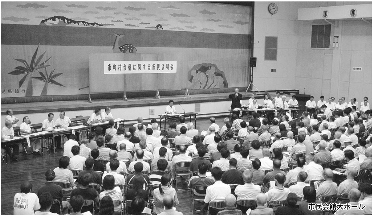
市民会館大ホール

市町村合併の具体的な枠組みをはじめ、合併特例法の期限である平成17年3月31日が近づくにつれて本市をはじめ隣接市町においても論議が活発化している市町村合併問題。 本市の将来にとって非常に重要なこの問題について、市民の皆さまにこれまでの経過や現状、出水地区2市4町に代わる新たな合併の枠組みなど、今後の取り組みに関する市執行部の方針を説明し、市民と意見を交わす「市町村合併に関する市民説明会」が9月27日に市民会館大ホールで、翌28日には大川中学校体育館と脇本地区公民館で開催され2日間で延べ約600人の市民が出席。市執行部から、これまでの経過や今後の取り組みについて説明がなされた後、活発な意見が交わされました。