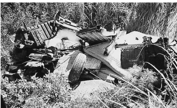
(赤瀬川地区内の不法投棄現場)