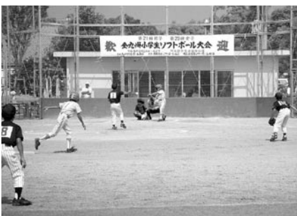
九州チャンピオンを目指し、熱戦をくり ひろげる選手たち。

◎女子の部 ①日置エンジェル ス(日置郡) ②北九州ガロピ ーヌ(福岡県) ③岩川女子(大隅 町)、長崎フレンズ(長崎県)