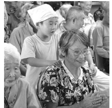
8月28日、市身障協と学童クラブの皆さんが市内の施設を訪問。入所者の皆さんと交流を深めました。

厚生労働省の平成14年簡易生命表によると、わが国の平均寿命は男性78・32歳、女性85・23歳で、世界的に見ても有数の長寿社会を迎えています。 本市においても、平成13年度の平均寿命は男性76・3歳、女性85・4歳、総人口に占める65歳以上の割合を示す高齢化率は30・93%（平成15年9月1日現在）に達しています。 一方、この8月は市内各地で地区老人クラブ連合会等の主催によるスポーツ大会も開催され参加者の皆さんは、元気ハツラツと体を動かし、心地よい汗を流しておられました。スポーツに限らず、今日では年齢に応じて趣味の世界を広げたり、豊富な経験や能力を生かし社会参加やボランティア活動に取り組んだり、多くの方々が自分にあった生活スタイルで充実した人生をおくっておられます。 だれもが健康で安心して生きがいを持って生活をおくることのできる豊かな長寿社会の実現は、私たちみんなの願いでもあります。 9月15日は「敬老の日」。 おじいちゃん、おばあちゃんいつまでもお元気で過ごしてください。