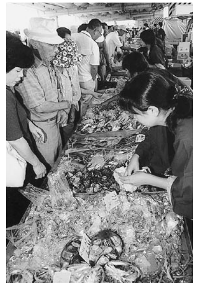
新鮮な魚介類がずらりとならんだ鮮魚コーナー

水揚げされたばかりの新鮮な魚介類や水産加工品などがずらりと並び、「あくね新鮮おさかな祭り」が8月10日、阿久根漁港新港水揚場でにぎやかに開催されました。