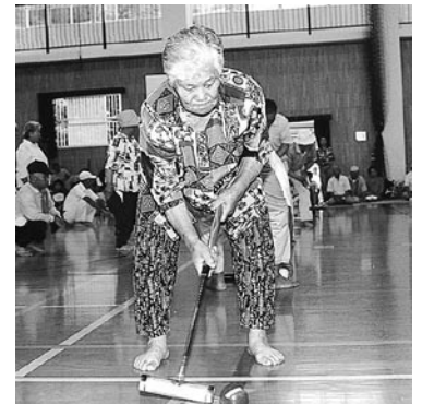
この8月、市内各地で市老連等の主催によるスポーツ大会が開催されました。元気いっぱい体を動かし、心地よい汗を流す参加者。