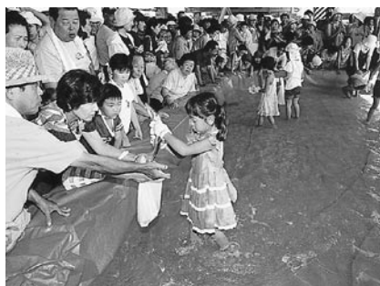
やったネ。今晚のおかずをゲット!

色とりどりの大漁旗が飾り付けられた水揚場の特設会場には安くて新鮮な魚介類を買い求め