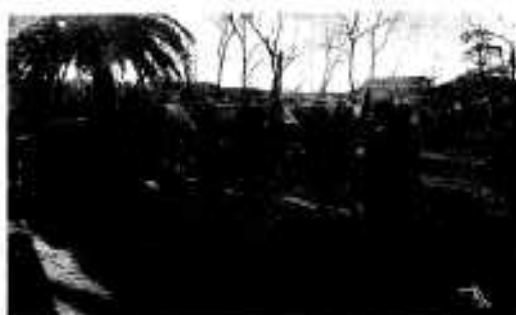
「人員、機材異状なし!」