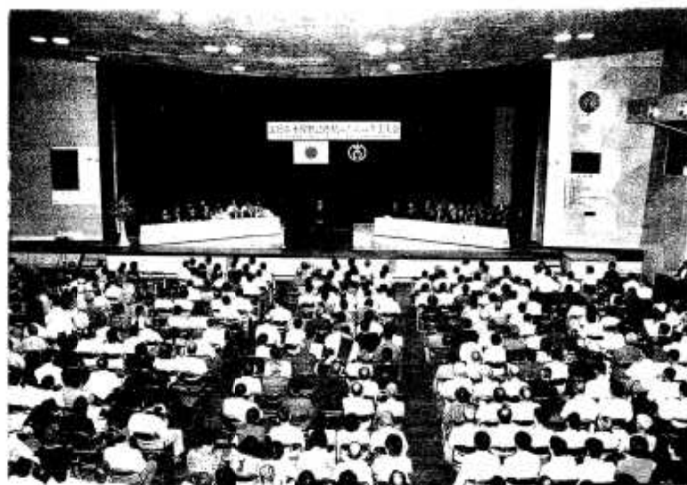
1,000人を超える市民が集まった市民集会

平成十五年度末にも完成が予定される九州新幹線鹿児島ルートの開業に伴いJR九州から経営分離される並行在来線川内一八代間の鉄道存続に向けて市民の思いをアブゾールしようと九月二十八日、「並行在来線鉄道存続のための市民集会」が市民会館大ホールで開催されました。