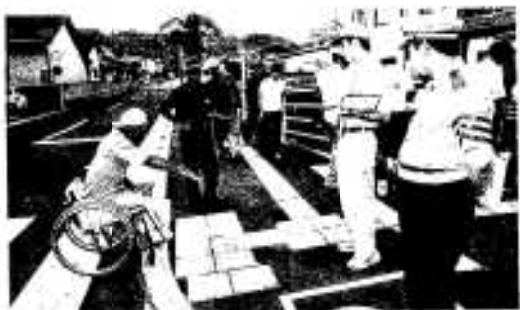
歩道の状態を細かくチェックする参加者ら

この日は、小中学生やPTA関係者、身体障害者協会連合会、警察、国・県・市の道路管理者