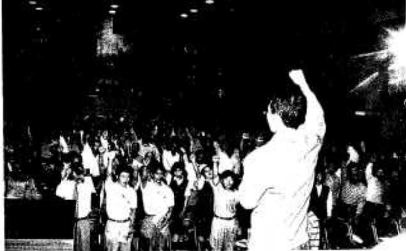
参加者全員による力強い「がんばろうコール」で鉄道存続をアピール