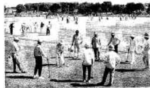
青空の下、グラウンド・ゴルフで交流