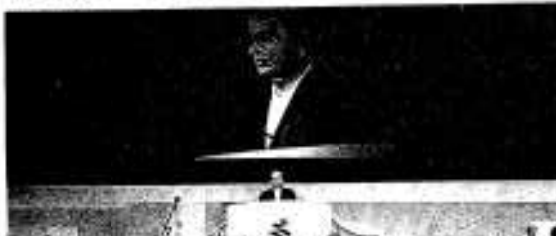
はばたけ 出水県体 21世紀の風になれ 第56回県民体育大会 出水大会

第56回県体出水大会は、本市をメイン会場に来年9月14・15日の2日間にわたり開催されます。