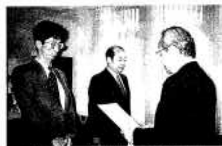
10月1日、県自治会館で行われた審査会委員の辞令交付式