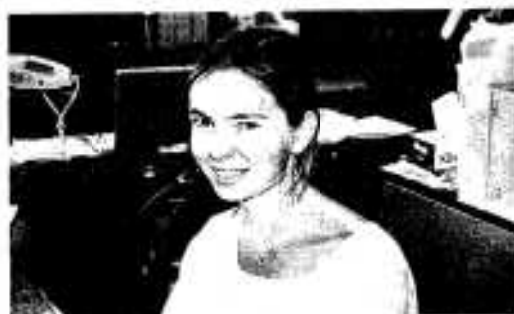
新しくALITに着任したキャララ先生