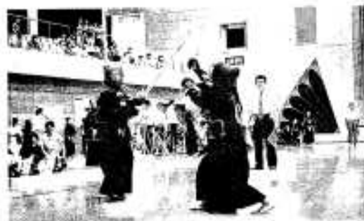
熱戦をくりひろげる選手たち

阿久根地区防犯組合連合会と阿久根警察署の主催による阿久根警察署管内防犯少年剣道大会が八月二十二日、市総合体育館で開催されました。