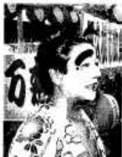
この人は誰でしょう?