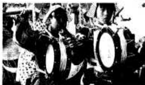
▲掘土芸能や太鼓など盛りだくさんのステージイベント