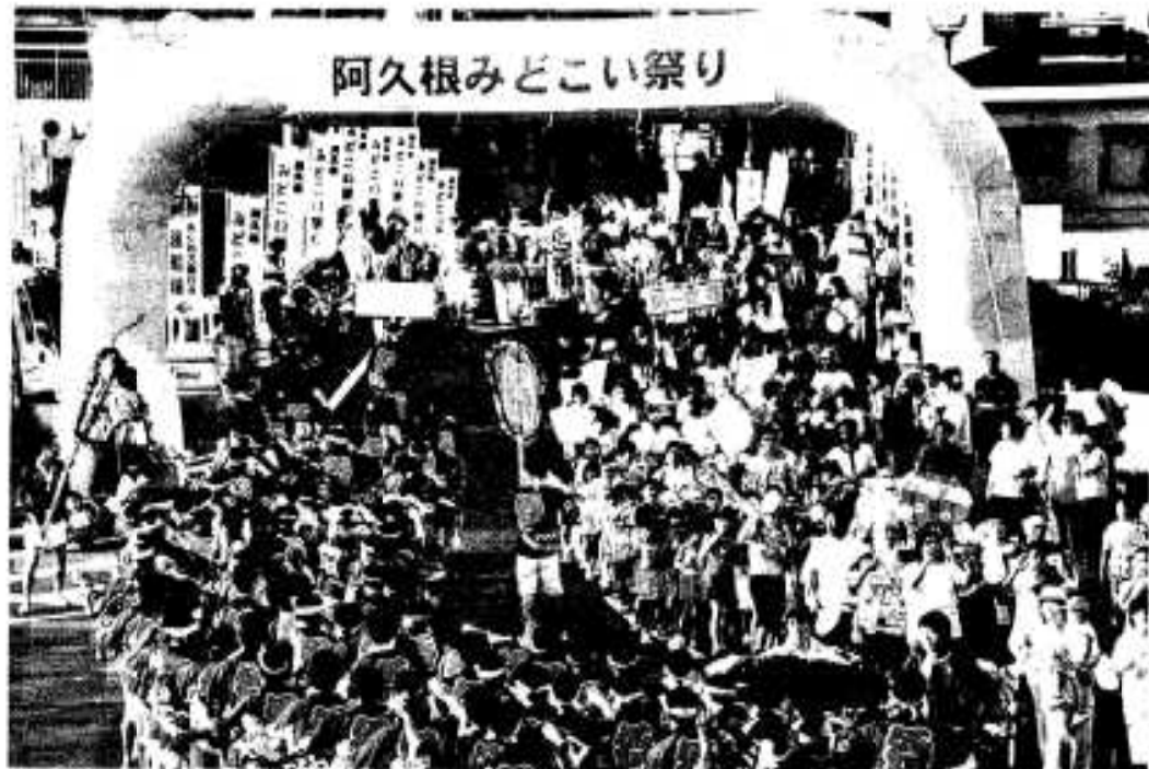
阿久根みどこい祭り