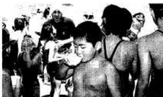
一杯のぜんざいが疲れをいやします