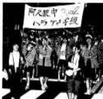
クラスメイトで仲良く参加。仮装大賞は阿久根市漁協、よくお似合いました!