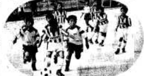
▲暑さなんかへっちゃら。元気にグラウンドを かけ回る子供たち（ちびっ子サッカー大会）