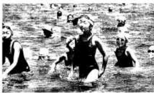
無事ゴール。がんばったネ!

時間半で全員無事に保護者らの待つ五色浜に到着しました。閉会式。完泳の証である賞状