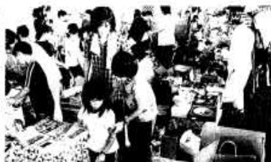
▶日用雑貨から洋服まで いろいろ並んだ フリーマーケット