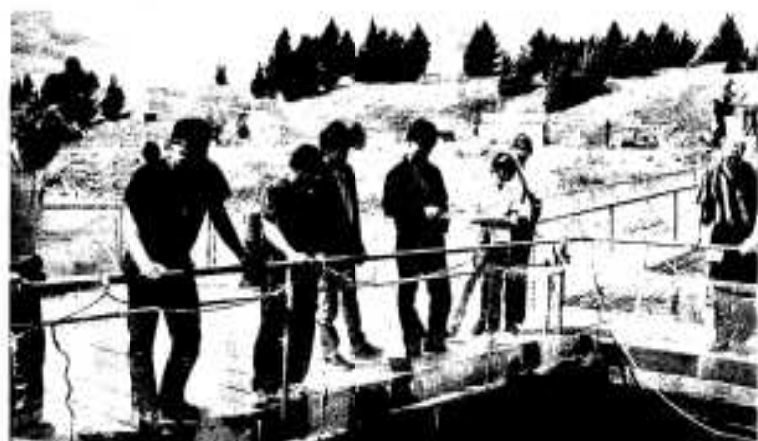
写真は、昨年度の研修の様子(サケの養殖場にて)

海外研修を通してグローバルな視野と豊かな感性を養い、地域のリーダーとして次代を担う人材を育成するため、阿久根市人材育成基金を活用して、海外研修を実施します。