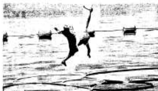
オットット！狙いをよく定めて…水上ターザン