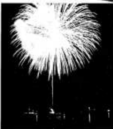
▲祭りのクライマックス・夜空を彩る 4000発の花火