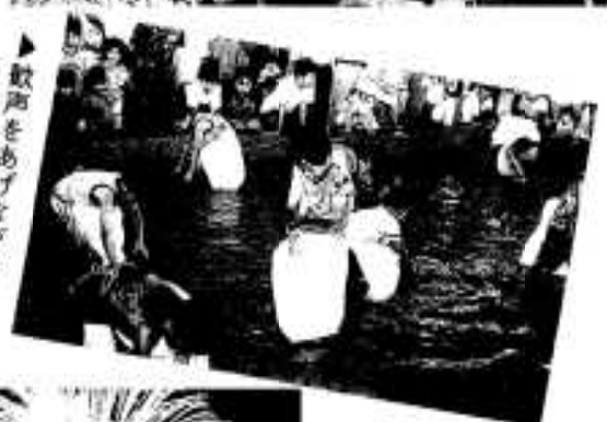
▶敵声あげながらうなぎ を追いかける子供たち （うなぎつかみ大会）