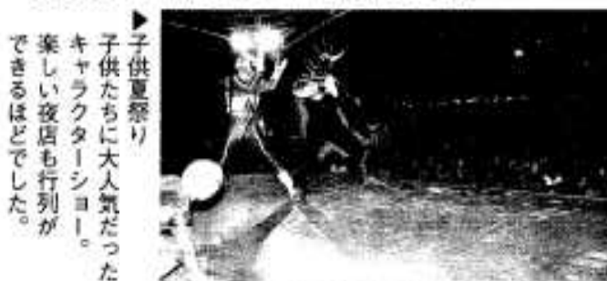
▶子供夏祭り 子供たちに大人気だった キャラクタージョー。 楽しい夜店も行列が できるほどでした。