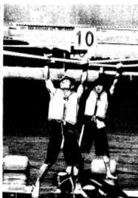
みどこい名物 人間ロープウェイ 1本のロープを腕力を頼りに渡ります

た「伝馬船競争」。みんなで力を合わせてオールをこいだ「ベクトルボートレース」。祭りのイベントとしてすっかり定着したマリリンピックに今年も大勢の皆さんが参加。大人も子供も一緒に楽しみました。