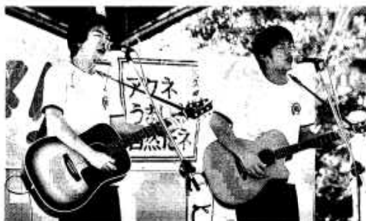
▲女性を中心に大勢のファンが集まった「なまず」のコンサート この後、ハンヤ踊りパレードにも飛入り参加