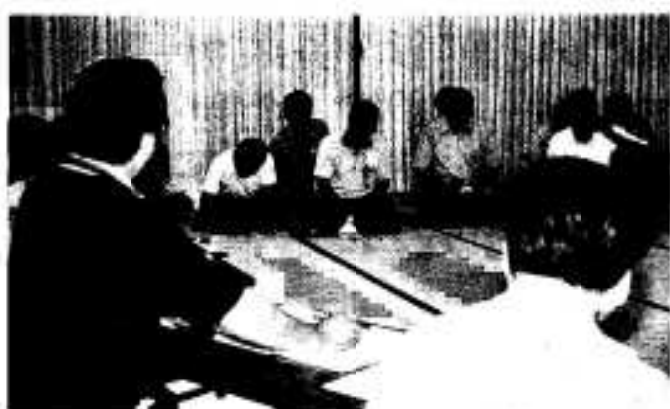
各地区で開催された懇談会では、市の将来像について様々な意見や要望が出されました。

六月二十六日の山下・尾崎地区を皮切りに、七月五日の西目地区まで八ヶ所で開催された地区別懇談会には、連日大勢の地区住民の皆さんが参加されました。