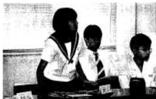
阿久根の将来を担う中学生の皆さんによる熱心な意見交換

FAX: 72-2029 / Eメール: akunesi@po.synapse.ne.jp