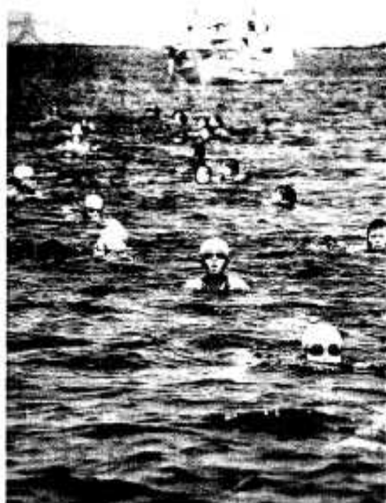
隊列を組み、けんめいに泳ぐ子供たち

阿久根大島から五色浜までの約三キロの遠泳に市内の小学生たちが挑戦する、海のまち阿久根の伝統行事「海の子カーニバル」が七月二十日に開催されました。これは、「海の日」にちなんで子供たちが海のたくましさや身をもちて体験し、海に親しみながら心身を鍛えるようにと市及び市教育委員会が主催しているものです。