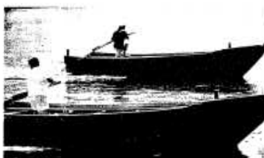
見事な漕ぎっぷり……伝馬船競争