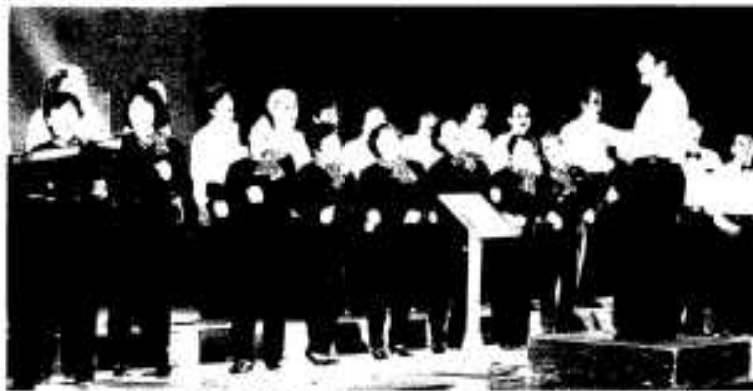
生涯学習社会の形成と文化の香り高いまちづくりを推進

豊かな自然風土と輝かしい歴史と伝統を活かし、心身ともにたくましく健やかに個性豊かな青少年の育成につとめ、生涯学習社会の形成及び文化の香り高いまちづくりを推進します。