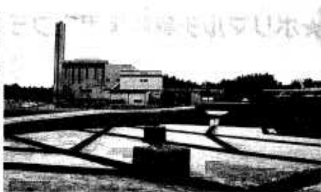
広域的な連携・交流を深めながら広域行政を推進します (写真は今年3月に完成した環境センター最終処分場)

環境対策はもとより、医療・福祉の人的・物的ネットワークの形成、広域観光ルートの推進など、さらに交流と連携を深めていきます。