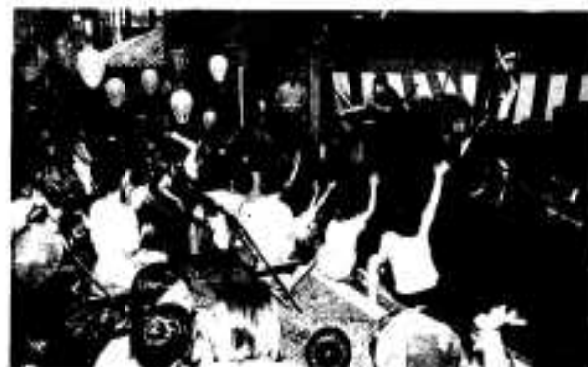
市民が主体となるまちづくりを推進 (写真は源兵衛どん祭り)

活動による個性的で豊かな地域社会を作るため、地域の人々の活動を見つめ新しいまちづくりのパートナーとして地域住民との協働を進めます。プランの策定段階から施策推進にいたるまで行政推進に住民が参画し、市民が主体となるまちづくりのための条件整備を促進するとともに自主的・主体的にまちづくりに参加できる人材の育成に努めます。