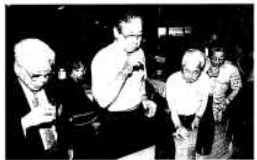
どれが一番美味しいかな?

メーカー大石酒造(株)と鹿児島酒造(株)阿久根工場の協力を得て両社の焼酎をブレンドした新しい焼酎を作ろうという試みで、配合比率の異なる四種類の中から全員できき酒をした後、投票で一番人気の高かったブレンドの焼酎を選定。また同時に焼酎の名前についても投票が行われ、記念すべき焼酎名は「浜んこら」に決定されました。