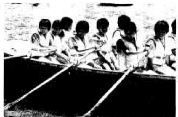
生き生きとした心豊かな阿久根っ子(写真はカヌー・カッター教室)