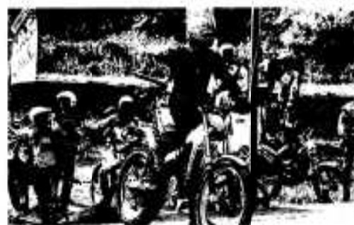
スタート前、緊張の瞬間

これは、自分たちの住むまちの魅力を活かして何か出来ないものかと同地区の表川内青壮年会が主催して一昨年から始まったもので今年で三回目。九州各地はもとより遠くは京都府からの参加も含め、三十二名の選手が出場。今大会では初めて女性ライダーの姿もありました。