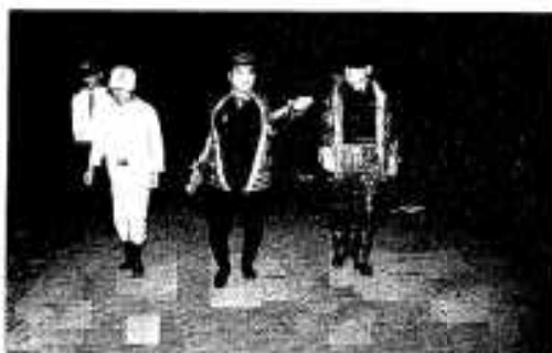
臨本海岸をパトロールする関係者たち