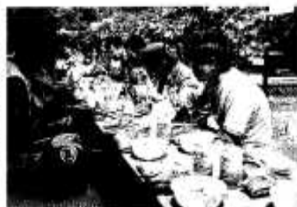
心のこもった手作りの昼食に選手たちも感激しきり

い経済文化圏を形成しながら地域の活性化をはかる構想です。この構想を推進する「島原・天草・長島架橋構想及び九州西岸軸構想推進地方大会」が五月十三日、同架橋建設促進協議会