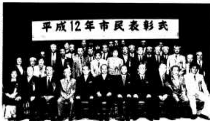
平成12年市民表彰式