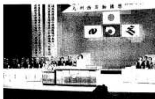
主催者を代表してあいさつする潮谷義子熊本県知事