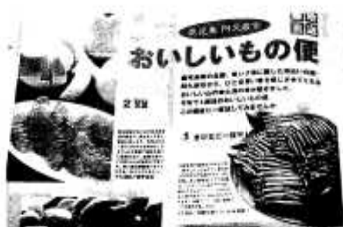
阿久根の特産品が紹介された「レタスクラブ」2月10日号

一月二十五日発売の生活情報誌「レタスクラブ」で、今年も本市特産品の誌上ショッピング「鹿児島阿久根市おいしいもの便」が掲載されました。