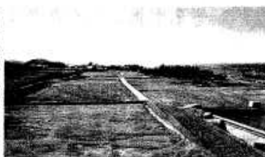
農地の利用集積をめざす牛之浜地区の構造改善事業

ける市民のための限られた資源であるとともに、生活及び生産に通ずる諸活動の共通の基盤であることを考慮し、自然環境や歴史的風土との調和、安全性、快適性に配慮し総合的かつ計画的な利用をはかります。