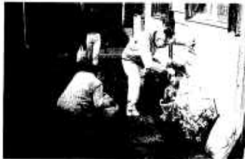
リサイクル社会に必要な不可欠な分別収集

ごみ処理については、大量生産、大量消費の経済社会や使い捨て社会を見直し、ごみの減量化に努めます。また、多様化する廃棄物の増大対策として広域