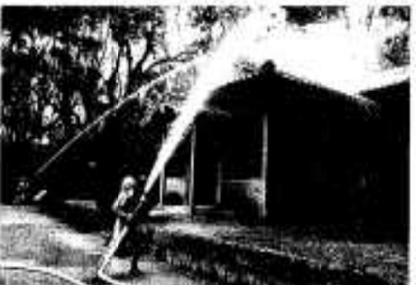
南方神社での訓練の様子

南方神社でも防火訓練 文化財防火デーの一月二十六日には、神舞が奉納されることで有名な南方神社で防火訓練も実施されました。