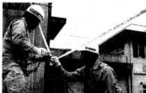
いざという時にそなえて、訓練にはげむ隊員たち

市民の生命と財産を守るため、火災を含む諸災害を未然に防ぐための災害防止思想の啓発を強化するとともに、迅速かつ確実に対応できる消防体制の充実と消防力の強化をはかります。