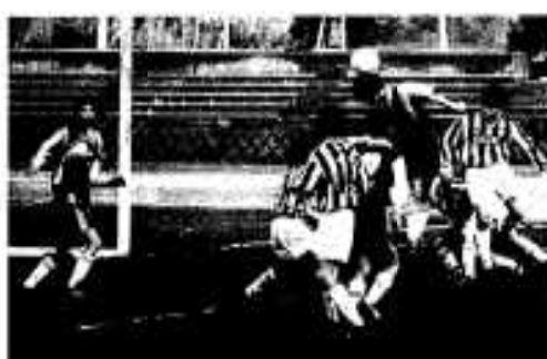
懸命にゴールを狙う選手たち