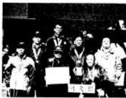
入賞した阿久根警察署チーム