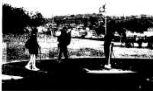
市民の憩いの場として整備が進む番所丘公園

本市の自然環境や歴史・文化を活かしながら広域的な利用に供する公園整備を進め、市民の憩いの場、コミュニケーションの場であると同時に防災機能を兼ね備えた整備をはかります。