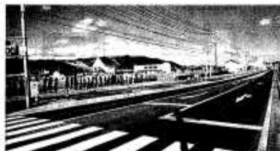
計画的な市街地形成により都市機能を充実 (写真は着々と整備が進む湯地区)

本市の恵まれた自然環境を保全する上から、地域にあった生活排水処理対策を検討し、適正な汚水処理に努めます。