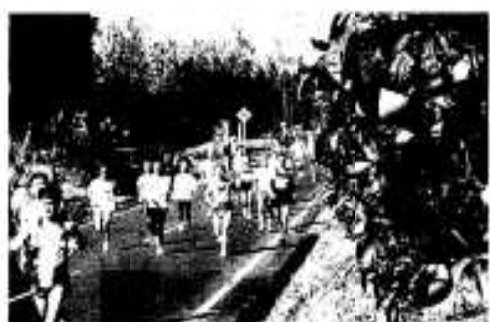
ボンタン路を駆け抜ける選手たち。

この他、市内の特産品などが当たるお楽しみ抽選会や特産品フェアなども開催され、選手や