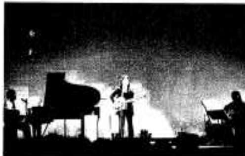
観客を魅了したコンサートの様子

歌手はもちろんのこと絵本作家としても人気のイルカさんですが、この日のステージは前半は司会者とのトーク、後半はライブの二部で構成。なかでも後半のライブでは、「なごり雪」などの懐かしい曲や新曲「光りのとびら」など十三曲を熱唱し観客を魅了していました。