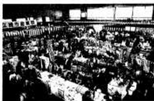
多くの市民が訪れた会場の様子

市内の特産品がずり大勢の買い物客でにぎわう市産業祭(アクネうまいネ自然だネまつり)