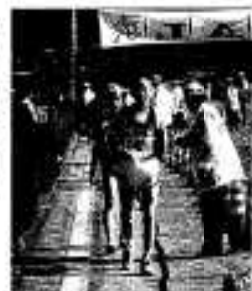
無事完走お疲れさまでした。

市内の特産品がずり大勢の買い物客でにぎわう市産業祭(アクネうまいネ自然だネまつり)