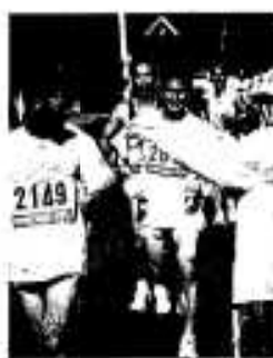
この一杯がうれしい。