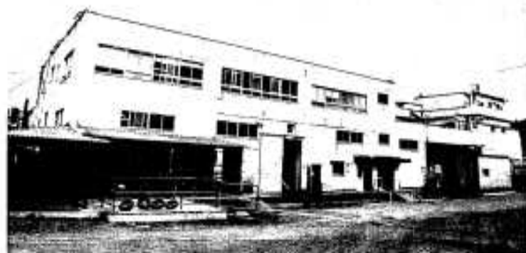
新会社として生まれかわるスターゼンミートグループ 阿久根工場と食肉センター

本市の基幹産業である畜産業と食肉加工業のさらなる発展のための拠点施設となる株式会社阿久根食肉流通センターが、十一月一日に設立されました。市ではこれまで市営と畜場として食肉センターを運営してきましたが、と畜場法の改正に伴い大幅な改修が予想されることから、今後のと畜業務の在り方について検討。今後は、市直営による事業を廃止し第三セクター方式による新会社にこれまでの業務を引き継ぐことが決定していました。