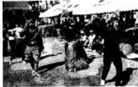
番外編も開催 応援合戦も大いに盛りあがりました。

また、今年初めて五十歳組の番外編が十月三十一日、鵜本小学校で開催されました。これは阿久根に嫁いでこられたり、仕事の関係で永年市内に居住してしながら卒業した小学校が市外のために五十歳組に参加出来なかつた方々にもあの感動をとの話しが持ち上がり、急ぎよ一ヶ月前に実行委員会が組織され準