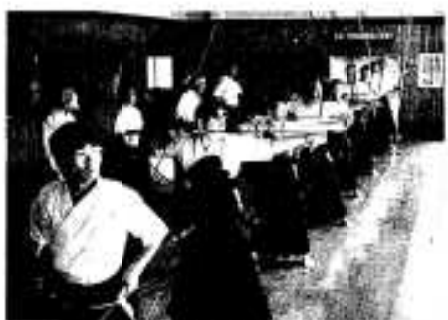
一心に的を狙う選手の皆さん