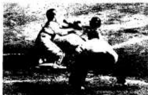
熱戦がくりひろげられた試合の様子