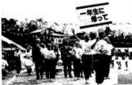
一年生に帰って堂々の入場 観客からは「お帰りなさい」の声も

後、早速男女別に在校生を交えてリレー競技が行われ、参加者らは久しぶりに童心に返り爽やかな汗を流しました。