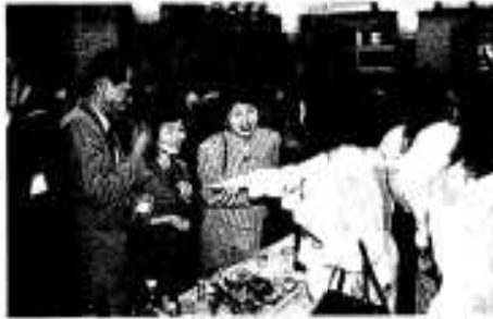
587名が参加したレセプション 話題は尽きません

くようにと、市の主催で平成二年度から毎年開催されています。会場では久しぶりに再会した懐かしい旧友と焼酎を酌み交わしながら、お互いの近況や思い出話に花が咲き、明日の健闘を誓い合う姿が会場の至る所で見受けられ、話題の尽きない楽しい時間はあつと言う間に過ぎていきました。