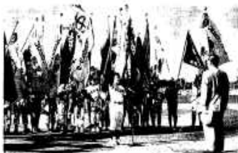
オール阿久根小学部松林主将の力強い宣誓