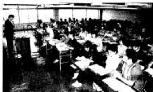
講師の話に耳を傾ける受講生の皆さん

いよいよ来年四月から介護保険制度が始まります。介護を社会全体で担うための新しい制度ですが、増大かつ多様化するニーズに対応したホームヘルプサービスを提供するためには、マンパワーの確保は必要不可欠です。阿久根市では、今後予想されるヘルパー需要に応えるために、阿久根市社会福祉協議会に委託して出水地区在住者を対象としたホームヘルパー養成研修の二級課程をスタートしました。九月六日には市中央公民館で開講式が行われ、第一期生となる今回、当初の募集人員を大幅に上回る七十九名の受講生が出席、介護保険に対する関心の高