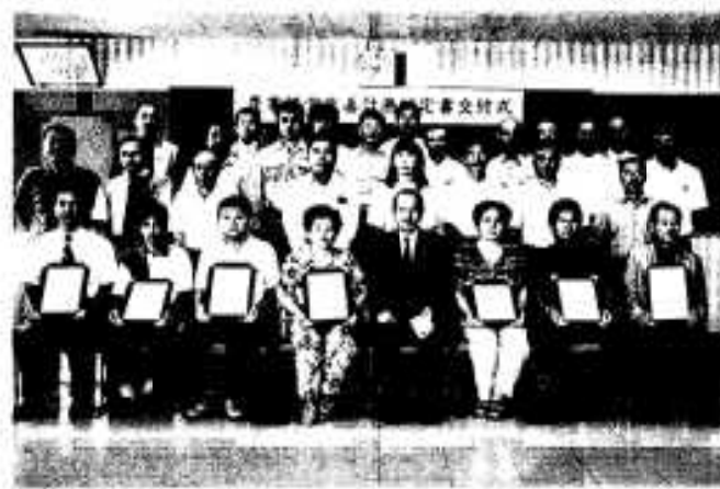
新たに認定された39名の方々

この制度は、農家の方々が営農規模の拡大など将来の経営像を具体的に示した農業経営改善計画を市が認定し、経営相談や融資など具体的な支援を行うことで農業経営の発展を目指すも