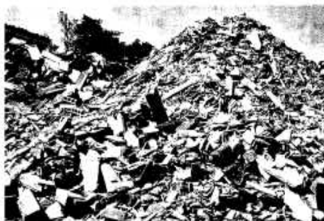
急きょ葬斎場駐車場に設置された 廃材置場にうず高く積まれたガレキやトタン