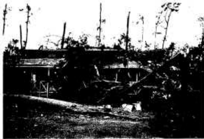
無惨に折れた松と損壊した海の家 (阿久根大島：真上)