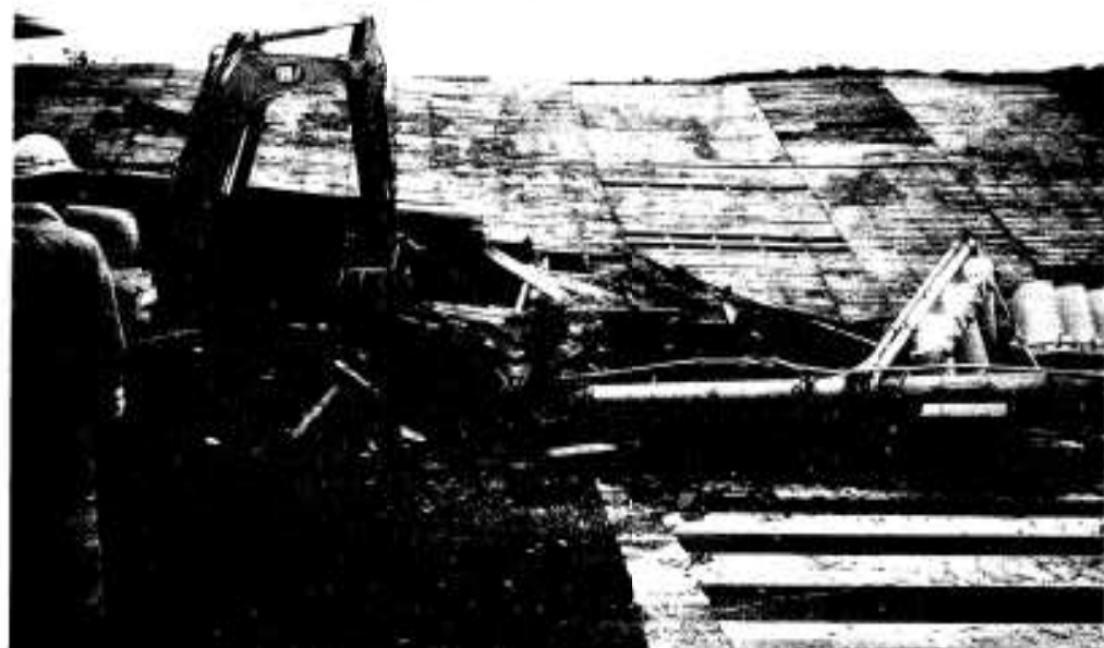
全壊した民家と折れた信号機