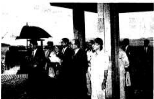
小雨の中阿久根大島を視察