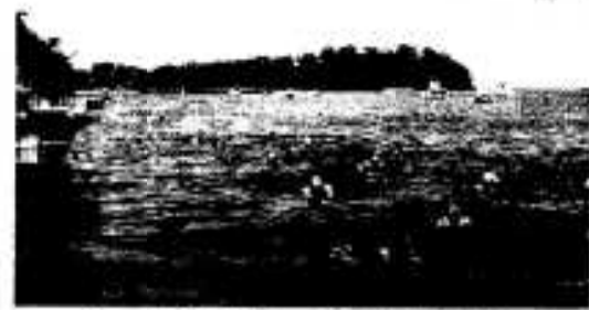
ゴールを目指して泳ぐ生徒たち

阿久根高校の遠泳大会は七月十六日、全校生徒三百四十四名のうち女子四十四名を含む百三名が参加して行われました。同校の大島遠泳は、昭和三十四年から続いている伝統行事で今年で二十六回を数えます。