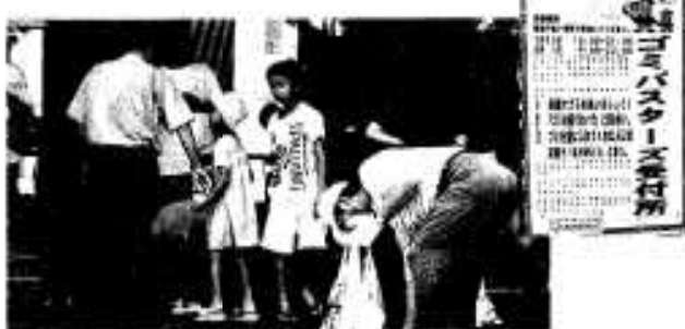
ゴミバスターズも大活躍

四十二団体、二三〇〇人が参加して練り歩いたハンヤ踊りパレード。海を利用したユニークな種目に参加者続出のマリンピック。本場石垣島の心に響く島唄ライブ。新鮮な海の幸いっぱいのお魚祭り。そしてクライマックスは潮風の心地よい新港の夜空を彩った四〇〇〇発の花火の競演。三日間にわたる夏の一大イベントは、多彩な催しに多くの市民の方々が参加し、おおいに盛り上がりました。来年の夏も、阿久根みどこい祭りでお会いしましょう。