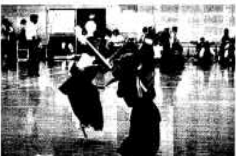
熱戦が繰り広げられた大会

【中学校男子の部】 △優勝 大川中学校▽準優勝 阿久根中学校▽三位 鷹巣中学校、三笠中学校