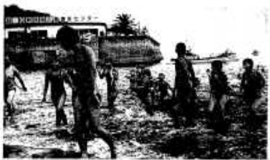
ヤッター、無事ゴールに到着

子どもたちは、隊列を組んで先導船を目標に定め、時折「ソール ソール」と元氣よく声を掛け合ったり、伴走の漁船から差し入れられる氷砂糖を頬ばりながら泳ぎ、十二時頃に保護者らの待つ五色浜に全員到着する