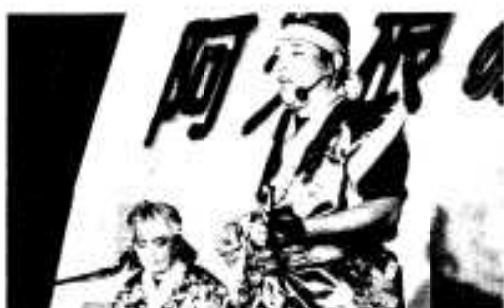
観客を魅了した本場の島唄ライブ