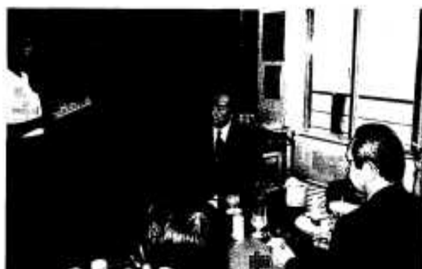
道の駅「阿久根」での様子

座談会に参加した各市町関係者からは地域の実情を踏まえた多くの意見や要望が出され、予定された時間ぎりぎりまで活発な意見交換がなされました。