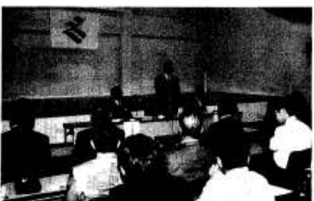
ふるさと座談会の様子