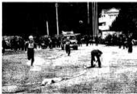
ポンプ車の部で優勝した大川分団