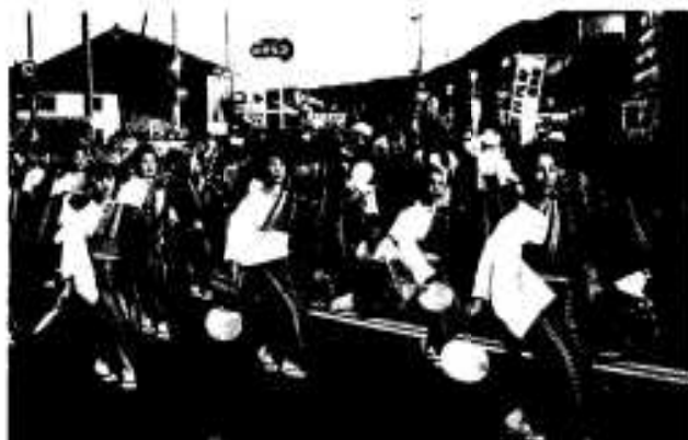
2300人が参加したハンヤ踊りパレード