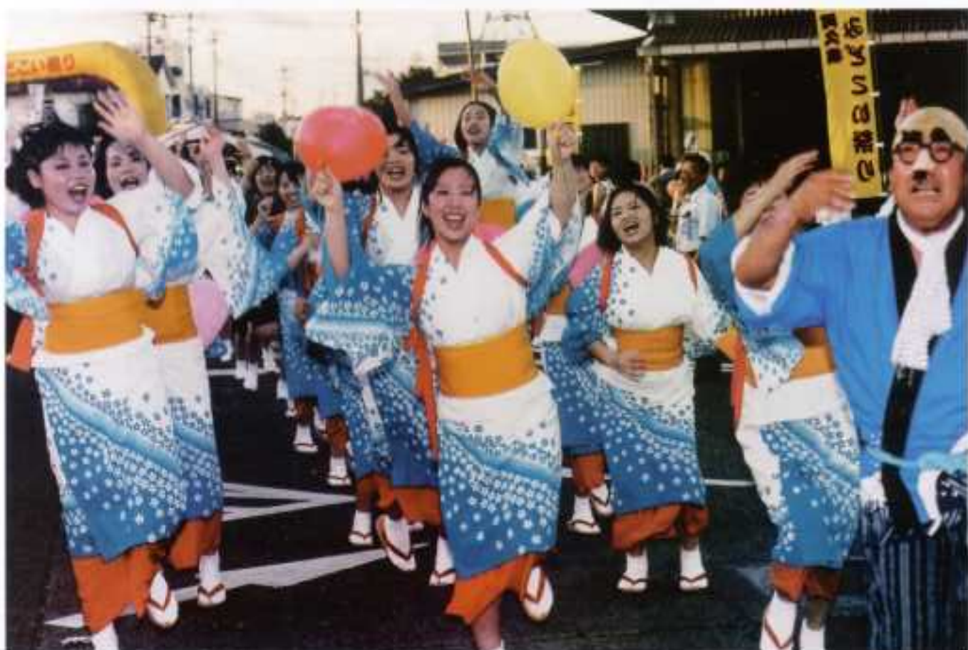
(ハンヤ踊りパレード)

編集・発行／阿久根市役所 総務企画課 〒899-1696 鹿児島県阿久根市鶴見町2-0-0番地