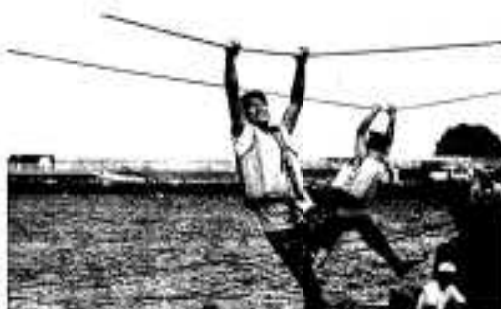
大人から子供まで挑戦したマリンピック