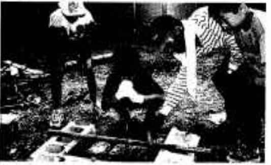
おいしいご飯が炊けたかな?

加賞が手渡されました。子どもたちは疲れた様子もなく、大きなことをやり遂げた満足と自信に満ちたいきいきとした表情を見せてくれました。