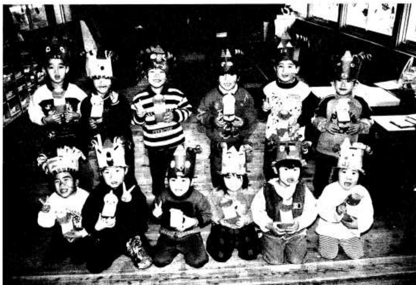
(黒之浜児童館の節分行事)

●●●● 編集・発行／阿久根市役所 総務課 〒899-1696 鹿児島県阿久根市鶴見町200番地